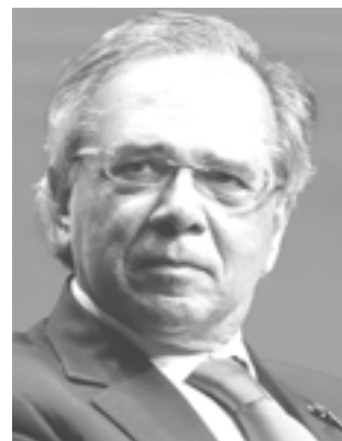
Paulo Guedes, Brasiliens finansminister, utbildad i Chicago under Milton Friedman