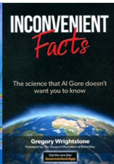
Tre läsvärda böcker om klimathysterin.

av vetenskapsmän som gått på tvären och ifrågasatt den gällande "sanningen". Galileo Galilei är det mesta kända exemplet. Han vände sig mot inte 97 procent av de dominerande vetenskapsmännen utan mot 99,9 procent. Och likafullt var det Galilei som hade rätt. Under senare år har vi till exempel haft "konsensus" om döende skogar och ökenspridning. Idag går utvecklingen åt rakt motsatt håll. Jorden blir grönnare både genom tillväxten