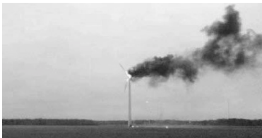
Den 22 mars 2007 brann ett av de gotländska vindkraftverken i Lummelunda upp. Brandkåren kunde som vanligt inte åtgärda branden.