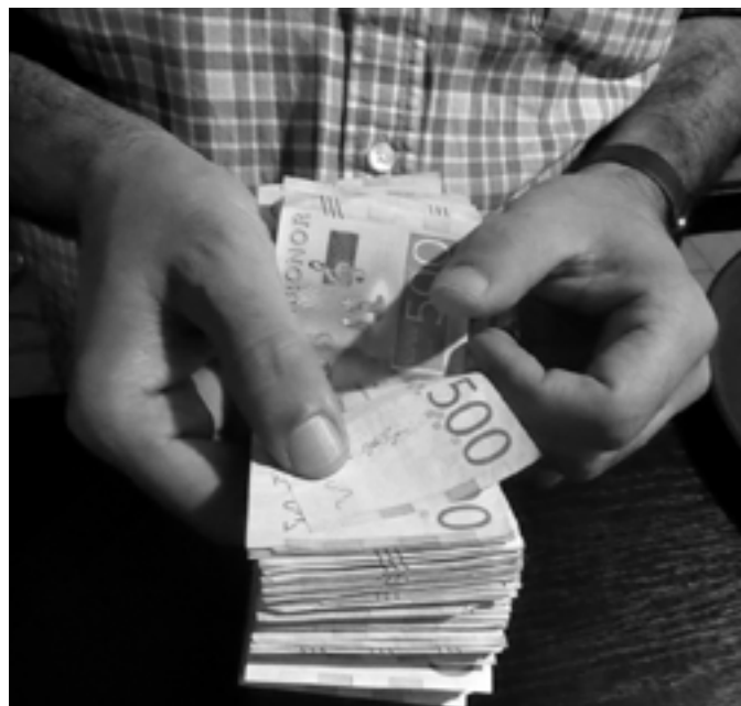
Allmänna Arvsfonden tar hand om pengar från avlidna utan legala arvingar. I de flesta länderna hamnar sådana pengar i statskassan. I Sverige går de vidare till ibland tvivelaktiga organisationer.

Det finns nästan ingen begränsning när det gäller fantasin på de projekt som har beviljats bidrag. Enligt tidningen Fokus (2018 nummer 2) så har en afasiförening fått ett bidrag på 919 000 kronor, för ett