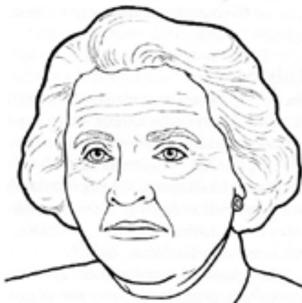
Madeleine Albright har misslyckats med att få ordning på Clinton-administrationens bankruttmässiga utrikespolitik.

Redaktionens tillägg: Denna artikel skrevs före de senaste amerikanska bombningarna mot Irak, Gingrichs avgång som representanhusets talman och den senaste Kosova-krisen, men vår Washington-korrespondents slutsatser är fortfarande aktuella – mycket tyder på att Saddam Husseins regim faktiskt stärktes av den pliktskyldiga amerikanska insatsen, som till lika delar torde ha igångsatts för att blidka Clinton-administrationens kritiska utrikespolitiska röster och för att avleda uppmärksamheten från Lewinsky-skandalen.