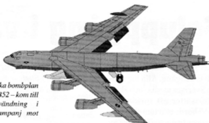
Amerikanska bombplan – som här B52 – kom till flitig användning i NATOs kampanj mot Serbien.

I fråga om Irak skilde sig Madeleine Albrights privata pläderingar för återhållsamhet från administrationens tuffa offentliga varningar under den senaste krisen. För sex månader sedan, efter det att Saddam kom överens med FN:s generalsekreterare Kofi Annan om att återuppta inspektionerna, varnade Albright att "om han bryter denna uppgörelse, kommer det inte att råda några tvivel om att styrka är det enda som hjälper." Clinton argumen-