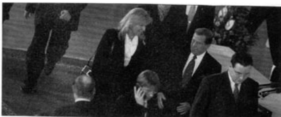
Václav Havel befinner sig som centraleuropeisk president ständigt i händelsernas centrum.

Hädanefter skulle allt gå med rasande fart. Den 10 december 1989 avgick Husak