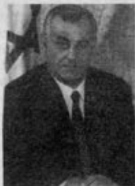
Ett intressant namn i det israeliska valet är det nya Centerpartiets ledare, Yitzhak Mordechai.

Mordechai tillhör Likuds "mjuka" falang och avgick ur regeringen därför att han ville driva på fredsprocessen med palestinierna ytterligare. Med sig i det nya partiet har han bland andra förre överbefälhavaren Amnon Lipkin-Shahak, förre finansministern Dan Meridor samt Tel Avivs före detta borgmästare Roni Milo. Det blir intressant att se hur denna konstellation lyckas appellera till den mycket heterogena grupp människor som utgör Israels väljarkår.