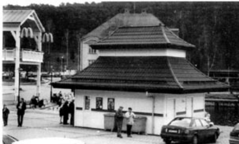
Mias gatukök i Södertälje (t v skymtar McDonald's jättebygge) med sitt "pagodtak" som retat vissa politiker och tjänstemän till vanvett.