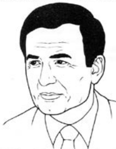
Pat Buchanan är paleoalliansens "hetaste" politiker.

Ytterligare en fråga som vällat kontrovers är abort. Så gott som alla i paleoalliansen skulle nog fördöma abort som omoraliskt, men det råder oenighet huruvida aborter bör förbjudas. Så gott som alla paleokonservativa (Buchanan hade abortmotstånd som en av sina viktigaste frågor i valkampanjen) och en hel del paleolibertarianer, bland andra Ron Paul och organisationen Libertarians for Life (som Paul stödjer) förespråkar abortförbud eftersom de menar att livet börjar