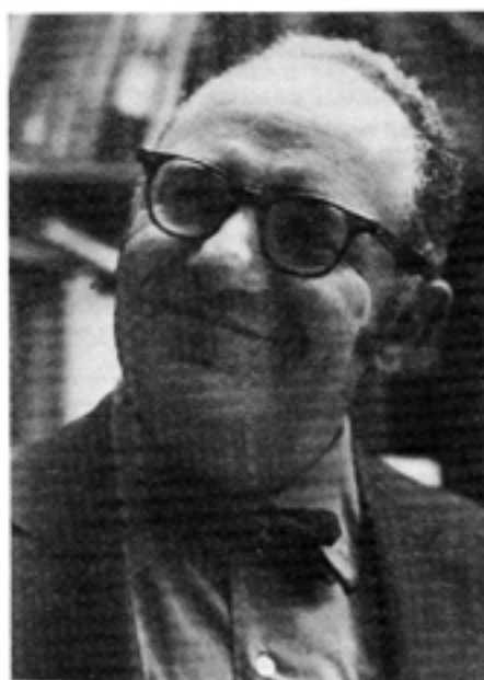
Ett av de främsta paleoliberaliska namnen i USA är framlidne Murray N. Rothbard.

Efter Andra världskriget splittrades dock Old Right -alliansen. Nästan alla konservativa och de flesta libertarianer greps av "kommunistkräck" och blev ännu starkare förespråkare än demokraterna för en interventionistisk utrikespolitik. Splittringen nådde sin höjdpunkt under Vietnamkriget då de flesta på högerkanten stödde president Lyndon Johnsons intervention för att stoppa ett kommunistiskt maktövertagande i Sydvietnam. En liten grupp libertarianer, ledda av ekonomen