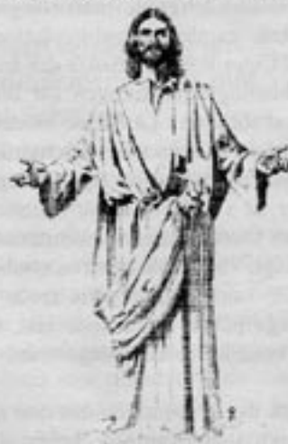
Förföljs av kommunisterna i det röda Kina.

Särskilt hårt, uppger Ljus i Öster , har