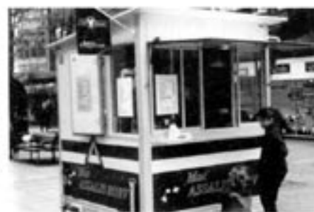
Ska MacAssalis korv få ha kvar sin vagn på Gånggatan?