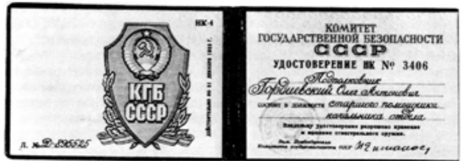
Oleg Gordievskys identitetskort som överste i KGB med skölden hämtad från det ursprungliga emblemet för den av Lenin uppbyggda Tjekan.

Intrycket av oklarhet berodde på en missuppfattning, förklarade Gordievsky. Dennes okunnighet gällde frågan om Schori varit anställd på samma sätt som Arne Treholt, den norske landsförrädaren, hade