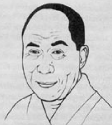
Dalai Lama är Tibets andliga överhuvud och en viktig moralisk symbol för det förtryckta tibetanska folket.