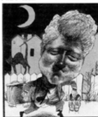
His cheating heart... Clinton i en vanlig pose enligt The American Spectators tecknare (januari 1994).

—Det är Lasaters deal, det är Lasaters deal.