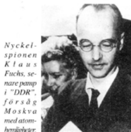
Nyckelspionen Klaus Fuchs, senare pamp i "DDR", försåg Moskva med atomhemligheter.