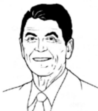
Ronald Reagan, USAs president 1981-88, spelade en viktig roll i den amerikanska antikommunismen.

beskrivning av det arbete som i det tysta pågick i USA för att skapa en motvikt till Sovjets politiska och psykologiska krigföring trots ointresset från regeringen.