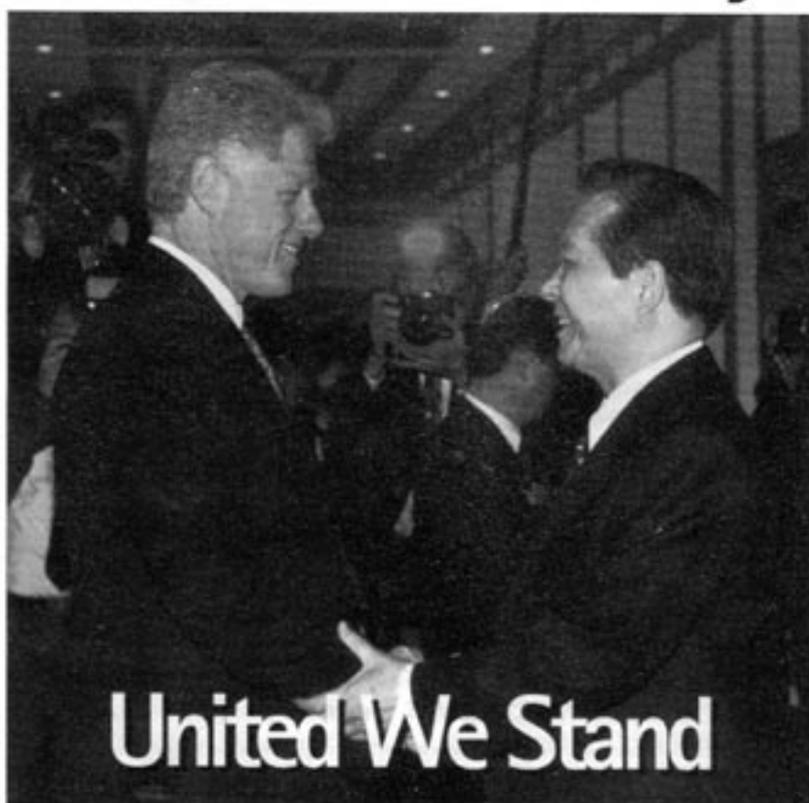
En välkommen avkoppling för Clinton efter alla bekymmer hemmavid: han mottas av Sydkoreas president Kim Dae-jung som en högt aktad statsgäst i Seoul den 21 november 1998. USA är alltjämt en viktig allierad för Sydkorea.

Den 25 oktober 1992 publicerade den inflytelserika dagstidningen The Wash-