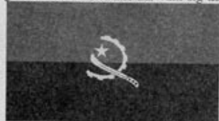
MPLA-regeringens angolanska flagga ger obehagliga vibrationer

Uppgifter från den portugisiska tidningen Diario de Noticias nyligen gör gällande att MPLA åter har vänt sig till