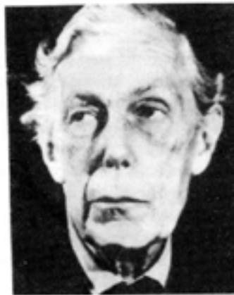
Den homosexuelle esteten Anthony Blunt, senare chef för drottningens konstgalleri, ledde den kommunistiska spionkretsen i Cambridge.