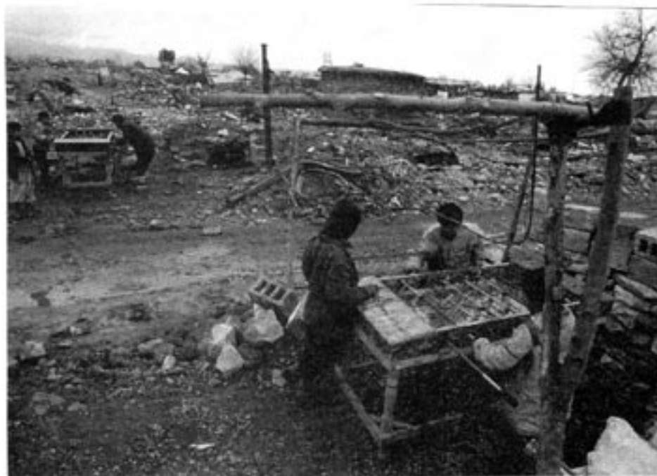
En bild från den turkiska delen av Kurdistan. Ungdomar spelar spel i resterna av det som en gång var en kurdisk bosättning.