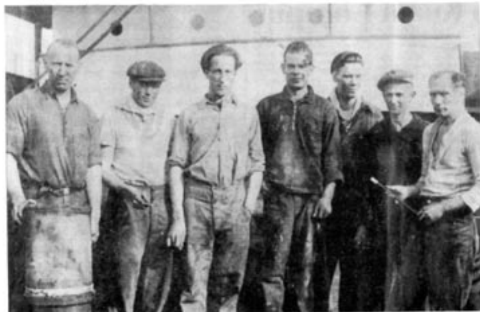
Besättningen på det svenska handelsfartyget Bengt Sture som torpederades av en rysk ubåt i oktober 1942. Besättningen försvann i Gulag – svenska UD gjorde inte mycket för att få dem fria.