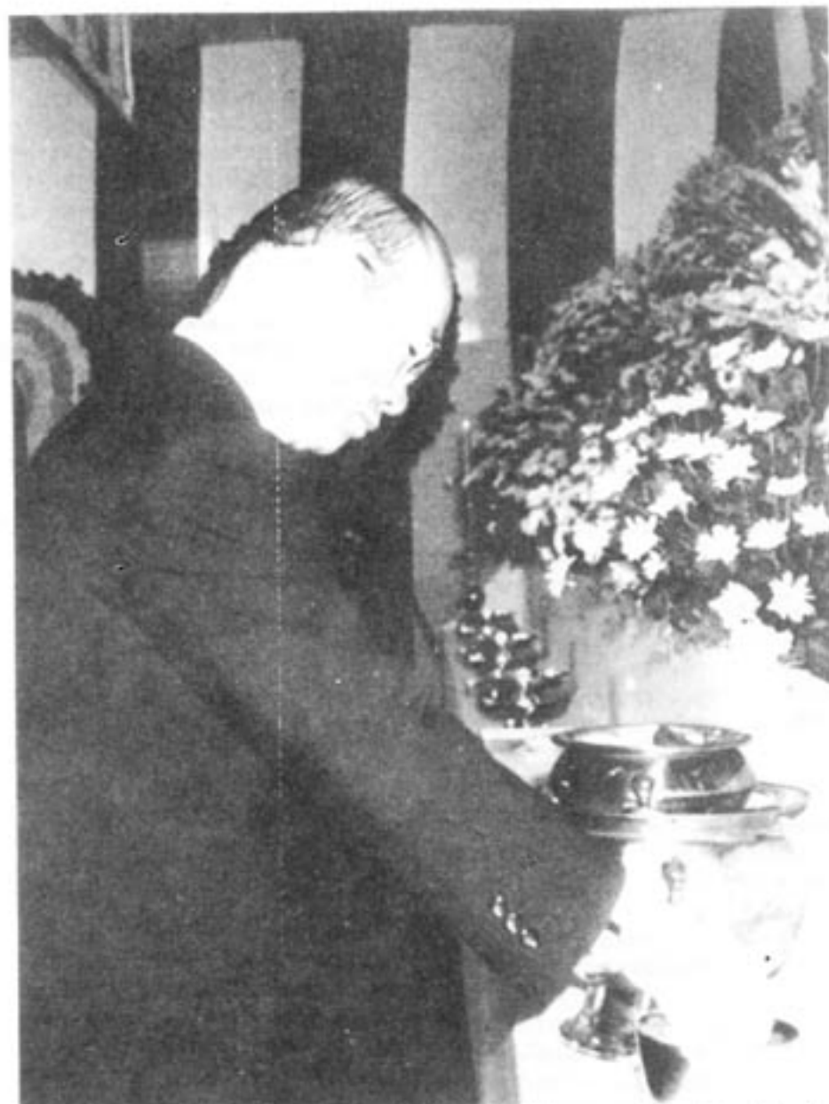
Två dagar efter nedskjutningen av KAL 007 besökte Sydkoreas president Chun Doo-hwan ett minnesaltare för katastrofoffren vid Kimpo-flygplatsen utanför Seoul. En dryg månad senare klarade sig Chun oskadd undan ett bombattentat i Rangoon.

Contra är veterligt den första svenska publikation som tar upp ICAO-rapporten till behandling.