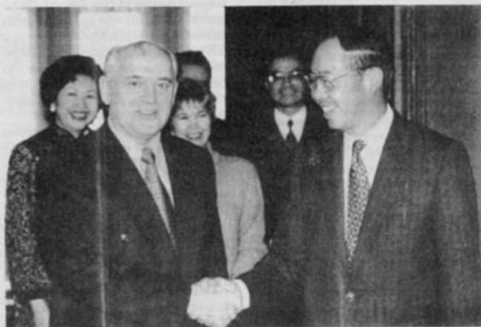
Förre sovjetiske presidenten Michail Gorbatjov har besökt världens mest utpräglad anti-kommunistiska land, Republiken Kina på Taiwan. Gorbatjov träffade bland andra utrikesminister Fredrick Chien.

Taiwan blev i mars lite av ett slagfält för ryska politiker, sedan det framkommit att Vladimir Zjirinovskijs s k liberal-demokratiska parti bjudit in Republiken Kinas president Lee Teng-hui till partiets