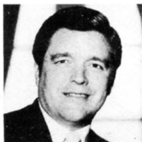
Kongressman Larry McDonald omkom i KAL-katastrofen 1983.

Marskalk Ogarkov hävdade att KAL-planet hade sammanträffat med ett amerikanskt spaningsplan av typ RC-135 och flugit jämsides med detta i tio minuter. Strax innan det amerikanska planet kommit in