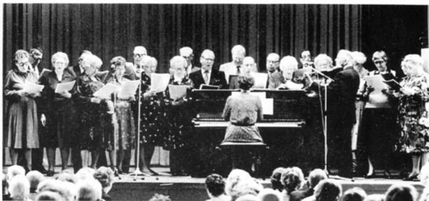
Det finns ett jättelikt hål i kommunernas och landstingens ekonomi. Under de glada expansionsdagarna har man glömt bort att man en gång ska betala pensioner till de kommunalt anställda.