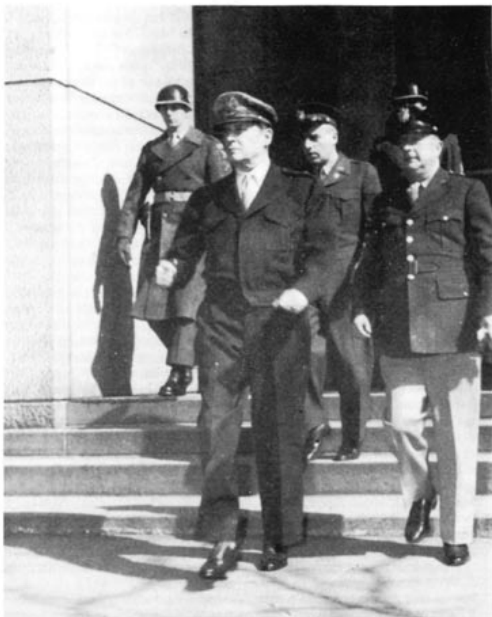
General Douglas MacArthur på väg ut från sitt kansli i Tokyo i april 1948, sedan han förklarat sig villig att kandidera i det amerikanska presidentvalet. Två år senare inleddes Koreakriget.

Den 26 juli 1941 tilldelades MacArthur befälet över USAs flottstridskrafter i Stilla havet, och det var i den egenskapen han tvingades fly från Filippinerna i en motor-torpedbåt till Australien 1942 för att organisera motattacken mot japanerna som i december 1941 förklarade krig mot USA genom att attackera den amerikanska flottbasen Pearl Harbor på Hawaii. När MacArthur slokörad tvingades lämna Filippinerna och generalskollegan Jonathan Wainwright i japanernas våld, insisterade han på att "I shall return" (Jag kommer att återvända). När han jämte några underlydande officerare i en väl orkestrerad PR-manöver vadade i land på den filippinska ön Leyte i oktober 1944 – iförd sina ryktbara solglasögon och generalsmössan med den djärva stukningen – förkunnade han med ödesmättad retorik över radion till befolkningen: "I have returned" (Jag har