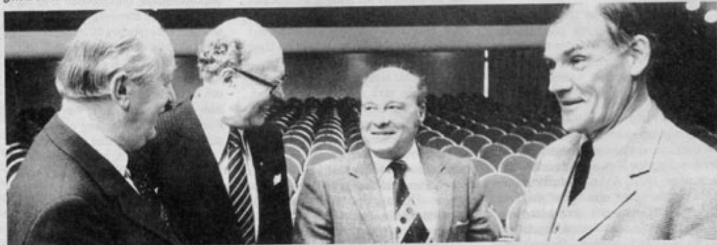
Byråkrater och politiker satsar gärna på kulturstöd – men de dyrbara platserna står tomma – medborgarna betalar hellre fulla priset för en rockkonsert.

Tyvärr tvingas vi konstatera att den "politiska korrektheten" nu även nått Arlas mjölkförpackningar, på vilka man kört en "informationsserie" om den s k hip-hop-kulturen. En av USAs hip-hopare – Ice-T – uppmanade för en tid sedan folk att gå ut och döda poliser. Andra favoritsyssel-sättningar bland hip-hopare är s k Graffiti, som presenteras med positiva förtecken på mjölkpaketet. Dvs olaglig klottring.