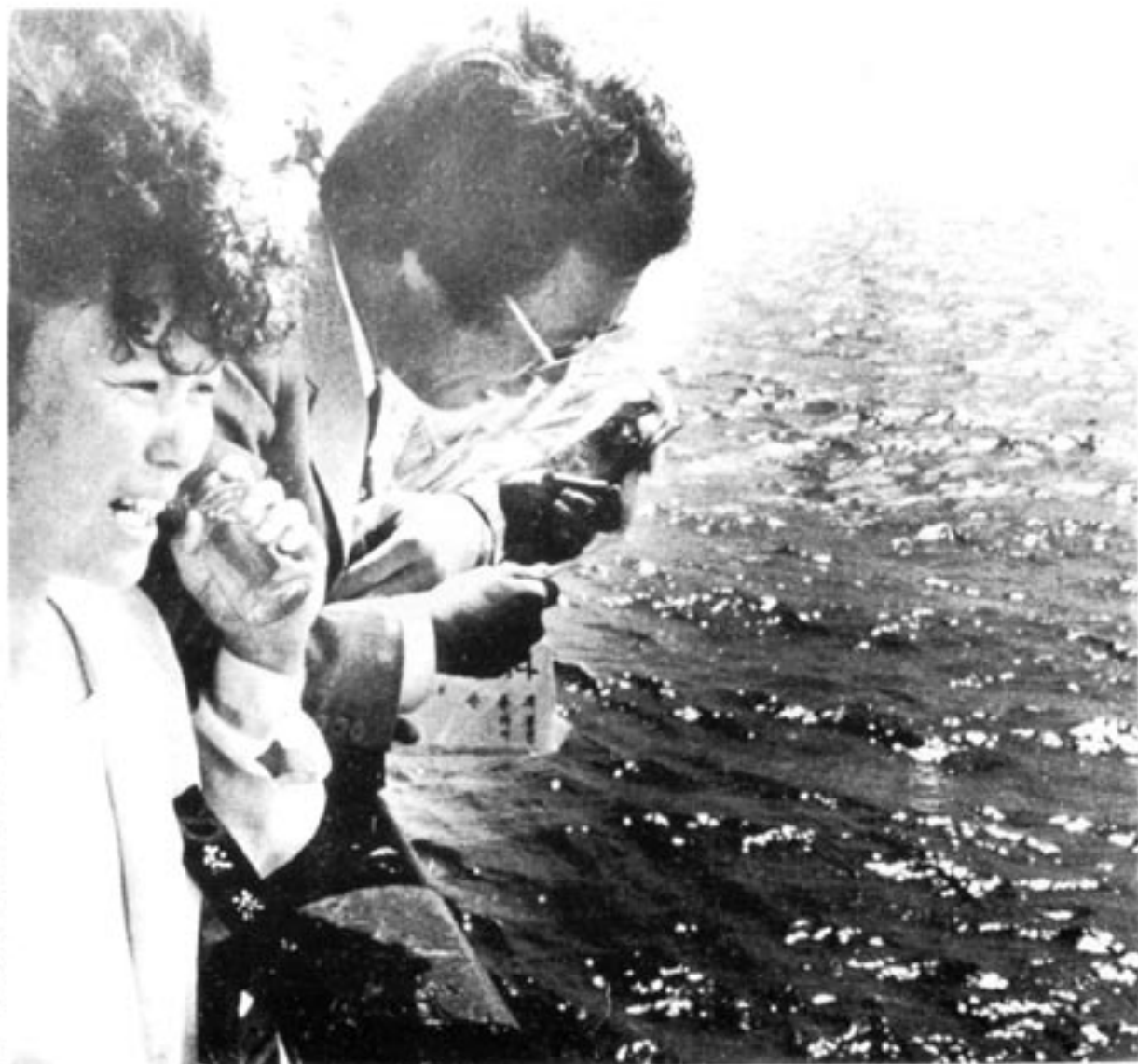
Sörjande koreaner kastar blommor i Ochotska havet, där Korean Airlines Boeing 747 sköts ned av sovjetiskt jaktflyg.

När KAL 007 kom in över sovjetiskt område höll en sovjetisk rutinpatrull på med förföljandet av ett amerikanskt RC-135-plan. Ryssarna har hävdats att de trodde att det rörde sig om ett KC-135 tankplan eller möjligen ett nytt RC-135. Flygdata visar dock, att KAL-planet och det RC-135-plan sovjetiskt jaktflyg förföljde aldrig någon gång flög jämsides, som marskalk Ogarkov hävdade. De var faktiskt aldrig närmare varandra än 150 km, vilket amerikanerna hävdats hela tiden. Det fanns alltså ingen