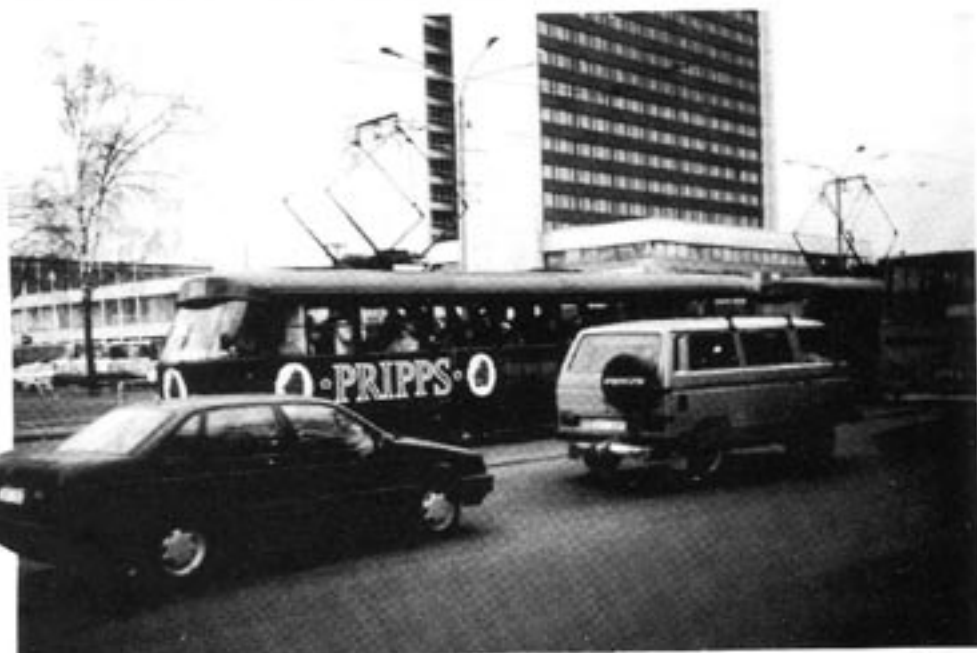
I det moderna Tallinn finns såväl en ganska livlig biltrafik som spårvagnar med, som synes, reklam för svenska ölfabrikat...

Tallinn (se vy på föregående sida) är en pärla bland Östersjöstäder som närmast kan beskrivas som "ett förstorat Visby med ringmur, kalkstensplåt och allt". Med skillnaden, att husen i Tallinn under den sovjetiska ockupationen varit statsägda och tilläts förfalla.