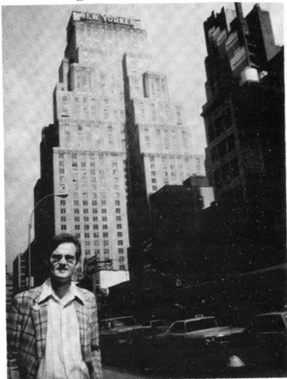
Artikelförfattaren i New York sommaren 1980. Mycket har hänt i amerikansk politik sedan dess, vilket framgår av vidstående artikel.

Breddar man emellertid synfältet till att även omfatta kulturen, massmedierna och de sociala frågorna blir bilden en radikalt annan. Här är det nämligen vänsterkrafterna som dominerar i allt väsentligt, och detta har i sin tur lett till att högerns landvinningar inom utrikespolitik och ekonomi hotas. Den utvecklingen inleddes redan med vänstervågen på 1960-talet, då studenter och andra "progressiva" (inklusive USAs