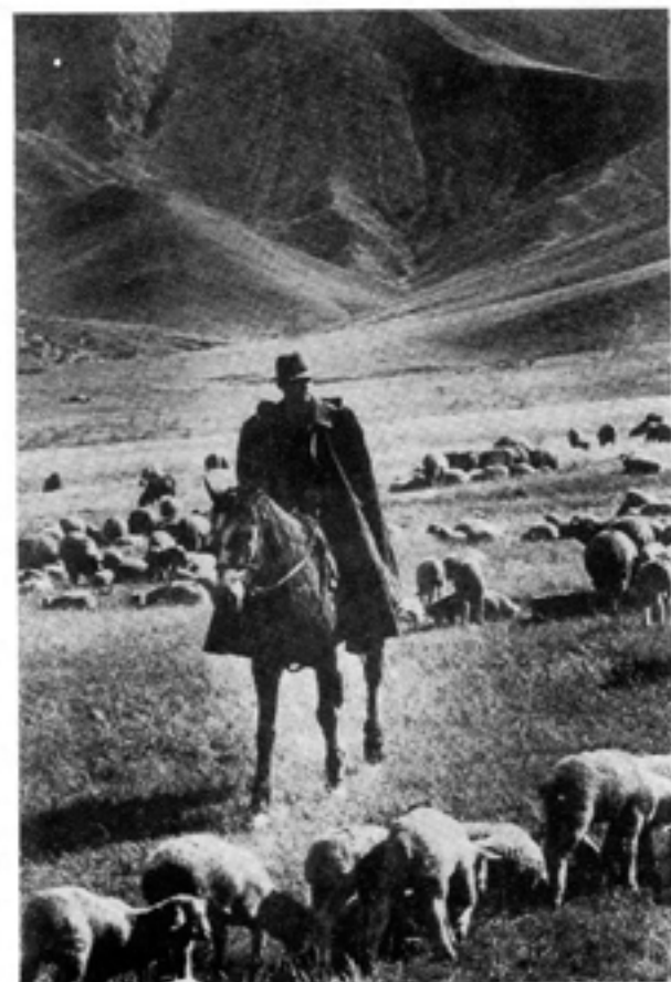
En beriden herde i Kirgisiens bergstrakter. Fåren ger persian.

Kirgisien skiljer sig dock fördelaktigt från grannrepublikerna Kazachstan, Uzbekistan och Tadzjikistan, som alla är kontrollerade av gammelkommunister. Därför kan landet också påräkna ett visst stöd från Väst och president Akajev har – i motsats till grannländernas ledare – getts tillfälle att träffa den förre amerikanske presidenten George Bush. □