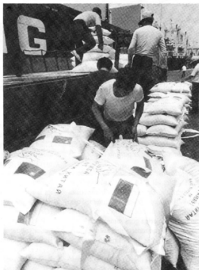
Taiwan är generöst med bistånd till andra länder. Här förbereds en sändning med 100 000 säckar ris till Ryssland.

Men allt har inte varit en dans på rosor