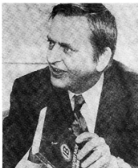
Olof Palme med boken om IB i handen.

Jan Guillou var på 1960-talet involverad i den kommunistiska tidningen Tid-signal , där han bl a pläderade för totalvägran av värnplikt eller infiltration från vänster av det svenska försvaret samt glorifier-