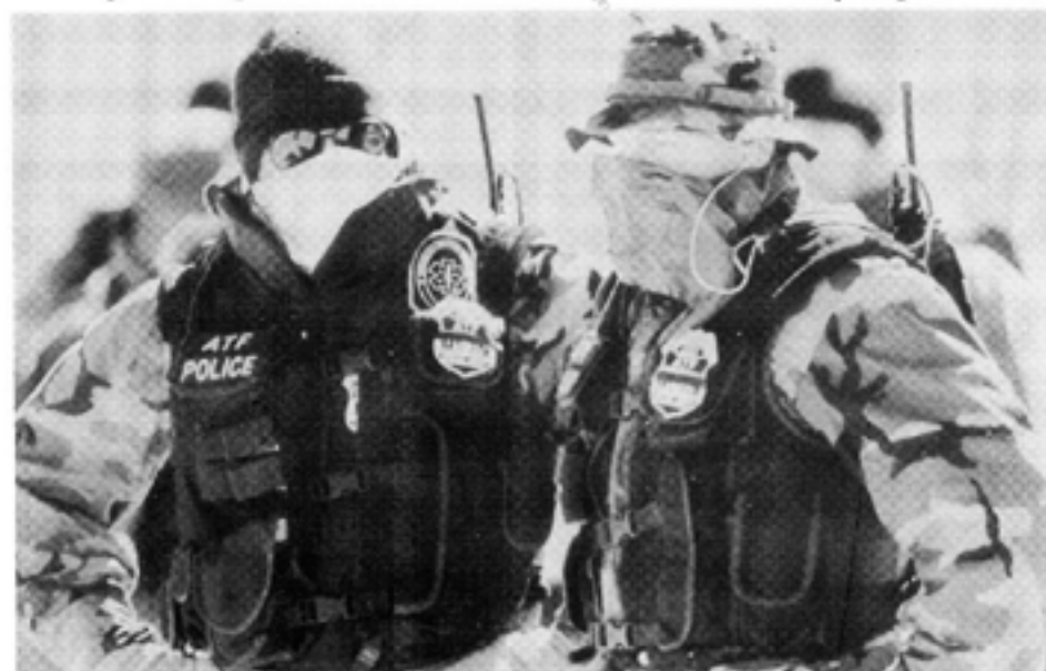
När ATF tillsammans med FBI efter 51 dagars belägring stormade ranchen blev resultatet en fruktansvärd massaker.