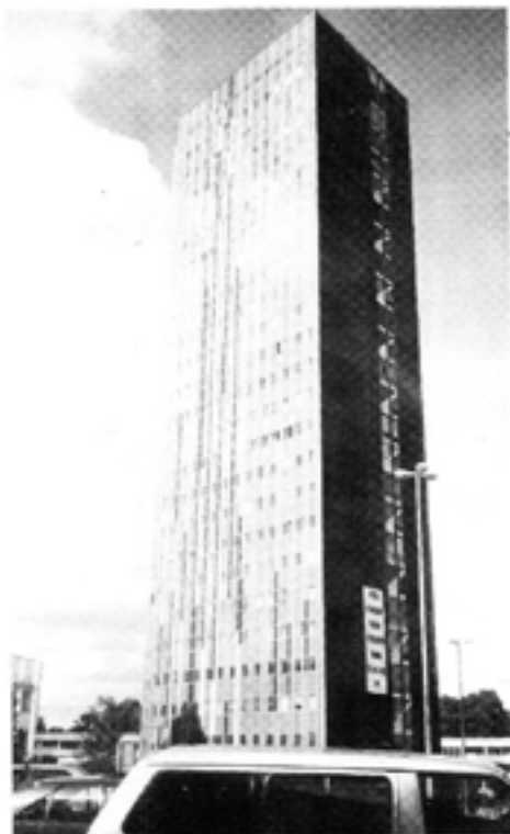
Taipei Trade, Tourism & Information Office ligger i Wenner-Gren Center i Stockholm.

Trots många och välförtjänta framgångar för Republiken Kina på Taiwan finns där problem. Ett par av de mest överhängande