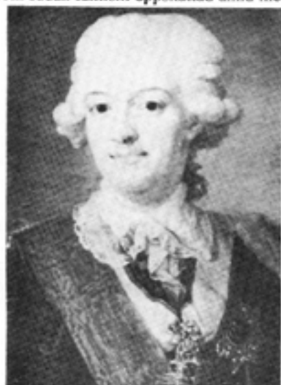
Gustav III – mördad.

Fältet var nu fritt för ett nytt kungahus som efter diverse turer hämtade från Frankrike. Jean-Baptiste Bernadotte blev under namnet Carl XIV Johan svensk kung och som sådan faktiskt uppskattad ännu mer i