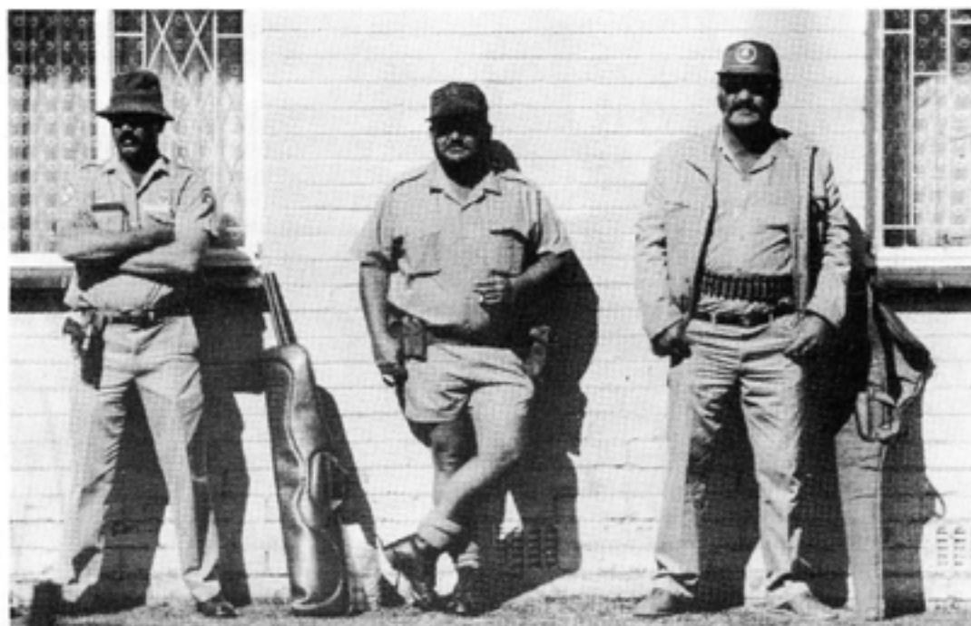
Den naziliknande vita gruppen AWB motsätter sig starkt alla regeringskompromisser gentemot den svarta folkmajoriteten. På bilden några beväpnade AWB-anhängare i Kroonstad.

Vietcong (FNL) var vad ANC är i Sydafrika, det vill säga en "befrielse rörelse" med icke-kommunistiska inslag. När Nordvietnams stridsvagnar hade störtat Saigon-regeringen 1975 upplöstes helt enkelt Vietcong.