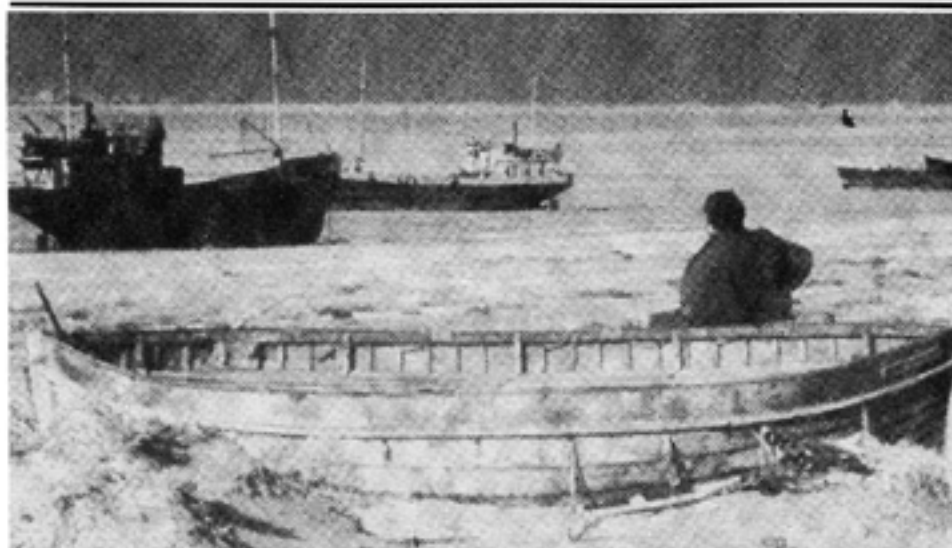
Stora delar Aralsjön är torrlagda, vilket betytt en katastrof för jordbruket.