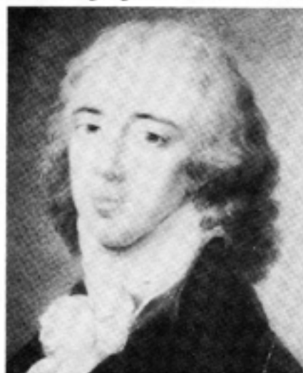
Gustav IV Adolf – mördad.

I modern tid har åtminstone en svensk mördats utomlands genom politisk terrorism, nämligen greve Folke Bernadotte då