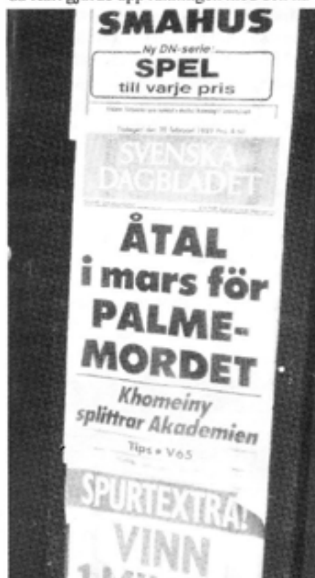
Mordet på Olof Palme var långtifrån den första politiska illgärningen av detta slag i Sverige.

Den yngste av halvbröderna (de hade olika mammor) var Karl IX som slutligen lyckades säkra Sveriges ställning som protestantisk makt med hjälp av lika brutala metoder som någonsin kungarna Kristian eller Gustav. Här må det vara nog att anföra exemplet Linköpings blodbad 1600, då Karl gjorde upp räkningen med den ka-