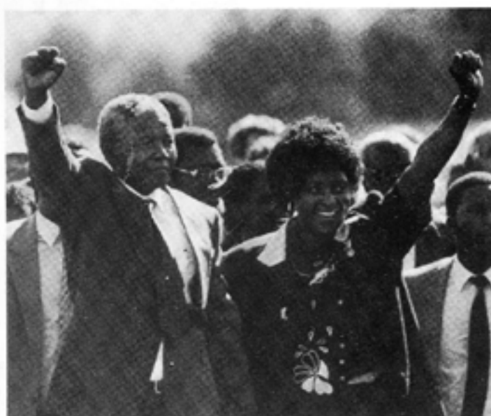
Nelson Mandela och hustrun Winnie jublar över Nelsons frigivning den 11 februari 1990.

Annars har det under senare tid mest varit Nelsons hustru Winnie Mandela som ägnats mindre smickrande utrymme i massmedia. Winnie – tidigare kallad "Nationens moder" – som den 13 april 1986 tog ställning för den svarta terrorismen mot olik-tänkande med orden: