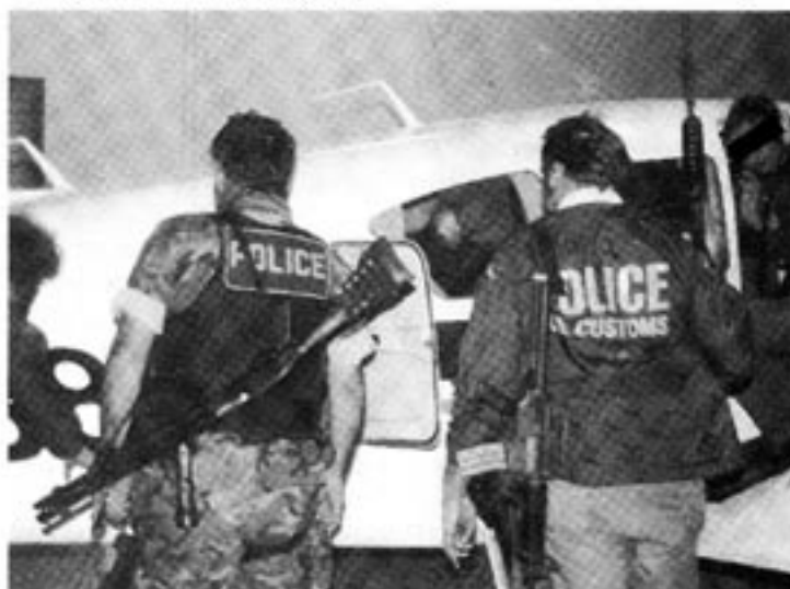
De amerikanska myndigheterna bedriver kamp mot narkotikan med rent militära metoder.

Om situationen idag skulle bli annorlunda kan vi bara spekulera om. Säkert är dock att framtiden kommer att föra med sig en het debatt med både pragmatiska och principiella argument.