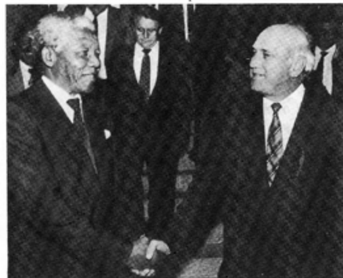
Statspresident F W de Klerk och Nelson Mandela skakar hand efter de historiska samtalen mellan nationalistregeringen och ANC i början av 1990.

ANCs samarbete med kommunisterna är i dag lika påtagligt som någonsin tidigare, även om ANC av taktiska skäl valt att tona ned detta och framstäl-