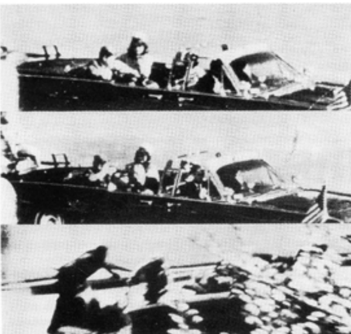
En amatörfilm från mordplatsen visar att skotten kom bakifrån, vilket motsäger tesen att det fanns fler än en gärningsman.

Kan filmen vara en konsekvens av att Stone själv lider av paranoja? När president Bush jämförde JFK med ryktena om att Elvis Presley fortfarande är i livet, replikerade Stone omgäende i tidskriften Daily Variety att president Bush själv ingick i konspirationen.