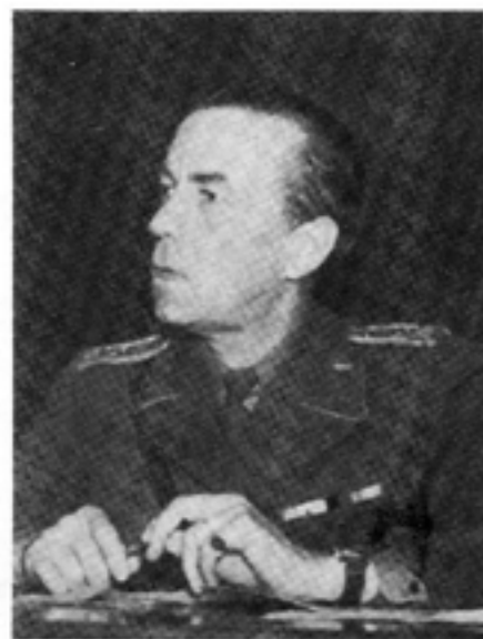
Folke Bernadotte – mördad.

han 1948 befann sig på medlaruppdrag för FNs räkning i Jerusalem. Bernadotte, som vid krigsslutet räddat tusentals skandinaviska judar undan nazisternas koncentrationsläger, sköts ihjäl av judiska militanter från den så kallade Stern-ligan.