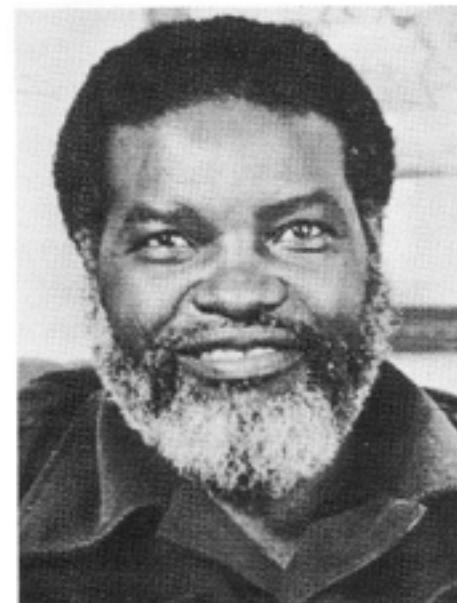
Swapo-presidenten Sam Nujoma köper privat jetplan för 162 miljoner kronor.