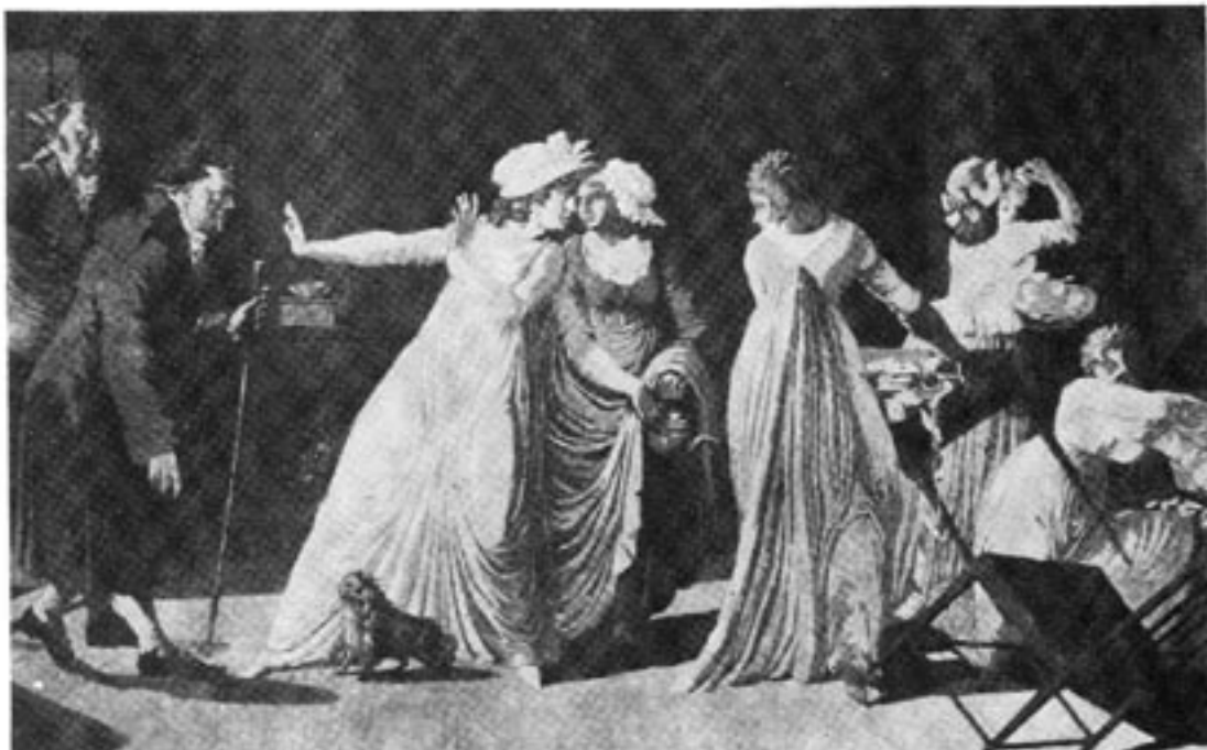
Med sin akvarell "Caffe-Beslaget" från 1799 ironiserar konstnären Pehr Nordqvist över 1794 års kaffeförbud. På tavlan uppenbarar sig två polisbetjänter under ett kafferep...

Men samtidigt minskade antalet dödsfall som orsakats av dålig sprit drastiskt. Droganvän-