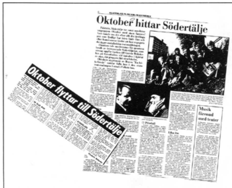
Hösten 1978 flyttade Musikgruppen Oktober till Södertälje från Malmö. Södertälje kommun ställde genast upp med lokal och 300.000 kronor.

Den 6 oktober 1980 satte Oktober upp den fiaskobetonade I en annan tid på Estran i Södertälje. Det var en politisk pjäs som diskuterade olika socialistiska synsätt och möjligheter att styra Sverige, till exem-