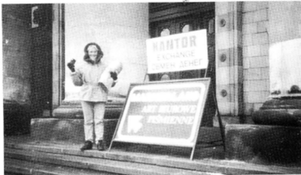
Entrén till Stalins kulturpalats visar vägen till växlingskontoret för de ryssar som vill växla till sig rubel (som det ju faktiskt är illegalt att föra både ut och in ur Ryssland).

Modellen är delvis den omvända mot den som tillämpas i Tjecko-Slovakien. Där har hela befolkningen tilldelats privatiseringskuponger, andelar i de företag som i framtiden skall skiftas ut till tjecker och slovakier. Smarta affärsmän med utländskt kapital har redan köpt upp stora andelar av