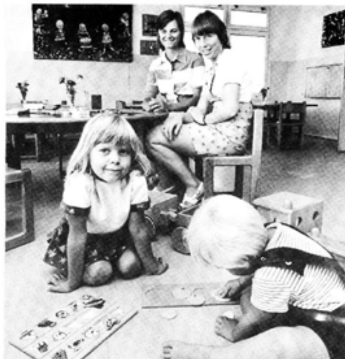
Det är viktigt att entreprenadkontraktet tydligt specificerar hur arbetet ska utföras. På så sätt undviks onödiga konflikter.

Ett första steg är att gå igenom den aktuella tjänsten tillsammans med ett par privata företag som har kompetens och ett potentiellt intresse för att ta över tjänsten. Dessa förhandskontakter ska inte betraktas som regelrätta förhandlingar, utan som ett