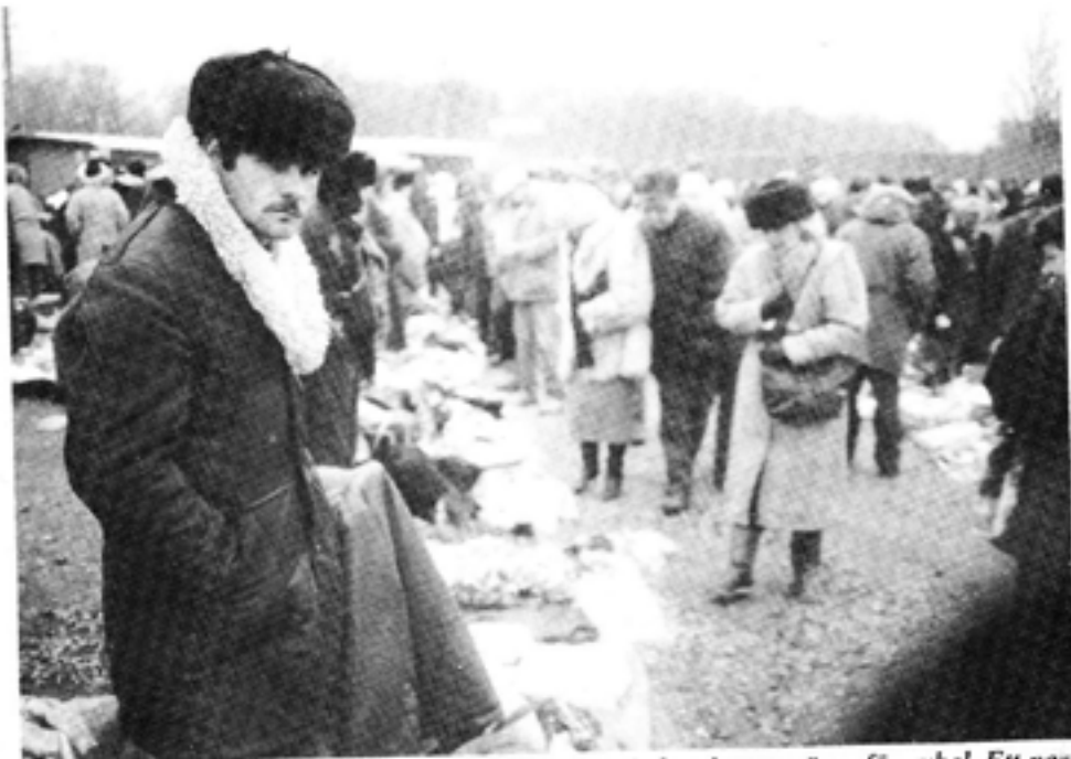
Ryssar i tusentals reser till Polen för att sälja allt de kan komma över för rubel. Ett par dagars försäljning kan ge motsvarande flera månaders inkomst.