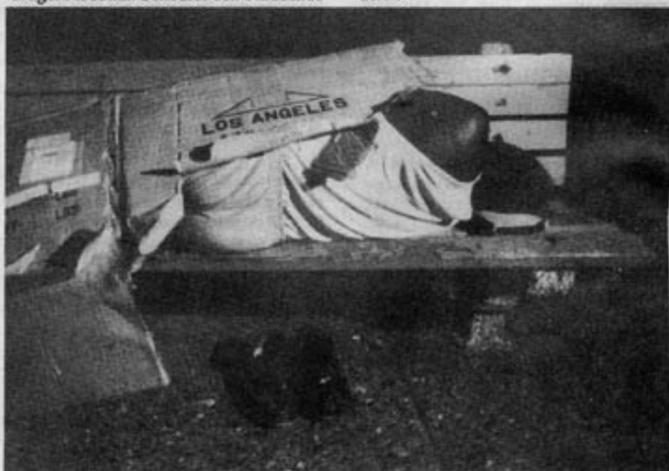
Det är numer inte möjligt enligt amerikansk lag att hålla någon inspärrad på mentalsjukhus eller annan institution. Myntets baksida är dock att få mentalpatienter hamnar "på gatan", oförmögna att ta tillvara sina egna intressen.