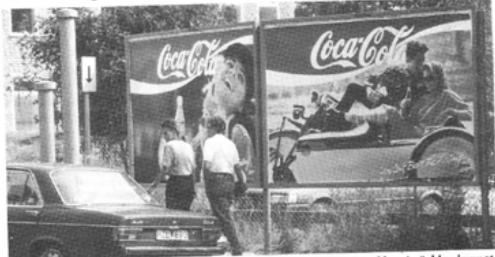
Hade konsumenterna funnit Coca-Cola illasmakande hade ingen reklam i världen kunnat rädda produkten.

På 1970-talet försökte Volkswagen lansera en ny bilmodell – K70 – med hjälp av den tyska bilkoncernens alla reklamresur-