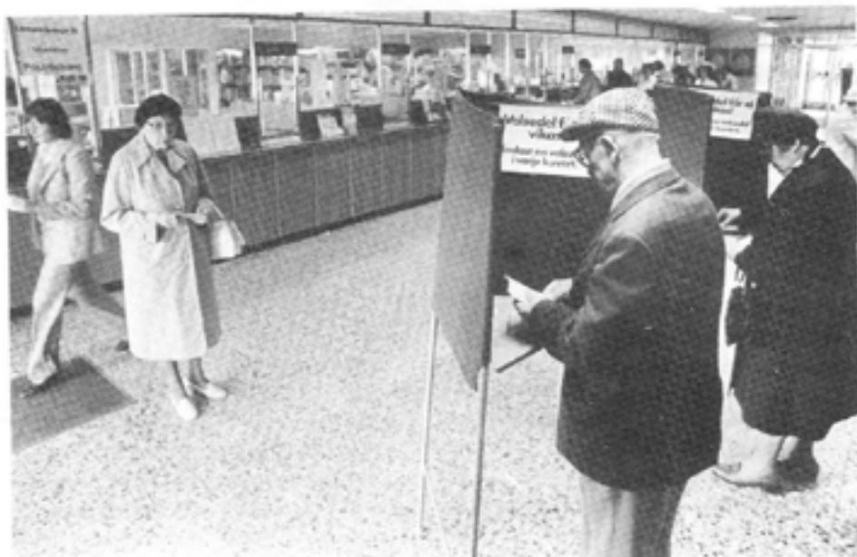
Sveriges Pensionärers Intresseparti och Pensionärspartiet hör till de småpartier som gick framåt i valet.

Därav det flitiga inskrivandet av Kalle Anka-partiet och andra på valsedlarna. Det är medborgare som vill visa att de faktiskt bryr sig, men att de är missnöjda med de