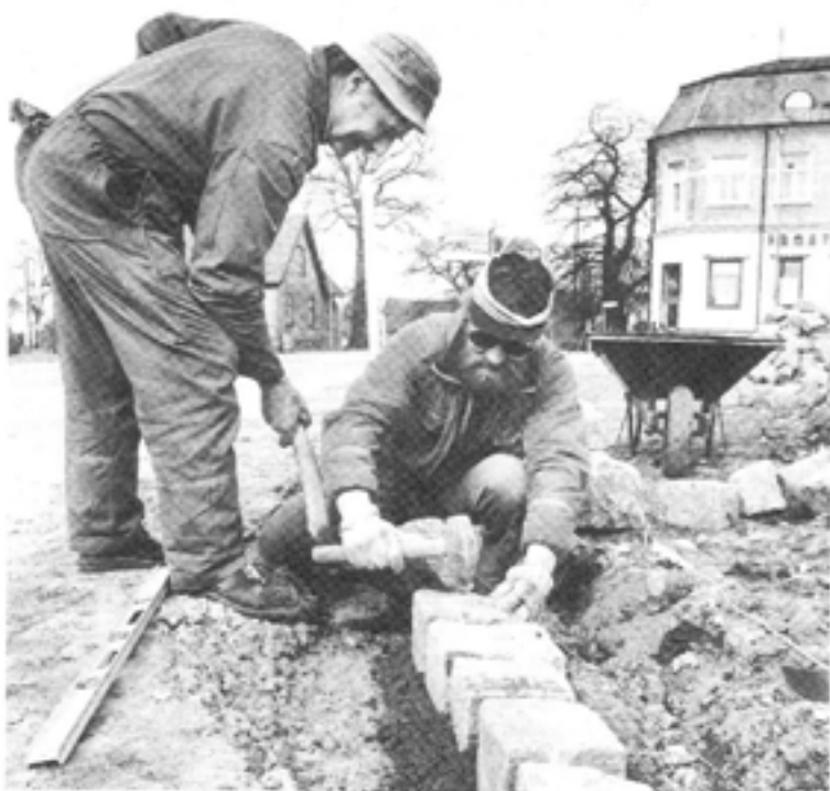
Genom att låta privata entreprenörer ta över kommunala tjänster kan kostnaderna sänkas och kvalitén på tjänsterna höjas.

Gatuhållningen blev betydligt bättre och det till en lägre kostnad. Inbesparing blev under den första anbudsomgången 7,5 miljoner pund, trots att kostnaderna för uppsägningar inberäknats och trots de 440.000 pund som kommunen tidigare sparat in.