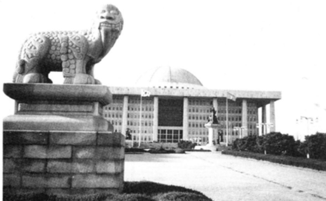
Nationalförsamlingen i Seoul byggdes under Park Chung-hees tid 1978 och har 299 platser.