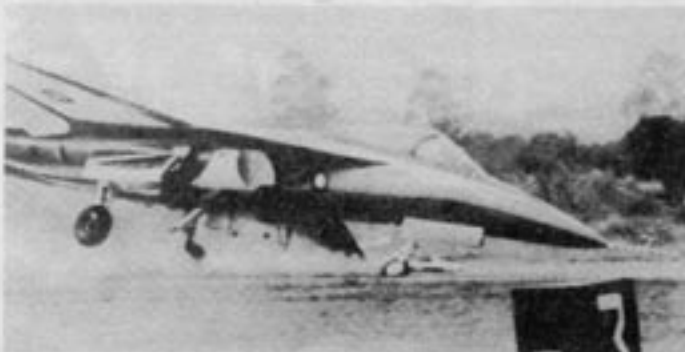
Taiwans nya stridsflygplan kraschade under provflygning – inget ovanligt för nya flygplansmodeller under utveckling.

Republiken Kina (Taiwan) är vid sidan av