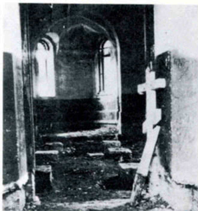
En av Sovjets 200 000 förstörda kyrkor.

Mildare straffformer är tvångsbosättning och tvångsarbete. Tvångsbosättning innebär att den straffade arbetar i en fabrik tillsammans med vanliga arbetare och bor i en förläggning. Tvångsarbete innebär hårt kroppsarbete på något större byggprojekt. På kvällarna och på helgerna är fången ledig.