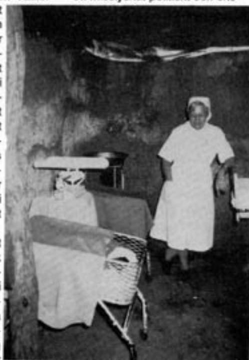
UNITAs huvudsjukhus i Jamba