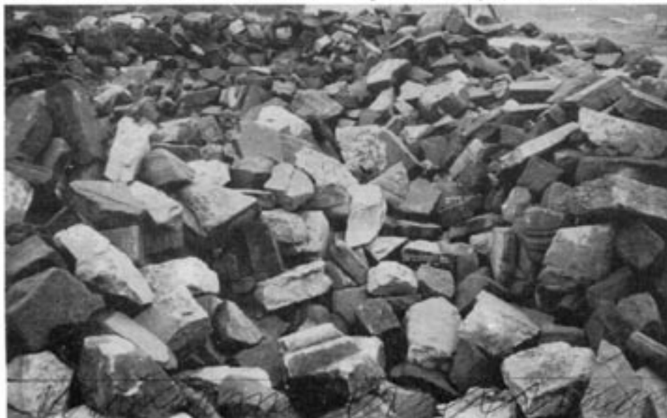
Det är obegripligt att många judar som flytt till Sverige fortsätter att vara kommunister.