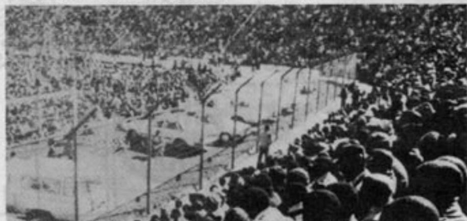
50 000 svarta sydafrikaner samlades nyligen till ett protestmöte mot utländska sanktioner mot Sydafrika. Mötet hölls i staden Durban.