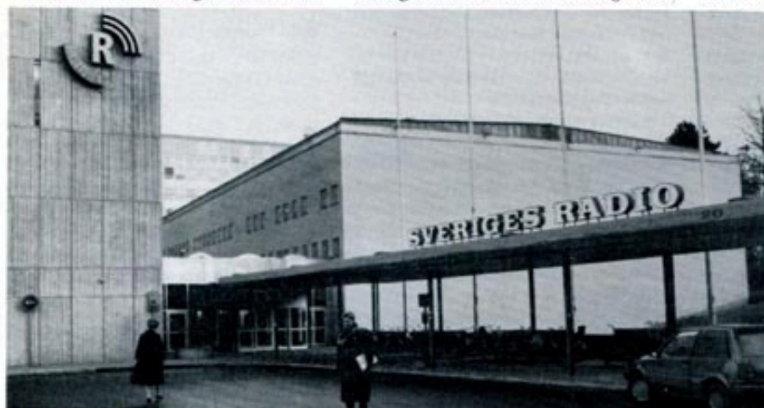
Radio och TV har blivit ett viktigt medium för opinionsbildning – alltför viktigt för att vara i händerna på ett monopolföretag.