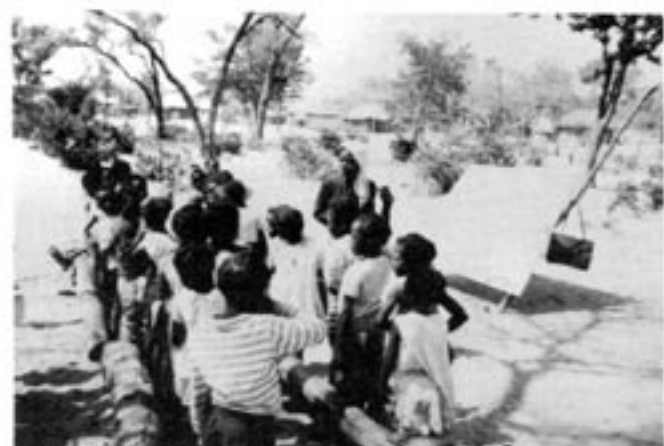
En "bushskola" i Jamba

UNITAs president Jonas Savimbi har, ända sedan han grundade rörelsen, som en antiportugisisk motståndsrörelse