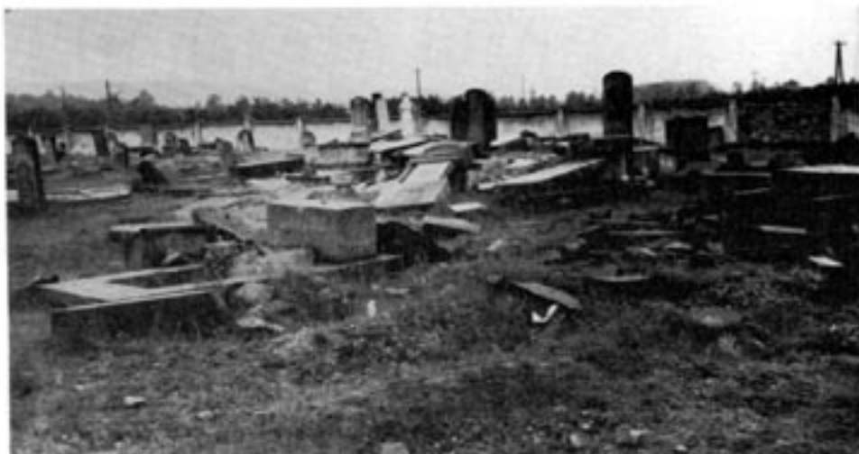
I hela Polen dödades tusentals judar under förföljelserna

Naturligtvis får det statliga organet hålla sig till de officiella siffrorna, men endast antalet döda i staden Kielce är korrekt. Offren över hela Polen kunde räknas i tusenden, men vem brydde sig om sådant efter Andra världskrigets slut? Att ordern om dessa massakrer kom från överheten råder det numera full visshet om. En av de betydande kommunistledarna, Marian Spychalski, förbjöd användning av vapenmakt vid skingringen av pöbeln. Den fick härja fritt under förevändning att man skulle skona människoliv. Inte ens några skrämskott fick milisens officerare, som senare skulle komma fram i slaktstället,