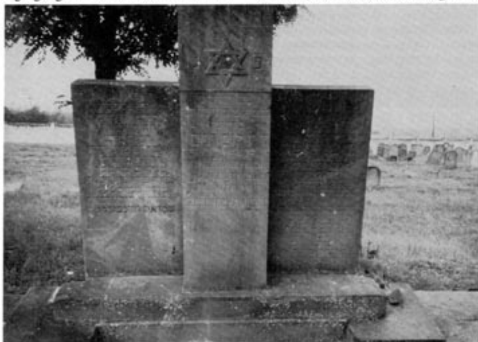
Monumentet över de 42 judar som blev mördade i Kielce 1946.

Några citat "Fadern till en åttaårig katolsk pojke anmälde hos milisen att judarna som bodde kollektivt vid Plantygan, kidnappade hans son och andra katolska barn för ritualmord. Barnen skulle hållas inlåsta i husets källare – trots att huset var källarlöst – och milismännen åtog sig att undersöka fallet... Pöbeln började samla sig vid huset och bryta upp porten – Milismännen släpptes in, de avväpnade de få som hade rätt att bära handeldvapen – och började kasta ner judar från andra våningen. Pöbeln nedanför slog de redan blodiga människorna