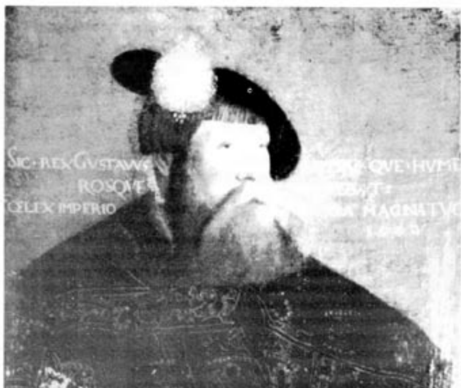
Gustav Vasa gjorde stor insats som svensk riksbyggare. Men han blev med tiden alltmer maktfullkomlig, och hade sånär störtats av Nils Dacke och hans smålänningar.

Hans maktmissbruk ledde till protester runt om i landet. Det mest välorganiserade och folkligt understödda upprorsförsöket såg dagens ljus 1542–43. Dess centrum låg i Småland och södra Östergötland. Det kallades Dackefejden , efter sin ledare Nils Dacke, en bonde med hemvist i smålandsocknen Visslefjärda. Upproret utlöstes