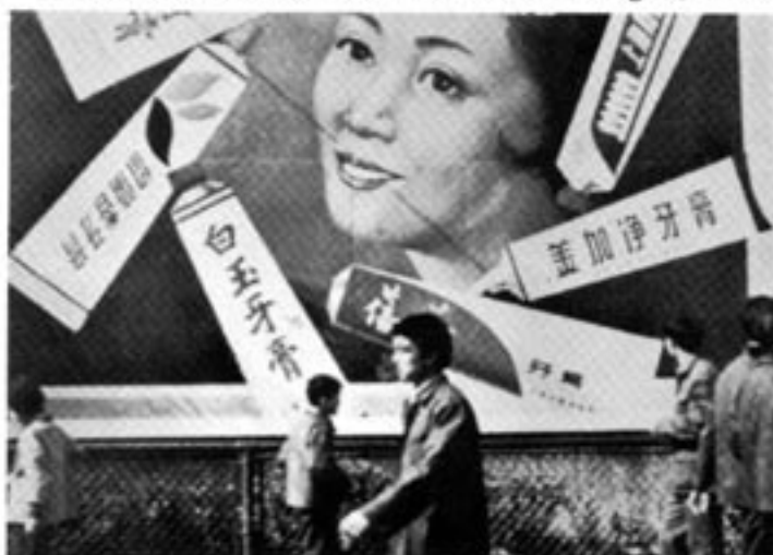
Reklam ansågs förr förkastligt, men det är numer fritt fram för reklam i Kina

I boken, på närmare 250 sidor, berättar ministern om retorik och verklighet, om den