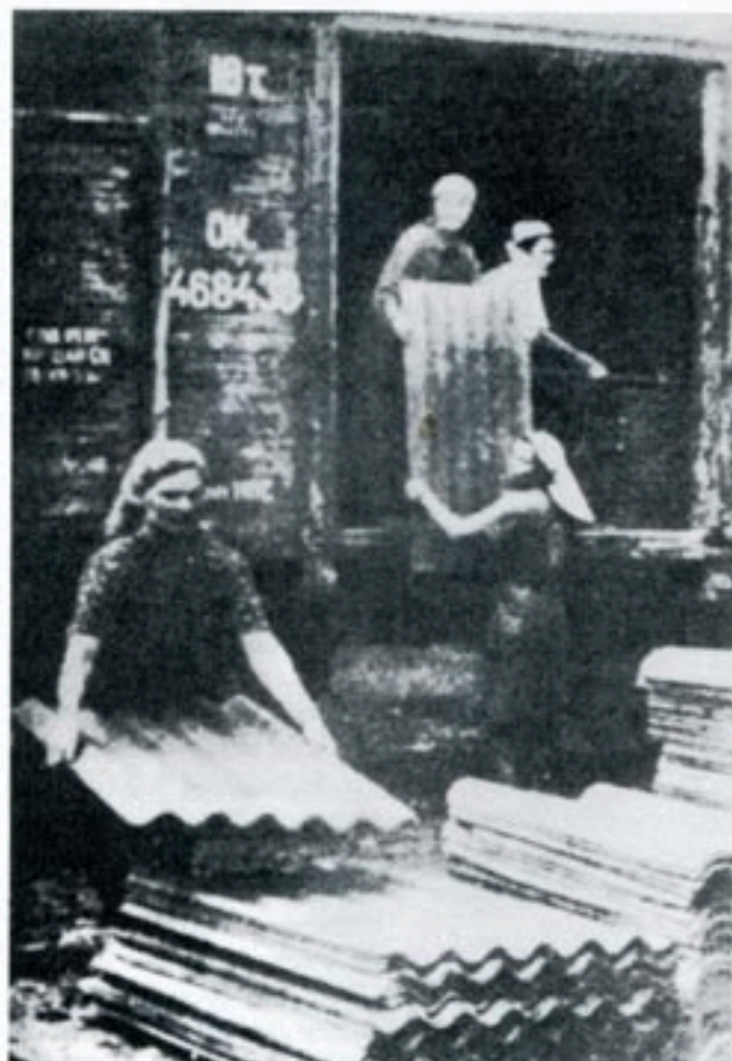
Kvinnliga fångar lastar asbestplattor från en järnvägsvagn.

De får motionera utomhus högst en timme per dygn i små och smutsiga rastgårdar med höga murar. Maten består av en