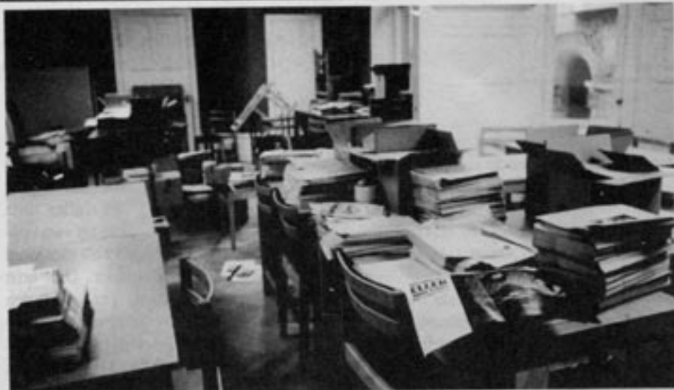
SSU för kampen för fler ungdomsbostäder från en underutnyttjad sexrunslägenhet som skulle kunna bli utmärkt bostad för många ungdomar.

finns kartongvis med urdruckna vinflaskor staplade i ett hörn av lokalen.