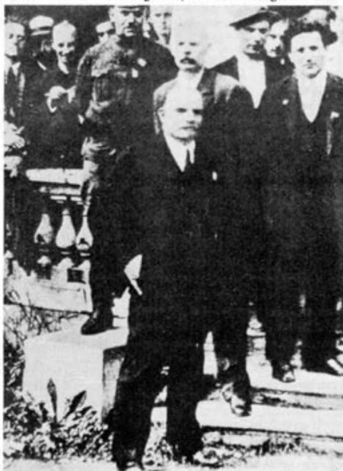
Bolsjeviken Lenin fick 50 miljoner guldmark från det kejsrerliga Tyskland.

för hela världen på 325 miljoner) och den 3 april 1917 åkte Lenin med förtrogn från Schweiz på initiativ av tyska utrikesdepartementet och med högsta krigsledningens medgivande (Ludendorf) till Ryssland. Tyskarna visste att han skulle sluta fred med dem om han fick makten och man beräknar att 26 miljoner gick åt till detta ändamål.