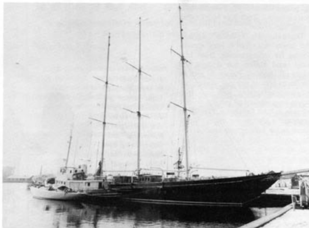
Den marxistiska skolorganisationen Tvind driver bland annat sin utbildning genom att ta med ungdomarna på utlandsresor i nästintill sjöodugliga Tvind-fartyg. Förhållandena är ofta mycket tvivelaktiga ombord och disciplinen marxistiskt hård.

das för förstamaj-parader och liknande.'