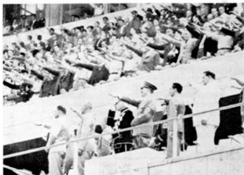
Socialismen i trettioalets Tyskland var en slags religion, med uttrycksmedel som de på bilden. Också i politiken fanns många likheter med dagens socialism

1934 upprättades inom DAF de s k verksamhetsgrupper (die Werkscharen). Det fanns tre sådana grupper: en för folkhälsan, en annan för yrkesuppfostran och en tredje för "Kraft durch Freude"-institutionen. Den sistnämnda, gemenskapen KDF, ville främst förverkliga en sund gestaltning av fritiden för arbetarna: sport, resor, vandringar, underhållning på helgdagskvällarna, folkbildning m m. Under 1936 deltog 6,2 miljoner personer i mer än 36 000 folkbildningsställen. Därutöver hölls