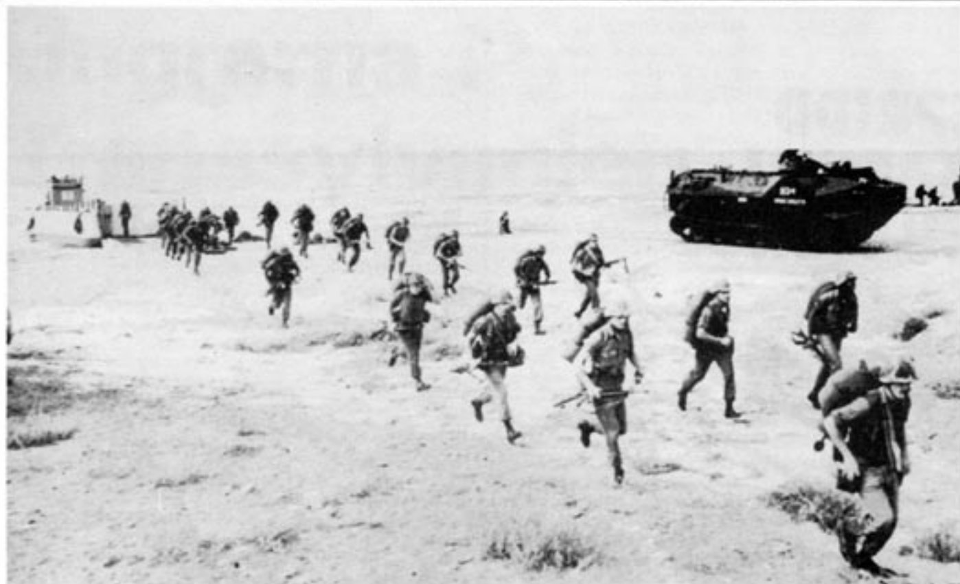
Amerikanska marinsoldater övar landstigningsoperationer. Spänningen i Stilla havet har ökat under senare år. Sovjet har flyttat fram sina positioner. Man satsar gärna några tiotal miljoner rubel på att få inflytande i någon liten östat, för att skapa problem för Väst.