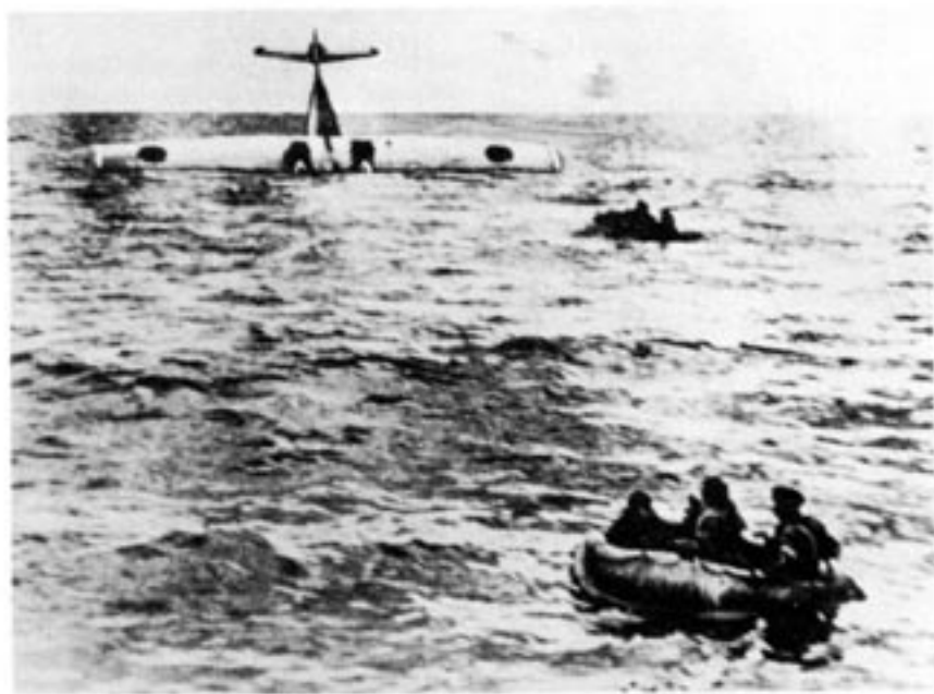
När det obebväpnade Catalina-planet sköts ned över Östersjön av sovjetiskt jaktflyg slog det i vattnet alldeles intill ett västtyskt handelsfartyg. Besättningen kunde därför rädda sig och denna autentiska bild togs från det tyska fartygets däck.

Den totala bristen på vrakdelar är ett annat argument mot haveriteorin. I förlängningen av detta finns vittnesuppgifter från