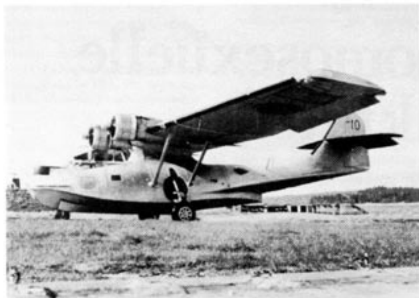
Sverige hade tre Catalina-flygplan. Ett amfibieflygplan för räddnings- och spaningsuppdrag. De två kvarvarande flög till 1966.