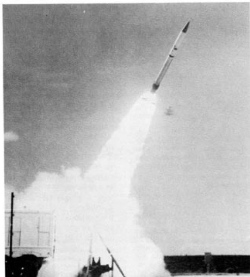
Ett av vapnen i rymdförsvarsprogrammet SDI är roboten FLAGE. Här under en framgångsrik provskjutning i juni 1986.

Låt oss nu istället se på de delar av SDI där man kommit en bra bit på väg.