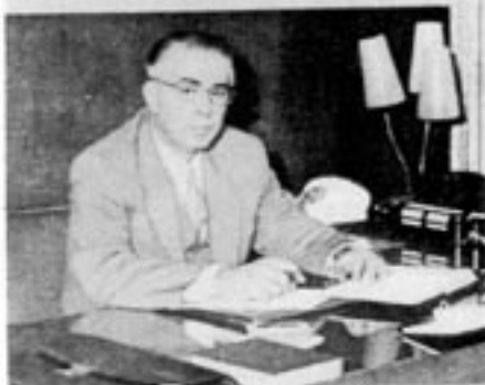
Albaniens diktator Enver Hoxha var en inbiten beundrare av Josef Stalin. Det märktes också i hans utrensningar. Premiärministern Mehmet Sheu sköts i ex bara några år innan Hoxhas död.

med "kulturrevolutionen", för att de skulle angripa Sheu. Det koncentriskt angreppet utlöstes under ett av politbyråns sammanträden. Genom att utgå från sonens förlovning, satte man premiärministerns renlärighet i fråga.