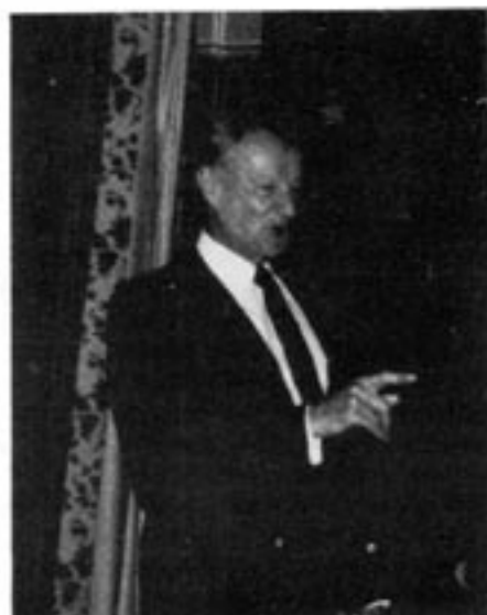
President Carters säkerhetspolitiska rådgivare Zbigniew Brzezinski var inte särskilt oroad över Sovjets uppladdning i Stillahavsområdet. Den sovjetiska ekonomin är för svag för att det skall utgöra ett reellt hot menade han.

Brzezinski medgav att det här var rena spekulationer från hans sida, men betonade att det ändå var en mycket trolig utveckling. Han menade också att de fyra ekonomier som ligger före Sovjet in på 2010-talet kommer att ha ett inbördes mycket bättre förhållande än idag. Sovjet kommer inte bara att hamna på femte plats, man riskerar att ha fyra ekonomier framför sig som alla är antagonistiskt inställda mot Sovjet. Sovjet är inget framtidsalternativ på det ekonomiska området.