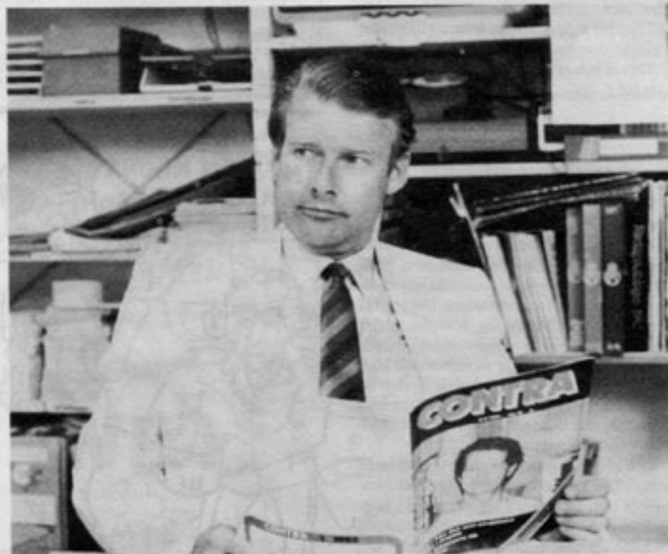
Norska Fremskrittspartiet har nu 14,5 procent av sympatierna i opinionsundersökningarna. Mer än mittenpartierna tillsammans. Här Fremskrittspartiets ledare Carl I. Hagen på besök hos Contra på Kungsholmen i Stockholm.

När den norska socialdemokratiska regeringen tappade kontrollen över den ekonomiska utvecklingen i Norge införde man löne- och prisstopp. Fremskrittspartiet