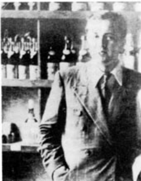
En ungdomsbild på den senare albanske diktatorn Enver Hoxha. Trots att homosexualitet var belagt med ett straff på sju års fängelse hävdar avhoppare att Hoxha ägnade sig åt utpressning med homosexuellt innehåll.