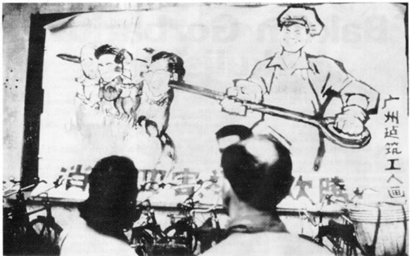
När Mao Tse-tung och senare "de fyras gäng" härjade var rättslösheten total i Kina. Mycket bättre var inte uppgörelsen med "de fyras gäng" (se bilden), men idag händer det ibland att man försöker rensa upp.

by i Shaanxi-provinsen, som dessutom var ledamot av Nationella folkkongressen, grep olagligt 72 bybor 1984 som misstänkta för att ha stulit en del av hans ringklocka till cykeln! 17 av de gripna utsattes för tortyr på order av partisekreteraren och 28 tvangs betala böter för att täcka kostnaderna för de vakter som behövdes för att övervaka dem. En del satt inburade i åtta dagar för "brottet".