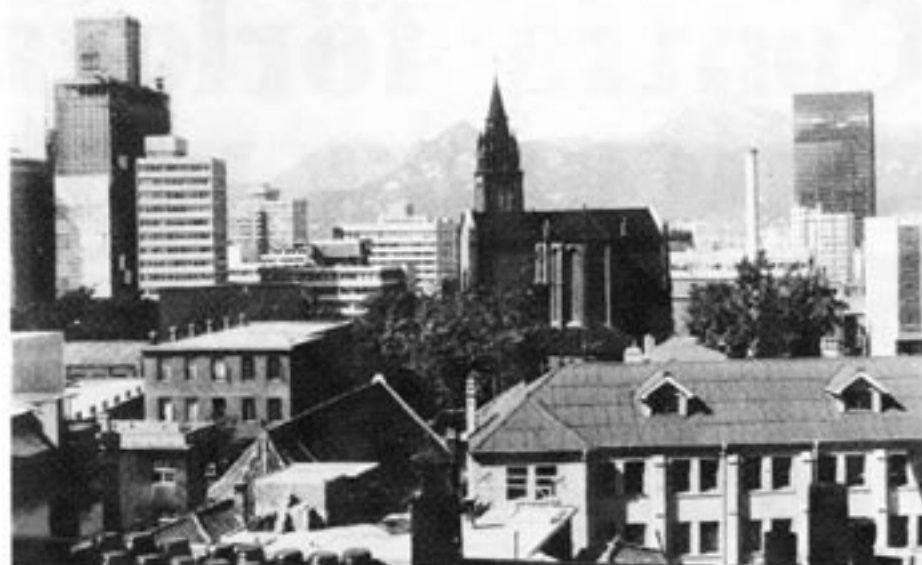
Sydkorea är ett av de länder som genomgår den snabbaste utvecklingen — på kapitalistisk grund. För femton år sedan var Sydkorea ett u-land. Idag tillverkas fler bilar i Sydkorea än i Sverige och Sydkorea har erövrat Sveriges tidigare andraplats som skeppsbyggarnation i världen. Med gott hopp om att knipa förstaplatsen från Japan 1988. Här en bild från Seoul.

Det kan genom de positiva exemplen som beskrivits här konstateras att jordre-