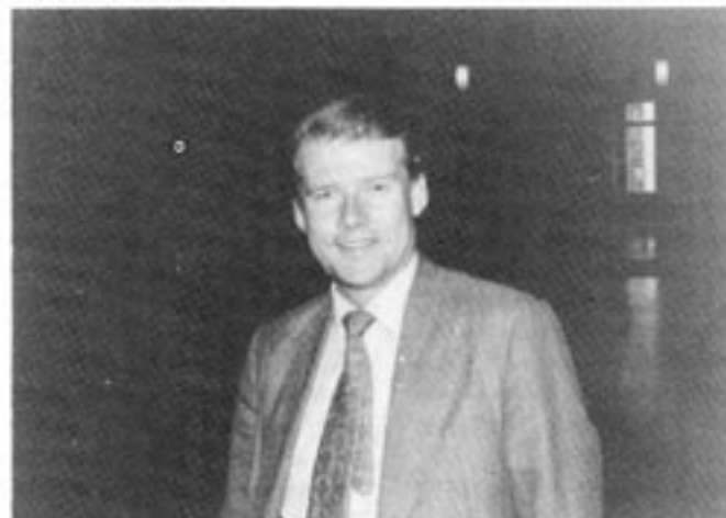
Carl I Hagen har i svenska media skällts för att vara "invandrarfientlig" och t o m rasist. I partiets valmaterial fanns inte ett ord om invandrarfrågan!