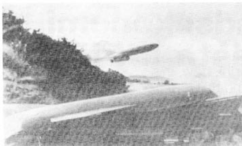
Kinesiska silkesmaskrobotar används av både Irak och Iran. De liknar till utseendet och funktionen svenska RBS-15. Kineserna samarbetar med Flygtekniska försöksanstalten.

Sverige och ger naturligtvis framstående svenska flygtekniker möjlighet till intressanta tjänsteresor — om de har tillräckligt med intressant information att erbjuda.