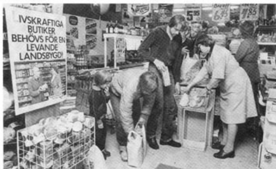
En gynnsam företagsmiljö är förutsättningen för ett framgångsrikt företagande och därmed för en gynnsam ekonomisk utveckling. Viktigare än både kapital och arbete.

Nu äntligen skulle den keynesianska mirakelmedicinen få visa vad den förmådde. Men trots att den statliga upplåningen snabbt ökades på ett sätt Keynes aldrig kunnat drömma om och trots att medicineringsdoser snabbt växte till våldsamma överdoser spred sig krisen, till synes helt oberörd av behandlingen.