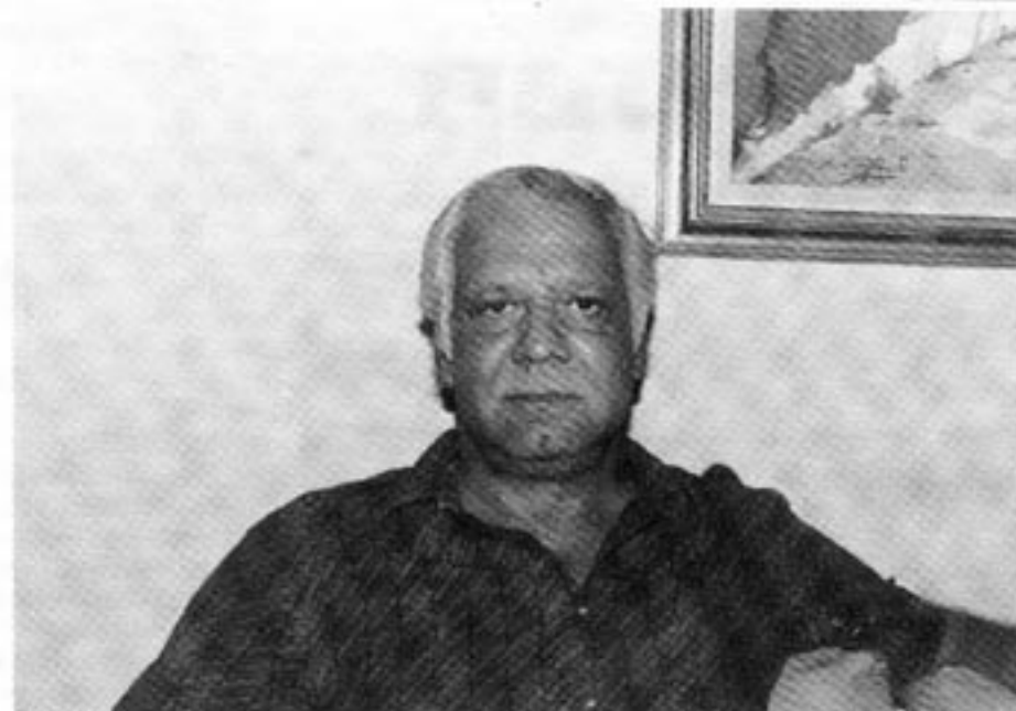
Adolfo Calero Portocarrero menar att den fredliga demokratiska oppositionen i Nicaragua saknar framtid under sandinisterna. Det behövs väpnade insatser för att upprätta ett demokratiskt samhälle. Sandinisternas politik leder direkt mot ett totalitärt samhälle.

också en nationell försvarsstyrka. Inte en enda av våra medlemmar har personligen anklagats för övergrepp under Somoza.