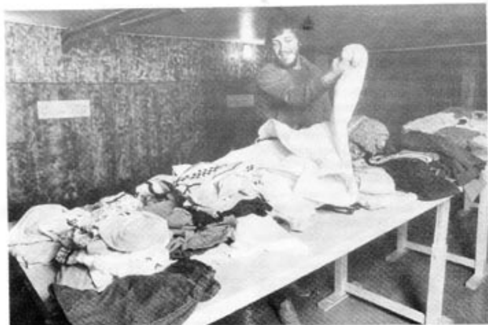
Visst går det att spara pengar på att köpa begagnade kläder. Men slöseri i socialbidragssystemet ligger snarare i den stora administrationen än i de ganska snåla bidragens storlek.

Inte bara beloppens storlek varierar mellan olika kommuner. Även själva handhavandet av bidragsansökningarna skiljer sig åt. I praktiken är den hjälpsökande ofta hänvisad till den enskilde socialassistentens godtycke. Visserligen kan behandlingen av ett ärende alltid överklagas till länsrätten, men den som inte förmår att försörja sig kan på goda