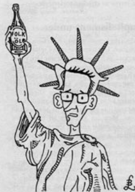
Frihetsministerns viktigaste framsteg: Folköl för säljas på kvällar och söndagar!