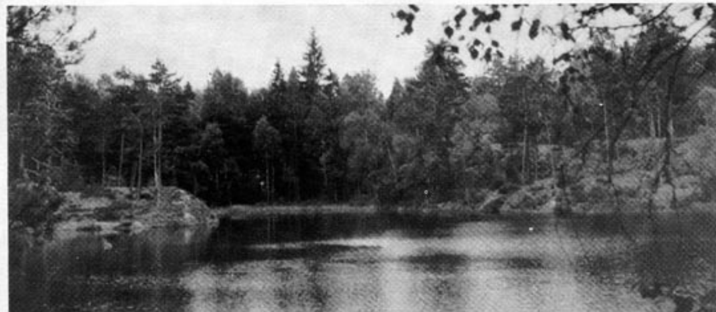
Tyvär är flertalet av våra sjöar bara ett övergående minne från istiden. Oavsett människans aktiviteter har nästan alla sjöar vuxit igen om 15.000 år. Det finns egentligen ingen ekologisk balans utan bara en ekologisk utveckling.

Om man ser till effekterna av mänsklig aktivitet i skilda områden bör man därför förvänta sig att aktivitet i områden med ett smalt ekologiskt system, som i fjällvärlden, har mindre effekt på miljön än vad aktivitet i exempelvis ett djungelområde med sin otroliga artrikedom har. De specialiserade arter som överlevt Alaskas hårda klimat låter sig inte påverkas av en oljeledning (lika lite som en gasledning genom Nord-Norge och Sverige skulle störa den ekologiska "balansen" nämnvärt). Men aktivitet i ett område som idag kännetecknas av stor artrikedom kan sätta igång den process i riktning mot monoton som är naturlig.