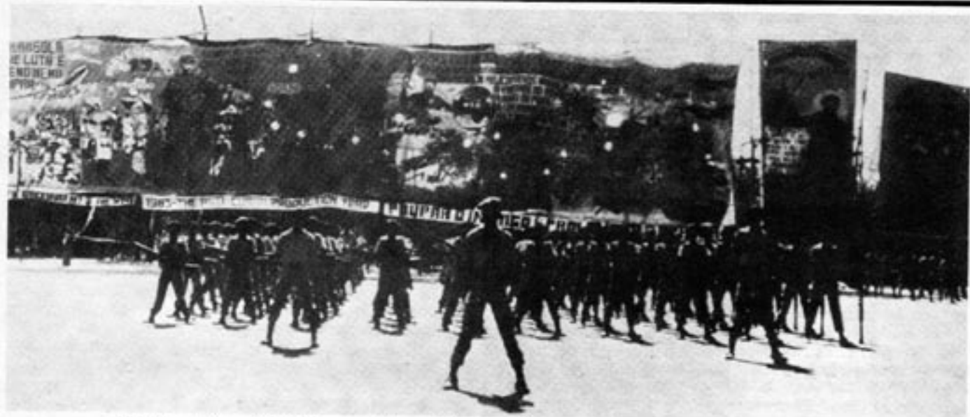
Befrielseörelsen UNITA har tagit kontrollen över allt större delar av Angola. Och samhället - liksom militären - i de befriade delarna av Angola organiseras allt bättre.

jag sa, vapen får vi inte från USA, men politiskt och psykologiskt stöd. Och det är viktigt för oss, att Västs supermakt åter öppet ger oss sitt stöd."