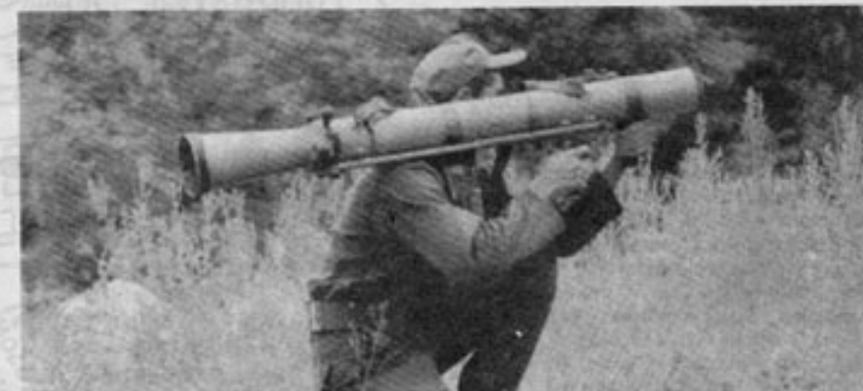
En 8,4 cm granatgevär "Carl Gustaf" för att möta hotet från inhemska och kubanska kommunister. Här utbildas en honransk soldat i hanteringen av granatgeväret av en lärare från US Special Forces.

Marilyn Monroe, Jane Fonda, Burt Lancaster och Robert Redford har börjat invadera östtysk TV på bästa sändningstid, klockan 19.00. Detta för att hålla tittarna borta från de västtyska TV-nyheterna som kan ses av cirka 80% av de östtyska hushållen. De sovjetiska filmer som tidigare utgjort ett så tungt inslag i östtysk TV finns kvar, men visas nu klockan 23.00.