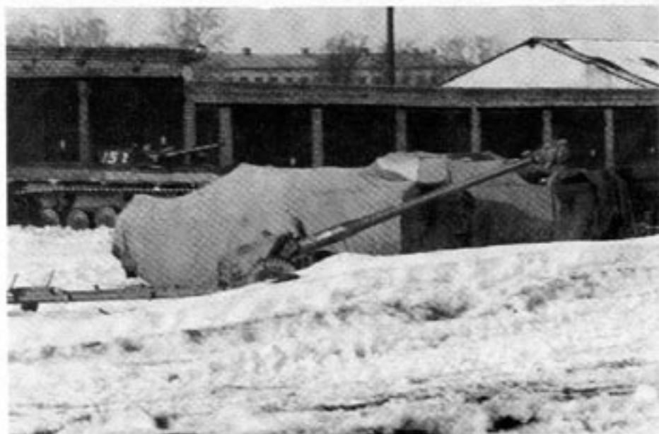
En utsmugglad bild från den sovjetiska pansarbasen Tondi-Järvi i Tallinn. Den har bl a till uppgift att kväsa upplopp eller uppror i Tallinn.

I Jöhvi finns strategiskt artilleri. I robot-