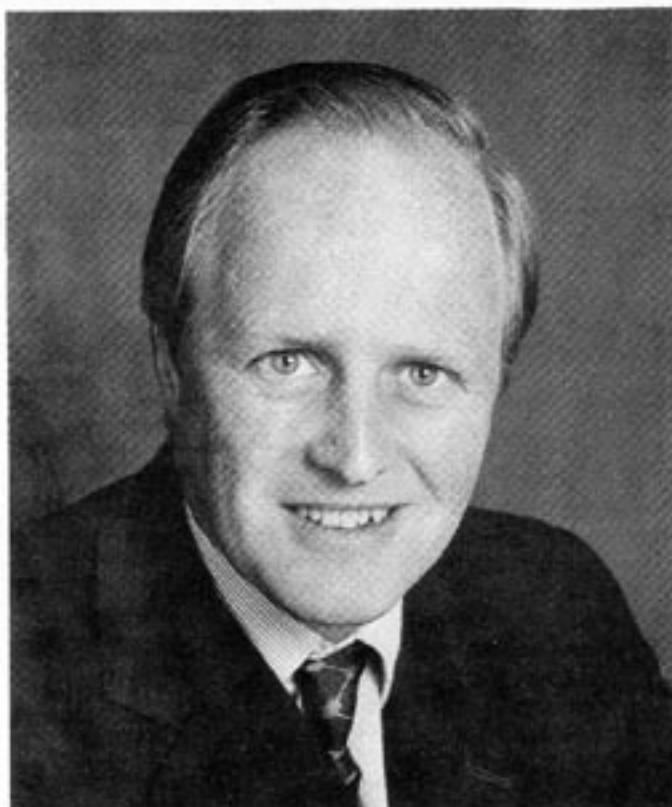
Winston S. Churchill är specialist på försvars- och säkerhetsfrågor. I sin nya bok — som i dagarna kommer på Contra förlag — tar han upp Västs position till kritisk granskning.

Tiotusentals afghaner har dött i kampen mot de sovjetiska inkräktarna, medan tusentals människor i Väst demonstrerar mot sin egen regering för fred. Här följer Vladimir Bukovskijs åsikt om dessa demonstranter: