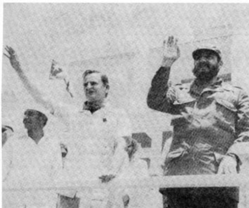
Enligt östagenter i Olof Palmes närhet skall han visserligen vara bestämd motståndare till sovjetisk kommunism, men å andra sidan hysa beundran för kommunism av Castros modell.

att ingripa skulle Sovjet gå till militär offensiv direkt mot Sverige.