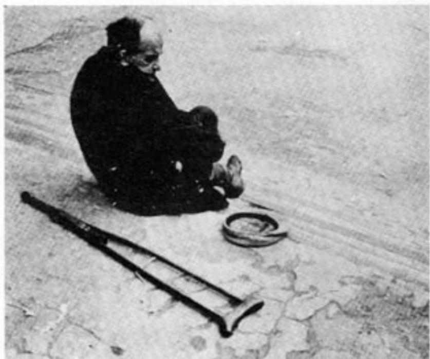
1,5 procent av Sovjets befolkning tillhör den elit som lever i lyx och överflöd. Partipamparna. I andra änden finns ett bottenskiikt. Hur stort det är är okänt.