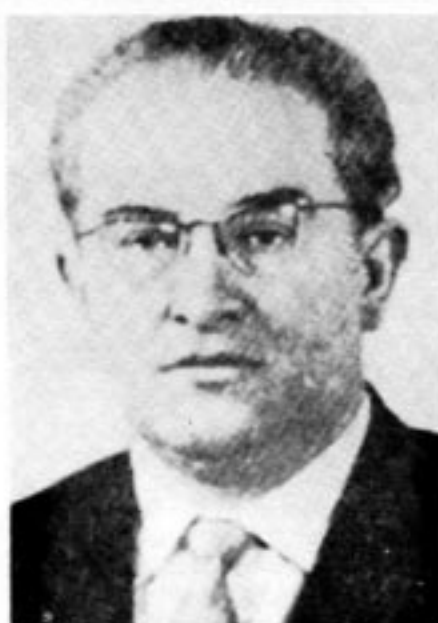
Jurij Vladimirovitj Andropov Kortet togs när han var chef för hemliga polisen KGB.

Efter Andropovs avslutningsord frågade krimtatarerna om de fick rapportera för sitt folk om saken. Andropov försäkrade dem att de skulle få göra det, och han tillade vänligt: "Om ni så önskar skall jag personligen ringa Rasjidov (förstesekreteraren i kommunistpartiet i Uzbekistan) för att ordna bästa tänkbara lokal åt er." Men det var en lögn. Delegaterna fick ingen lokal; inte ens ett utomhusmöte tilläts och de som samlades