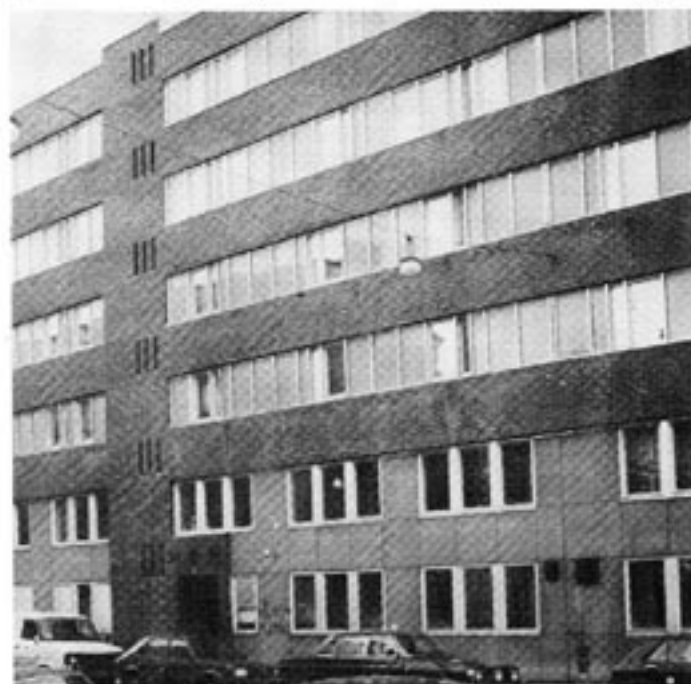
I den här Stockholms-fastigheten finns en sovjetisk klubb inrymd. Stockholms stads invandrarnämnd betalar 3.000 kronor i månaden i hyresbidrag!