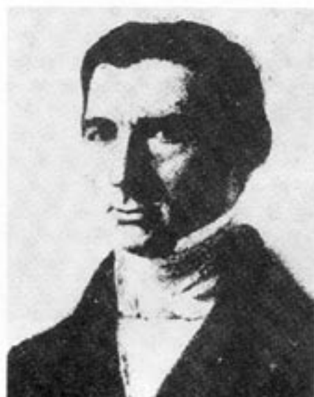
Frederic Bastiat levde för över 100 år sedan, men hans tankar om marknadsekonomin är gångbara än idag.

Även om Bastiats nationalekonomi egentligen inte var unik, så var hans politiska filosofi det. Bastiat inriktade sig särskilt på att definiera vad staten är och pekade på dess rättmätiga ansvarsområden. Hans definition av staten är typisk för hans tänkande: "Staten är den stora fiktion varigenom alla försöker att leva på alla andras bekostnad" (1848). Med denna definition framhävde Bastiat vad staten i verkligheten var på hans tid (och än idag), en apparat som gör det möjligt att med politisk makt tillskansas sig privilegier på bekostnad av andra, med hjälp av tullskydd, subventioner, statsgaranterade monopol osv. En statsmakt med sådana