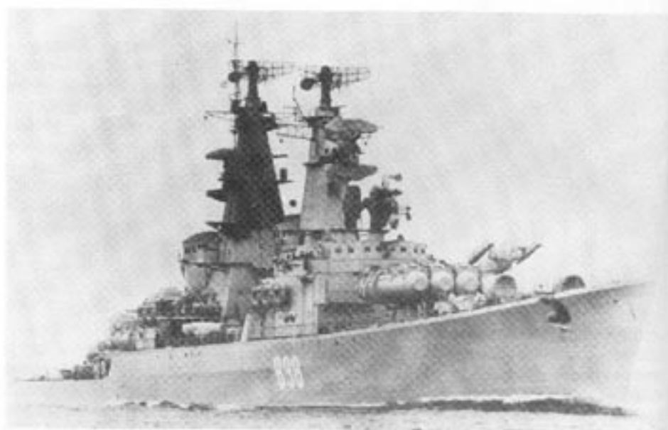
Utomordentligt betydelsefull för den sovjetiska militära frammarschen har utbyggnaden av flottan varit. Här ses en modern sovjetisk robotkryssare av "Kynda"-klass. Den har sjöroboter med räckvidd på 45 mil.

Sedan 1919 har Sovjet med vapenmakt invaderat och med våld påtvingat 29 länder med en befolkningen på över 180 miljoner människor kommunistisk diktatur — 1919 Ukraina, 1920 Azerbaidjan, 1921 Georgien, 1924 Mongoliet, 1939 Estland, Lettland, Litauen, 1944 Finska Karelen, 1945 Manchuriet och den japanska ögruppen Kurilerna, 1946 Bulgarien, 1947 Polen, Rumänien, Ungern, 1948 Tjeckoslovakien, 1949 Östtyskland, 1959 Kuba, 1969 Sydjemen, 1973 Guinea, 1975 Angola, Laos, Mozambique, 1977 Etiopien, 1979 Kambodja, Afghanistan.