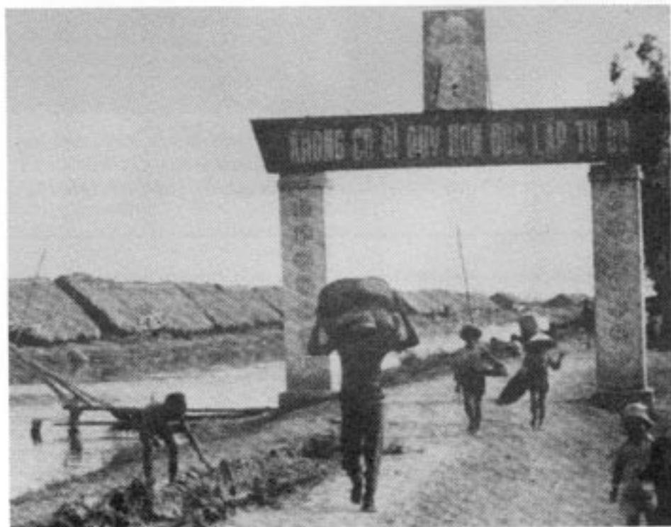
Vägen in i det totalitära samhället kan vara tydligt utmärkt som porten till detta vietnamesiska arbetsläger. Men risken är stor att vi råkar ut för en mer smygande väg till det totalitära samhället. Tusentals små steg som sammantagna för oss dit, utan att vi noterar när vi överskrider gränsen.

Bertil af Ugglas' motion behandlades i skatteutskottet. Där avvisades förslaget med eftertryck. Utskottet skriver att det redan