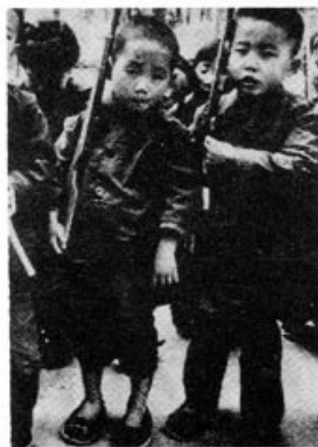
Myten om de frodliga kineserna är en av propagandan skapad myt. Från yngsta åldrar i dagis tränas kinesiska barn i vapenbruk.

John Frazer: Kineserna. Porträtt av ett folk. Bonniers. ISBN 91-0-045337-4.