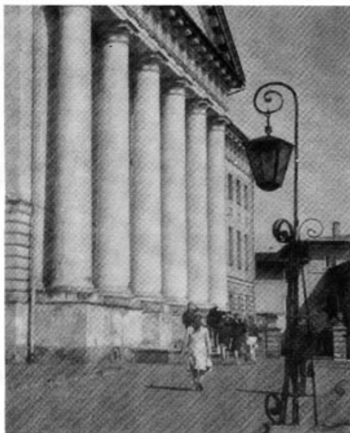
Universitetet i Tartu (Dorpat) grundades av Gustaf II Adolf. Sedan gammalt är Tartu centrum för högre utbildning i Estland. Där finns också en betydande del av den politiska oppositionen.