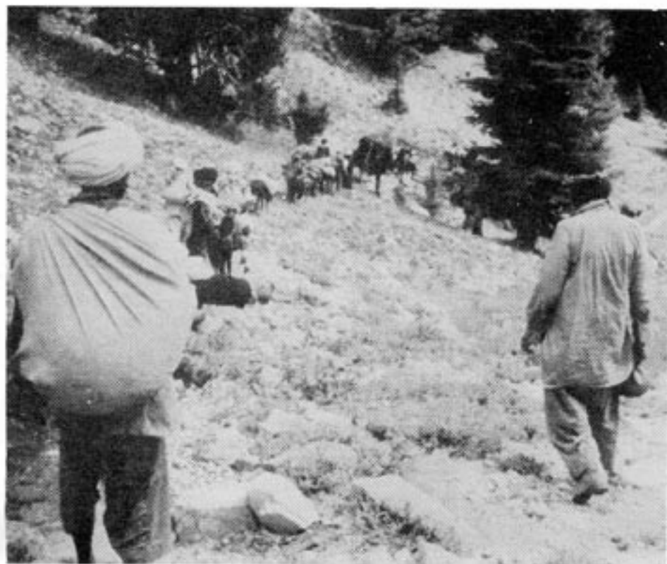
Sveriges Fredsråd har misslyckats med att anta ett uttalande om Afghanistan. I Fredsrådet har nämligen den Moskva-vänliga Svenska Fredskommittén vetorätt. Då blir det inga kritiska ord om Sovjet.