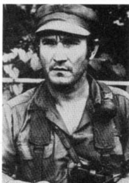
Eden Pastora, Nicaraguas revolutionshjälte "Commandante Zero" har vänt sina gamla vapenbröder ryggen. "Det var inte för att inträtta en marxistisk diktatur som guerillasoldaterna störtade Somoza-regimen", säger han.

"Det är återigen som under Somoza. En fascistisk diktatur. Den här gången från vänster."