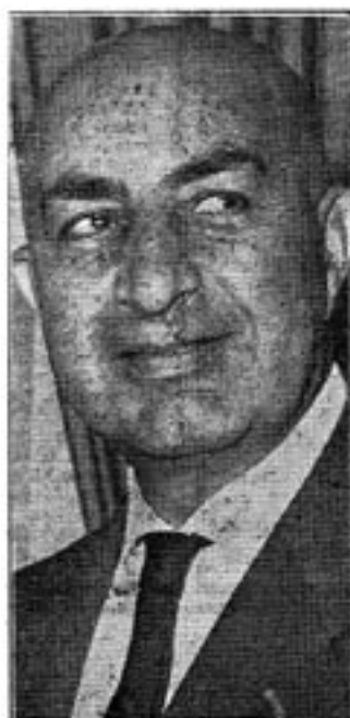
Före presidenten Mohamed Daoud

Under mitten av 1970-talet utövade ryssarna så starka påtryckningar att