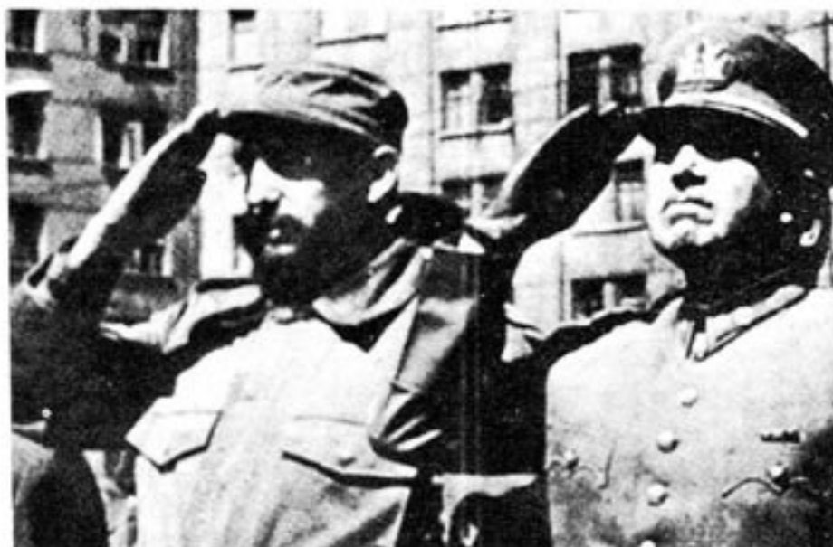
Gastro och Pinochet hyllar sina respektive länders flaggor vid en t-te-t-te i Santiago de Chile.

Många betraktar sjukvården som det kanske enda sättet att få lite återbäring på de höga skatterna. Att ut-