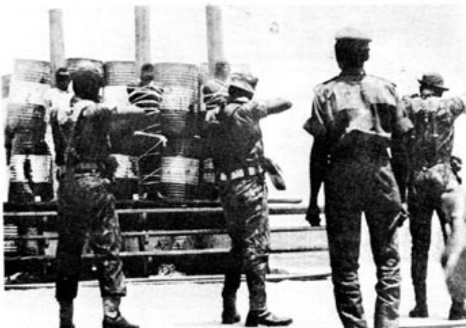
Marxismen i arbete. Politiska motståndare till kommunistregimen i Angola arkebuseras. (Sverige har Angola som "huvudmottagarland" för u-landsbistånd).