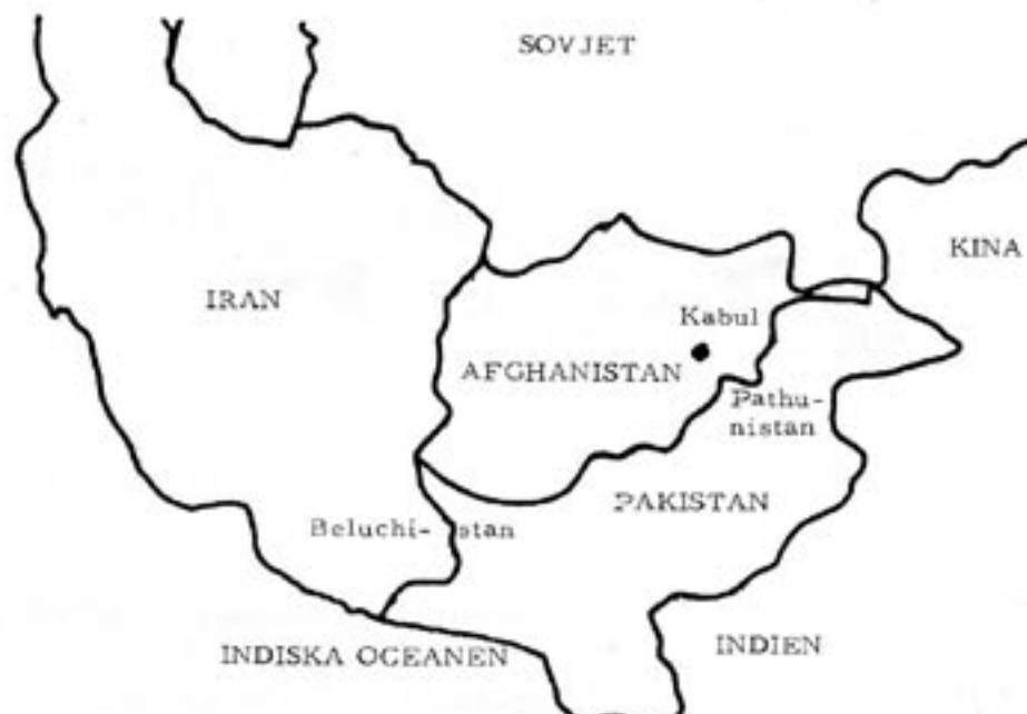
Afghanistans strategiska läge - på Sovjets väg till Indiska Oceanen och nära de potentiella oroshärdarna Beluchistan och Pathunistan