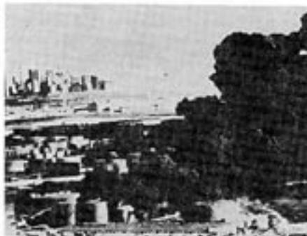
Oljebrand i New York. Hade vädret varit ogynnsamt kunde branden ha medfört hundratals dödsoffer.