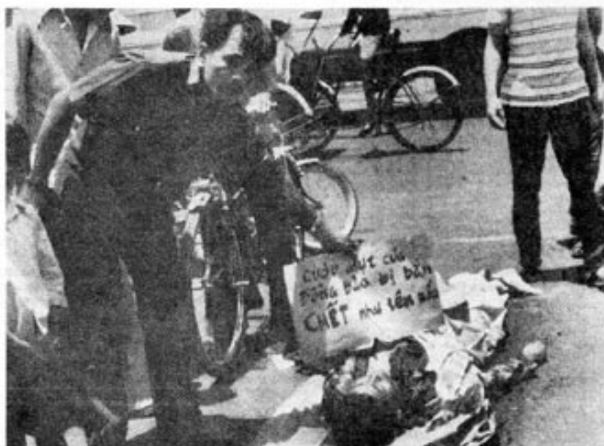
Avrättad efter gata"rättegång" i Saigon

Vad beträffar det militära motståndet mot kommunisterna uppgavs i slutet av juli att kärnan av den 2:a divisionen skulle ha spritt ut sig och organiserat attacker mot de nya makthavarna söder om Saigon. Den nya guerillan uppges ha tagit kontakt med den starka religiösa sekten Hoa Hao. Motståndet mot kommunisterna skall vara koncentrerat till områdena närmast den kambodjanska gränsen och området kring Long Kuyen. I Mekong-deltat opererar fortfarande vissa jägarkorps. Och norr om Saigon har anti-