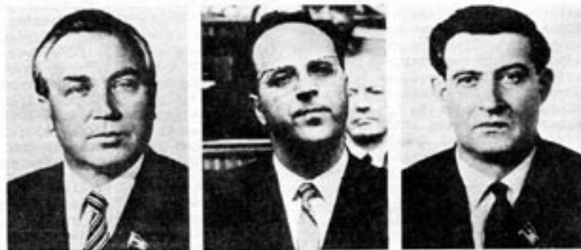
G.V. Romanov, K.P. Katushev och V.I. Dolgikh

Artikelförfattaren menar att på kort sikt skulle Andrei P. Kirilenko och F.D. Kulakov ligga bäst till som efterträdare till Bresjnev. Efter som bägge är förhållandevis gamla (69 respektive 57) rycker emellertid andra personer fram som de mest troliga efterträdarna, om valet av efterträdare dröjer längre än 1976. I så fall skulle V.I. Dolgikh, K.P. Katushev och G.V. Romanov ligga bättre till. På samma längre sikt skulle ett namn som Boris Ponomarev kunna bli aktuellt.