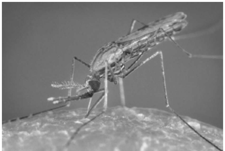
Må vara att det kan vara bra med artrikedom. Men somliga arter skulle mänskligheten klara sig bättre utan, som anopheles gambiae , malariamyggan.