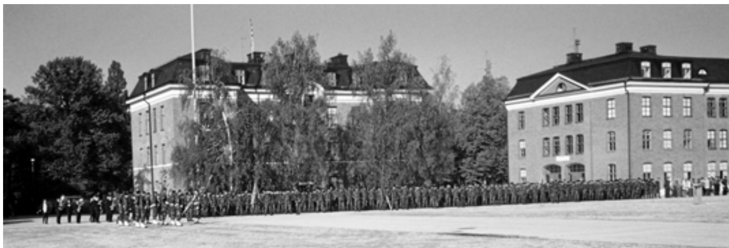
P18 samlad i Visby garnison på regementets dag år 2000. P18 utbildade årligen 600 soldater.