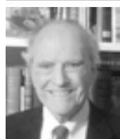
allan.c. brownfeld @contra.nu

När det gäller läkemedelsbolagen verkar det ha varit girighet som var drivkraften. Mylans prislurendrejeri är bara det senaste exemplet på en växande trend.