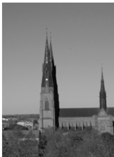
Miljoner av Svenska kyrkans medlemmar förstår inte varför en biskop tycker att det är fel att kristna bär ett kors.

Artikeln är med vederbörligt tillstånd återgiven ur den kristdemokratiska tidningen Poetik ( www.poetik.net )