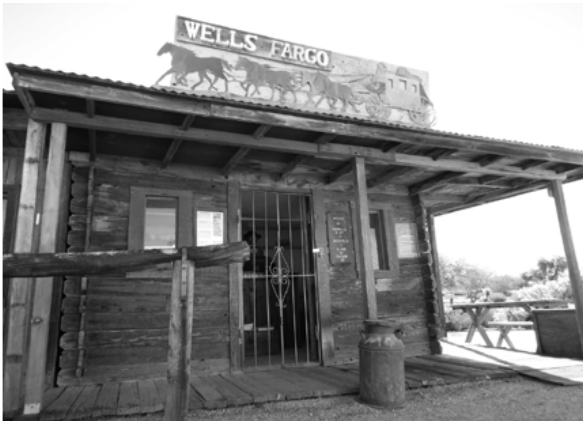
USAs största konsumentbank, Wells Fargo, öppnade konton åt 2 miljoner kunder som inte beställt dem, men väl fick betala för dem. Skadeståndet blev 185 miljoner dollar... Banken grundades 1852 och var stor i Västern. Här ett 1800-talskontor från Arizona som idag är museum.

ver den materialistiska uppfattningen om historien: ”Den materialistiska teorin om historien, att all politik och etik är ett uttryck av ekonomin är helt enkelt fel. Det innebär en sammanblandning av de nödvändiga förutsättningarna för livet med livets normala gång, som är en helt annan sak. Det är som att säga att för att en människa kan gå på två ben, så går han aldrig för något annat ändamål än att köpa skor och strumpor.”