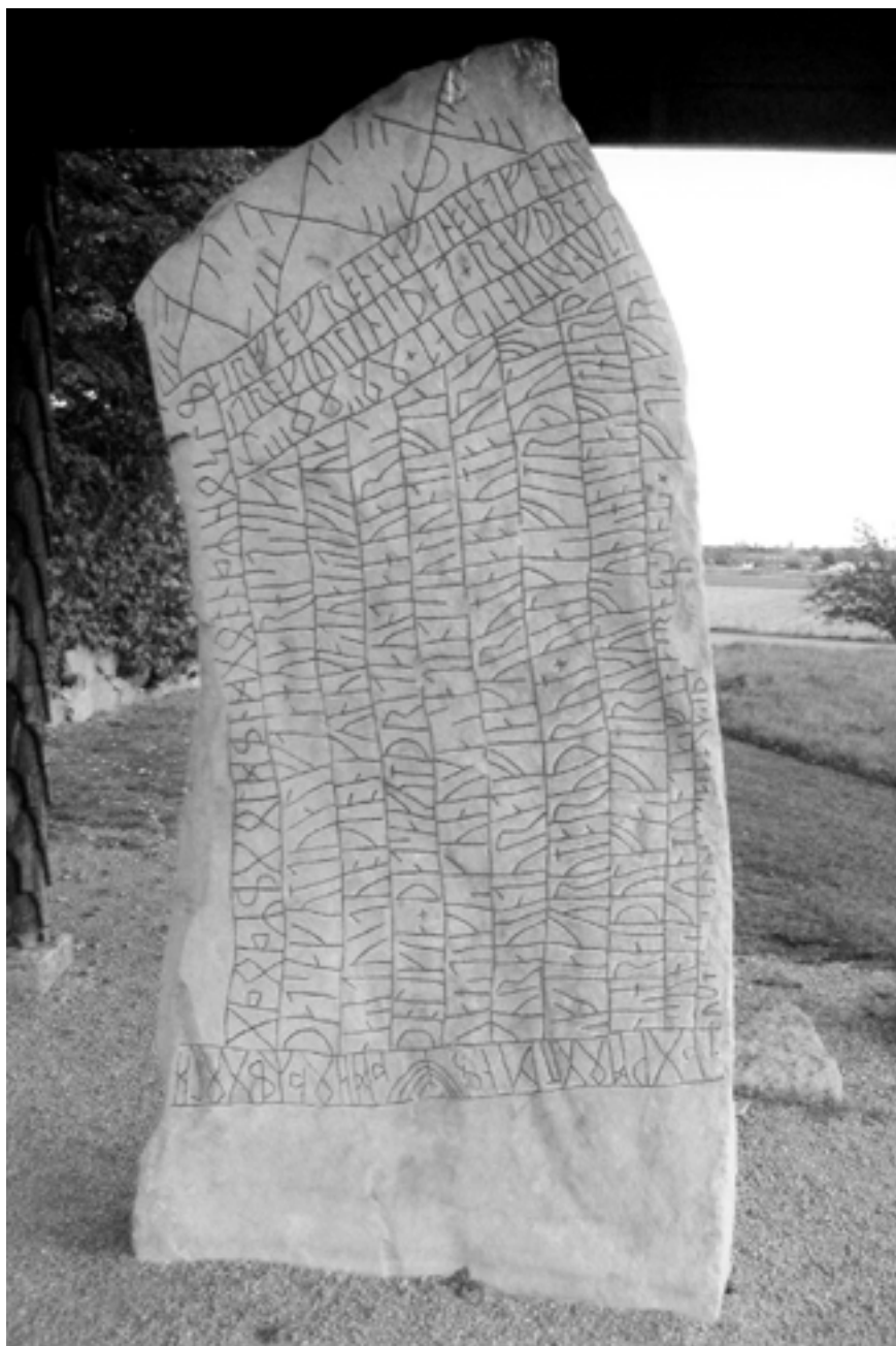
Rökstenen i Ödeshög, ett av landets äldsta skriftliga minnen, i Östergötland är ett exempel på genuin svensk kultur.

1997 förstärktes det mångkulturalistiska greppet om samhället med propositionen Sverige, framtiden och mångfalden som undertecknades av invandringsminister Leif Blomberg (S). Hela samhället – dess arbetsmarknads-, social-, skol- och kulturpolitik – skulle baseras på den så kallade mångfalden. En massiv propagandainsats skulle säkra åttlydnaden av regeringsdirektiven. 9