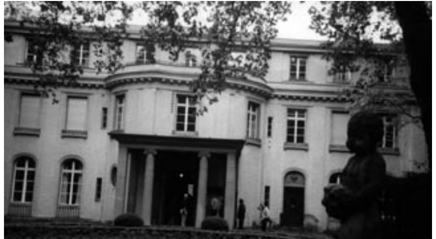
I den här lyxvillan i Berlin-förorten Wannsee lades ritningarna upp för ”den slutgiltiga lösningen” på ”judefrågan”.