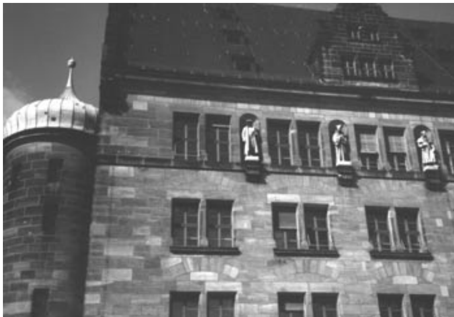
Den gamla domstolsbyggnaden i Nürnberg, där de nazistiska krigsförbrytarna fick sina domar för 60 år sedan.

Neave ställdes öga mot öga med Göring då han hade uppgiften att till den åtalade, å den internationella militärdomstolens vägnar, överlämna en maskinskriven kopia av Görings åtal. Neave överlämnade till Göring även en lista över de (tyska) försvarsadvokater som fanns tillgängliga. Göring sade sig dock hellre vilja försvara sig själv, eftersom han aldrig haft något med advokater att göra tidigare och dessutom uttryckte tvivel över om någon tysk advokat skulle våga försvara honom i en domstol styrd av de allierade makterna. Göring tvivlade dessutom på att åtalet hade någon laglig förankring.