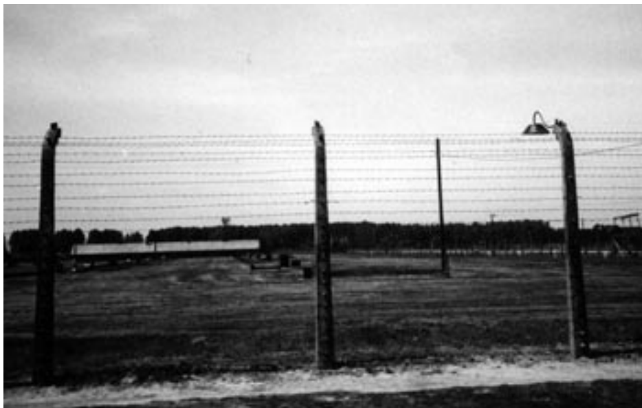
Massmorden på judar i Auschwitz-Birkenau tilldrog sig stort intresse vid Nürnberg-processen 1946.

vilket förklarar hans uppdrag i Warszawa 1944 där han nådde en överenskommelse med den polske motståndsledaren Bor-Komorowski om eld upphör. Om sin överordnade Heinrich Himmler gav von dem Bach följande, förmodligen helt korrekta, omdöme: ”Han var hårdhärtad på grund av en fanatisk ideologi. Men han var utan tvivel vek och feg” (sidan 289).