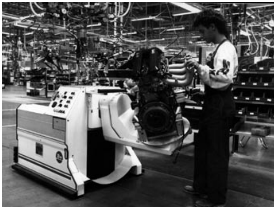
Traditionella verkstadsjobb är idag bara förunnat ett fåtal ungdomar. Det behövs flexibilitet för att ungdomar ska komma in på den reguljära arbetsmarknaden.

Centerpartiet är idag det enda parti som på allvar utmanar den stelbenta arbetsrätten i Sverige. Inom arbetsmarknadspolitiken kan man lugnt påstå att Moderaterna och Centerpartiet har bytt plats. Slutligen kan Larry Kudlow på Townhall.com få sammanfatta det svenska och franska problemet: "In France, you see, companies don't grow because it's too costly to hire while it's against the law to fire." 📧