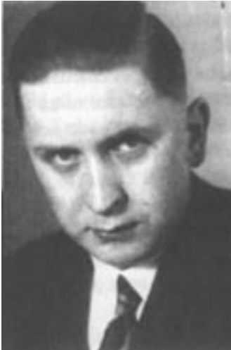
Auschwitzkommendanten Rudolf Höss framträdde som vittne i Nürnberg. Han hängdes 1947 i Auschwitz.