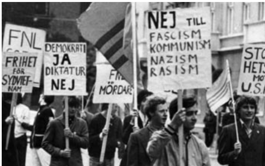
Det fanns i Sverige också en opinion för USA och Sydvietnam på 1960- och 70-talen. Här ett demonstrationståg till stöd för Sydvietnam i Malmö 1971.