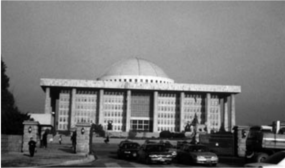
Nationalförsamlingen på Yoido-ön i Seoul, med plats för 299 parlamentariker, har blivit en symbol för den demokratiska utvecklingen i Sydkorea.

för de båda koreanska staternas fredliga återförening, hölls människor som demonstrerade mot Nordkoreas politik tillbaka av polisen. Den 14 augusti planerade konservativa en presskonferens i syfte att fördöma ett besök av en nordkoreansk delegation vid Nationella gravplatsen, men polisen blockerade den på ett kraftfullt sätt. En ung deltagare greps därför att han försökte skrika: "Ner med Kim Jong-ils diktatur".