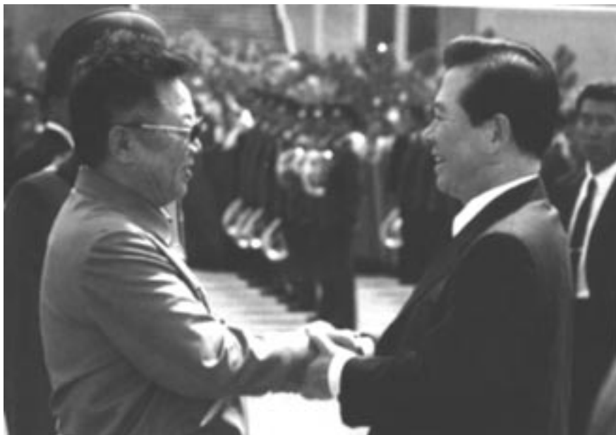
Sydkoreas president Kim Dae-jung (t.h.) hälsar på Nordkoreas ledare Kim Jong-il i Pyongyang 2000. Kim Dae-jungs nordkoreapolitik, även kallad ”solskenspolitik”, ligger till grund för dagens positiva sydkoreanska syn på diktaturen i norr.

I oktober 2000 definierade Kim Dae-jung mänskliga rättigheter i Nordkorea som att de var samma sak som frihet från svält och bekymmer om krig. Detta var ett indirekt sätt att kasta skulden för Nordkoreas svältande befolkning på Förenta staterna, som påstods hota med krig och ekonomiska sanktioner. Under året som kommer, framhöll Kim Dae-jung, ”skulle det inte vara rätt för oss att ta upp ämnet mänskliga rättigheter för nordkoreanerna.” Detta perspektiv gjorde att han opponerade sig mot europeiska länder som föreslog att frågan om mänskliga rättigheter i Nordkorea skulle hänskjutas till FN:s kommission