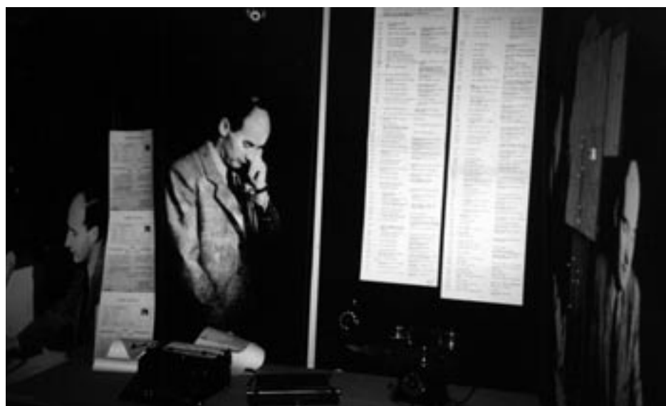
Judiska Museets Wallenberg-utställning – varav här syns en del – har blivit en succé i Sverige såväl som i utlandet.

Wallenbergutställningen bör ha särskilda förutsättningar att uppmärksammas just i Warszawa, där före Förintelsen var tredje invånare var jude. Polen hade före Andra världskriget i själva verket en av världens största judiska befolkningar: 3,5 miljoner judar bodde i Polen innan Hitler och Stalin delade upp landet mellan sig som en följd av Molotov-Ribbentroppakten. I det förkrigstida Polen fanns, efter mer än 800 års judisk närvaro i landet, en rik jiddisk-kultur och en livaktig sionistisk rörelse. Allt detta sopades bort av Förintelsen. I gettot i Warszawa bodde 1940-43 430 000 judar; 47 underjordiska tidskrifter gavs ut i gettot. Efter krigsslutet 1945 återvände 200 000 polska judar som flytt till Sovjetunionen, under det att 50 000 judar lyckats överleva