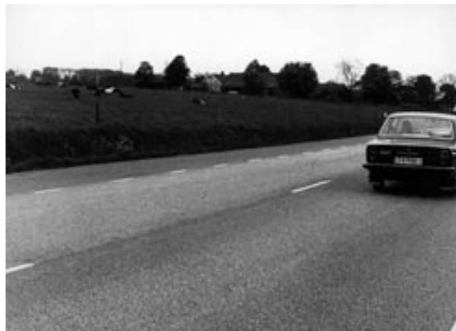
Bilen, en av den moderna tidens verkliga miljöbovar – om vi får tro miljövästerns propaganda.