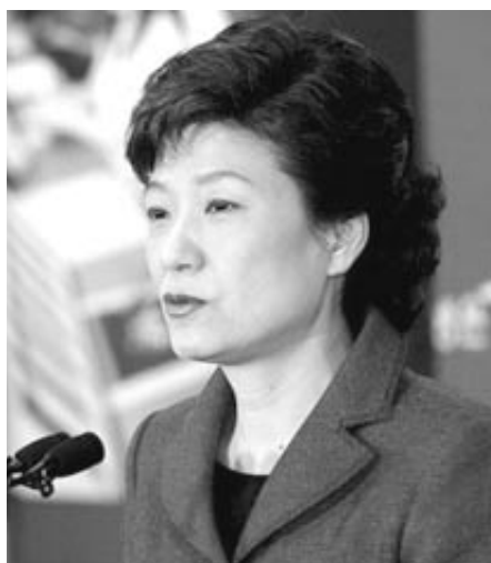
Park Geun-hye, ledare för den sydkoreanska högeroppositionen. Landets nästa president?

Den nuvarande presidenten Roh Moo-hyun, en tidigare människorättsadvokat och regimkritiker, anses allmänt stå relativt långt till vänster och ha en kritisk inställning till USA, men fortsätter ändå att ställa