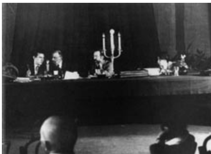
Fr.v. Zinovjev, Lenin, Serrati, Balabanova under en Kominternkongress, fyra av den bolsjevikiska terrorns tillskyndare.

Europa och framförallt Ryssland skakades kring sekelskiftet 1900 av en rad terrordåd, ofta riktade mot höga representanter för det etablerade samhället. Bakom dessa terrordåd stod anarkismen, vilken strävade efter ett statslöst samhälle utan någon form av överhet. Dess ideologiske upphovsman anses ha varit den franske tänkaren Pierre-Joseph Proudhon. Denne var ingen våldsförespråkare, men efter honom kom talrika av hans anhängare och efterföljare att förespråka terrorvåld som ett oundgängligt revolutionsredskap. Bland de högt uppsatta personer i västvärlden som mördades av anarkister kan nämnas Frankrikes president Sidi Carnot (1894), kejsarinnan Elisabet av Österrike