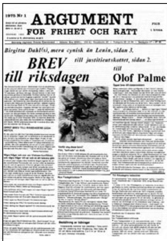
Omslaget på Argument från 1975. När tidskriften var som störst spreds den i nära 30 000 exemplar.

–Jag är oerhört imponerad av ert ”håll igång” – alla dessa trettio år! Och också över Contra s förnämliga bokutgivning. Svante avslutar intervjun med ett ”Lycka till Contra !”