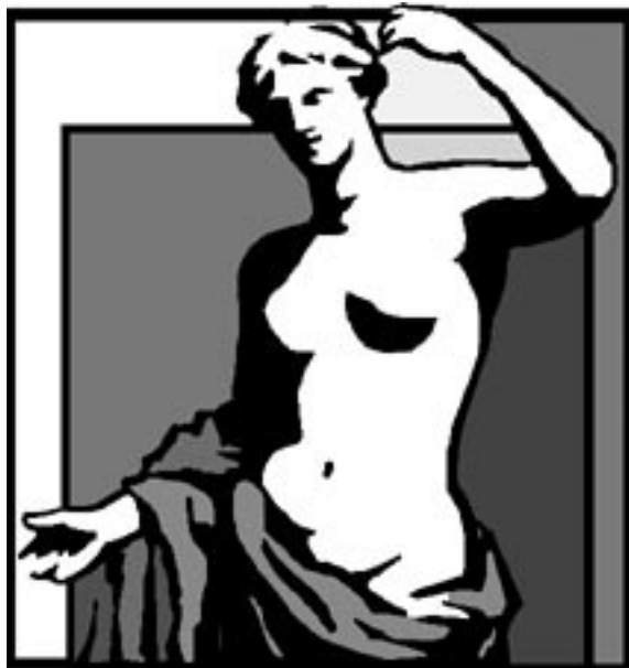
Feministrörelsen söker fortfarande sin identitet.