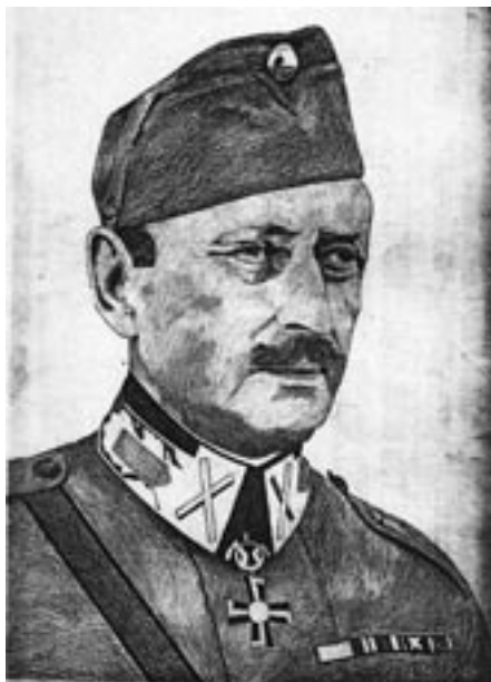
Marskalk Carl Gustaf Emil Mannerheim valdes nyligen till Finlands viktigaste person någonsin. Tyvärr fläckas hans minne i ett revisionistiskt bokverk.