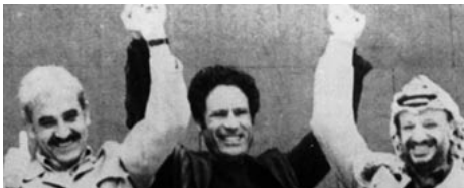
Tre fula fiskar på en bild – fr.v. PFLP-ledaren George Habash, Libyens diktator Moammar Qaddafi och PLO-ledaren Yassir Arafat. I dag är endast Qaddafi i livet.

Man kan emellertid tillåta sig överse med denna typ av tillkortakommanden