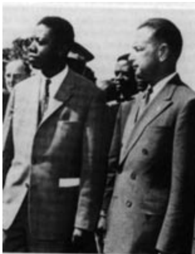
Tshombe och Hammarskjöld möts 1960.

"Om Hammarskjöld inte hade ingripit utan låtit Belgien återställa ordningen är det möjligt att krisen hade lösts utan svårighet, med ett minimum av blodsutgjutelse. Tshombe ville få loss Katangas gruvindustri ur de kaotiska förhållandena och förklarade provinsen självständig den 11 juli. Även detta problem kunde antagligen ha lösts genom förhandlingar.