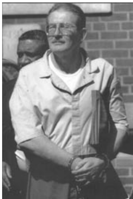
Aldrich Hazen Ames avtjänar livstidsstraff för sitt förräderi. Han avslöjade tjugofem västtagenter i sovjetiska KGB och GRU, åtminstone tio av dem avrättades.