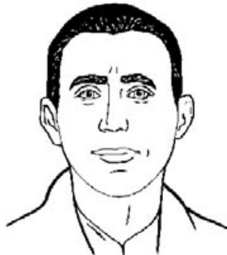
Den tyske dramatikern Bertolt Brecht – en tid bosatt i Sverige – försvarade sovjetkommunismen i vått och torrt.

Ett annat exempel är den franske filosofen Jean-Paul Sartre. I en intervju med tidningen Libération 1954 sade Sartre, som just hade återvänt från Sovjet, att sovjetiska medborgare avstod från att resa, inte på