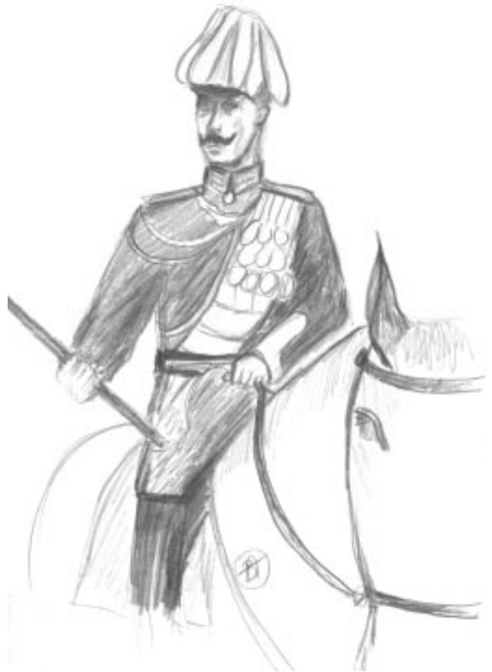
Kejsar Wilhelm II, tysk statschef som tvingades abdikera 1918 och som därefter tog sin tillflykt till det nederländska slottet Doorn. Namngivare åt "wilhelmismen".

Men det förnuft Hegel talar om kommer inte till uttryck genom en oavbruten rad godartade händelser. Det framgår i stället i form av en rad processer, vilka är en följd av människans fria vilja på gott och ont. Det är här berättigt att tala om en historisk utveckling av trial and error , där vårt öde är att på vägen mot det hägrande slutmålet övervinna hinder och ibland begå ödesdigra misstag ägnade att öka det mänskliga lidandet, men där den erfarenhet som blir följden på lång sikt kan vara av oskattbart värde. Hegel beskrev, det erkännes, denna utveckling en aning för stelbent. Det är i detta perspektiv de tre "ondskans imperier" som denna bok handlar om måste ses: maktstinna världsriken vilka drivit fram 1900-talets tre världskrig, där den tredje världskonflikten var den mellan kommunismen och den fria världen. 1900-talets destruktiva "ismer" har varit varianter på två temata – nationalism och egalitarianism in absurdum. Genom den principiellt goda sidans seger i dessa tre globala konflikter har lagts en grundval för det historiska mål av frihet och förnuft i absolut mening, vilket Hegel såg som det yttersta mänskliga idealet. Erkännes att det kan vara svårt att skönja detta mål med exempelvis vansinniga terroredåd som de i USA i september 2001 eller en rad eldfångda konflikthärda värld-