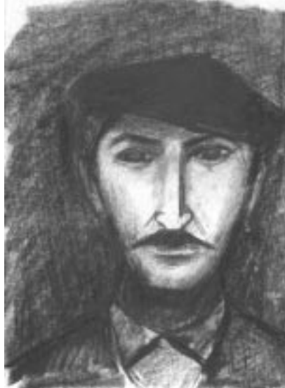
Josef Stalin konsoliderade och byggde upp Sovjetunionen och kommunismen med terror och massmord som vapen. Ännu värre massmördare än Hitler.

Således är dessa tre ideologier utplösligt sammanlänkade i en mörk historisk kedja: wilhelmismen utdelar stöten som ger upphov inte bara till Första världskriget och nationalsocialismen (och med