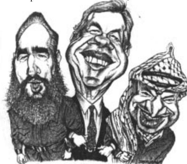
Tre goda vänner – Fidel Castro, Jimmy Carter och Yassir Arafat enligt en amerikansk satirtecknares synsätt.

Om Carter för drygt två årtionden sedan kunde framstå som en opartisk medlare i