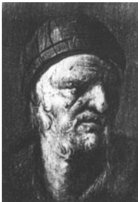
Ingen vet hur Nils Dacke såg ut, men så här fantiserade konstnären C.G. Pilo att han kunde ha sett sig. Bilden är givetvis ett nidporträtt.

Populära historieskrivaren Herman Lindqvist har påpekat, att de uppror mot överheten som ändå förekommit i vårt fredliga land av de styrande i propagandistiskt syfte avfärdats med klämmiga epitet som "Stora daldansen", "Klockupproret" och icke minst då