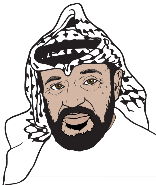
Den åldrade terroristledaren Yassir Arafat fortsätter att undergräva freden i Mellanöstern.

Yassir Arafat är föga mer än en gangster och bluffmakare. Under sin tid som PLO-ledare och ordförande i al-Fatah har Arafat varit ansvarig för att tusentals oskyldiga människor dött som offer för den hänsynslösa palestinska terrorn – från inbördes-