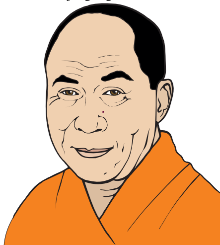
Dalai lama – inte välkommen till Kim Dae-jungs Sydkorea.

framkallat en upprörd storm av protester i Sydkorea, också från den romersk-katolska kyrka presidenten tillhör. För Contras läsare kommer Kims beteende knappast som någon överraskning, enär vi tidigare på det här utrymmet berättat om hur han bett om ursäkt för Sydkoreas uppslutning på USAs och Sydvietnams sida under Vietnamkriget.