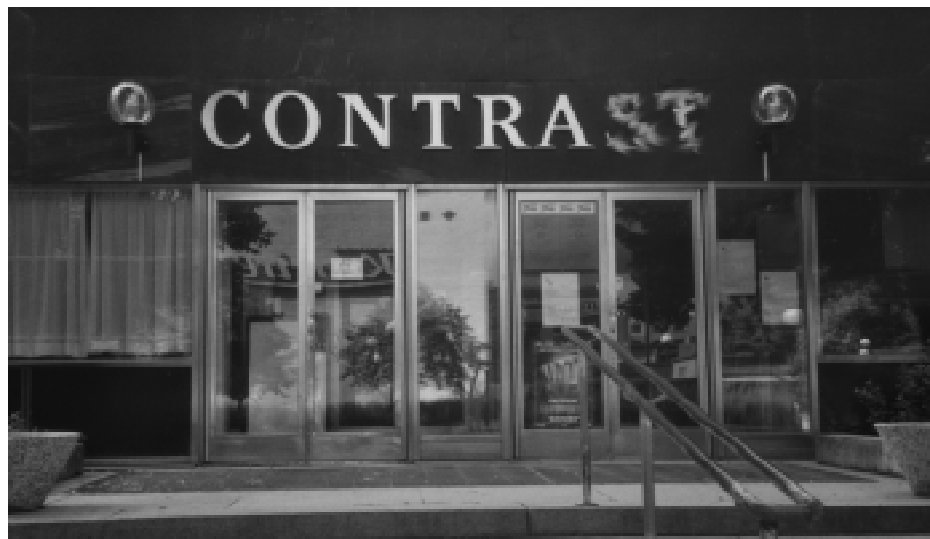
Bara några tiotal folkbibliotek prenumererar på Contra . Stadsbiblioteket i Eskilstuna tar dock igen skadan genom en väldigt tjugig skylt på en sidoingång

Sitt avståndstagande till boken Dödsstraffet, ett försvar bygger Stadsbiblioteket i Skellefteå i främsta rummet på det omdöme boken fått av Bibliotekstjänst. Den som skrivit omdömet beskriver sig själv som motståndare till dödsstraffet, med tillägget en mycket stark sådan. Efter klagan från författaren att en dödsstraff-motståndare med anknytning till Amnesty fått skriva omdömet, vägrar Bibliotekstjänst ändå att låta annan person skriva nytt omdöme. Bibliotekstjänst tillåter nämligen sina lektörer att göra personliga omdömen. Beslut av Bibliotekstjänst kan inte anfäktas hos JO, eftersom Bibliotekstjänst är ett privat företag, bildat av Sveriges folkbibliotek.