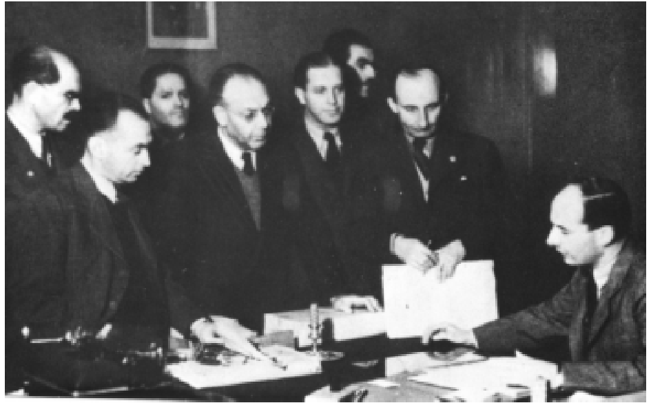
Raoul Wallenberg vid sitt skrivbord jämte sina närmaste medarbetare på den svenska legationen i Budapest vid juletid 1944. Ett par veckor senare hade han gripits av ryssarna.

Nej, att vi inte försökte få Wallenberg utväxlad kunde ryssarna endast förklara med hans skuld. Hans fem schweiziska diplomatkolleger, som också arresterades i Budapest, utväxlades under 1946 mot åttaryska spioner. Wallenberg kunde också ha blivit befriad om det skett då. Han var ju en orättmätigt fängslad svensk diplomat, och någon utväxling borde inte ha behövts om frågan drivits till sin spets, till exempel