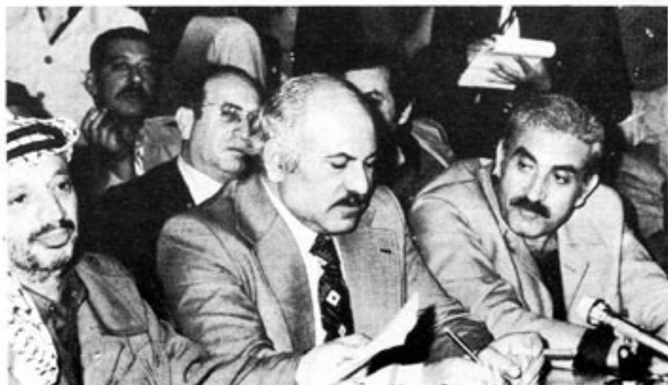
Från vänster till höger Yassir Arafat, Ahmed Jibril och Georg Habash på en konferens i Libyens huvudstad Tripoli.