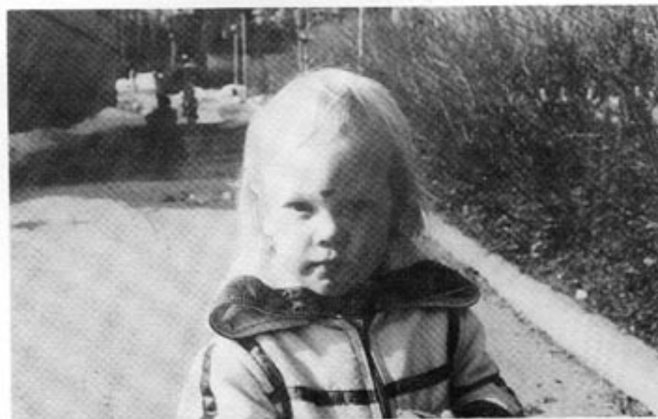
I 1930-talets socialism, enligt makarna Myrdal, skiljer man mellan "toppvärdiga" och "icke toppvärdiga" barn. De icke toppvärdiga bör hindras från att fortplanta sig.

*Lebensborn var ett program i Tyskland som syftade till att avla och uppfostra "ariska elitbarn". Ariska kvinnor med goda egenskaper placerades på särskilda inrättningar, dit utvalda soldater och officerare ägde tillträde. Avkomman skulle sedan inom projektets ram ges gynnsamma uppväxtbetingelser.