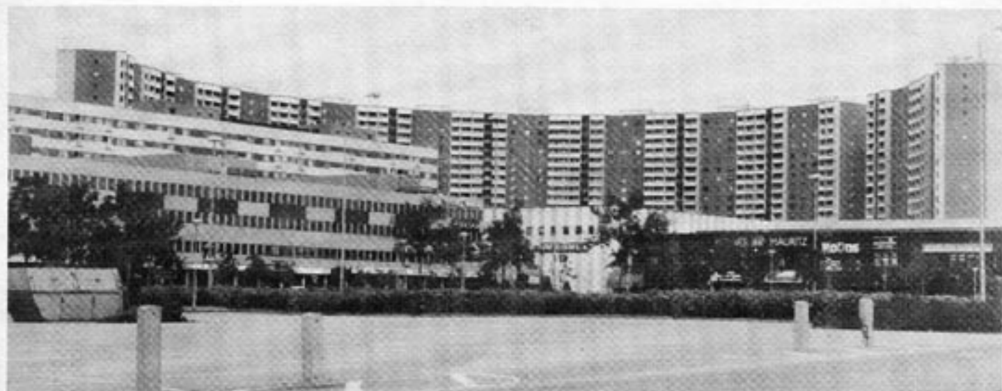
Enligt bostadsanvisningslagen, införd på förslag av Birgit Friggebo, kan kommunen tvinga bostadsrättsföreningar att ta in sociala problemfall som hyresgäster istället för de medlemmar som sparar i tio år för att få ihop till insatsen i det hus som föreningen bygger åt sina egna medlemmar. Lagen kommer sannolikt inom kort att införas i Stockholm.

av de lägenheter som idoga småsparare har låtit bygga efter många års skötsamt liv. Istället skall förtursfall placeras där. Förturdesvis "sociala" förtursfall.