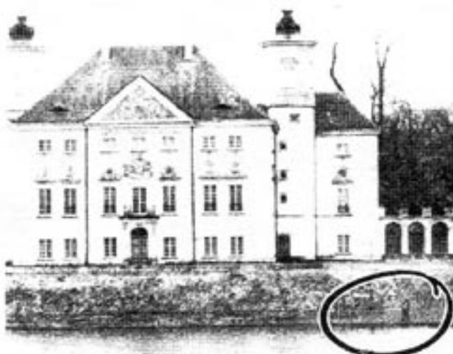
På den pampiga egendomen Arlamovo har en del framstående medlemmar i Solidaritet hållits fängslade. Bl a Lech Walesa (den lilla prickken i ringen). Flerhundra politiska fångar — för närvarande cirka 10.000 — har hållits fängslade i något av landets 57 koncentrationsläger.

Polens motsvarighet till KGB, UB (uttalats O-Be), fortsätter jakten. Man uppskattar att det finns ungefär tretusen personer på