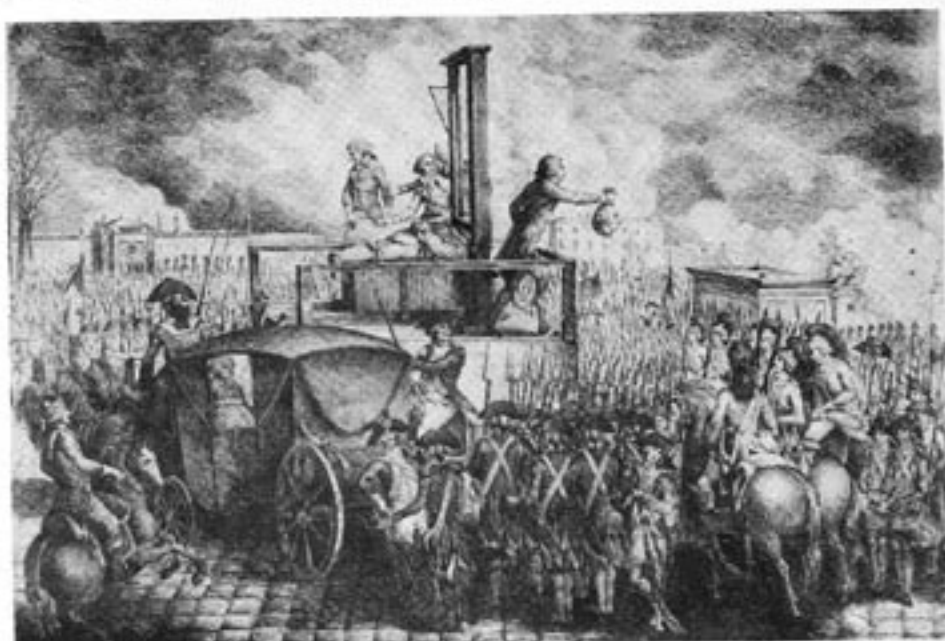
Edmund Burke kommenterade franska revolutionen — på omslagshilden på boken ett samtida kopparstick som visar Ludvig XVI:s avrättning. Men boken har relevans än idag, exempelvis när det gäller löntagarfondsdebatten.

förvirrad rörelse känns, som hotar med en allmän jordbävning i den politiska världen. Redan formas lösa grupper och klubbar av det mest osedvanliga slag i flera länder. I en sådan tingens ordning bör vi själva vara på vår vakt. I alla förändringar (om vi måste ha förändringar) gäller den omständigheten, vilken kommer att bäst tjäna att avtrubba skärpan i deras nackdelar och främja det som kan vara gott i dem, nämligen att den skall finna oss med våra sinnen fasthållande vid rättvisan och mån om egendom.