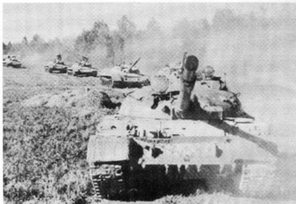
Sovjetiska stridsvagnar av modell T-62 utgör en av grundkomponenterna i Sovjets offensiva styrkor — till en del baserade i Estland. En annan del utgörs av flyget — omslagsbilden visar flygbasen utanför Estlands näst största stad, Tartu.

Som redan nämnts finns i Kopli, alldeles vid stranden, truppstyrkor. Ett femtiotal man tillhör idrottskompaniet, seglare och roddare i flottan. Man övar vid seglarklubben i Piritas och till de övriga sedvanliga övningarna och till tävlingar kommenderas styrkan till Svarta havet. Till denna styrka hör också andra soldater, och sammanlagt är de fem gånger så många som idrottsoldaterna. De