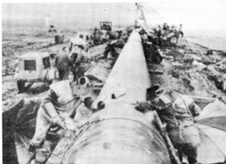
Sovjetisk gasledning — av västtysk tillverkning.

Under mer än 50 år har besvikna, lurade och förtvivlade kommunistiska avhoppare i bokform inför världen avslöjat den systematiska ondskan i det kommunistiska systemet, vilket numera spritt sig över en mycket stor