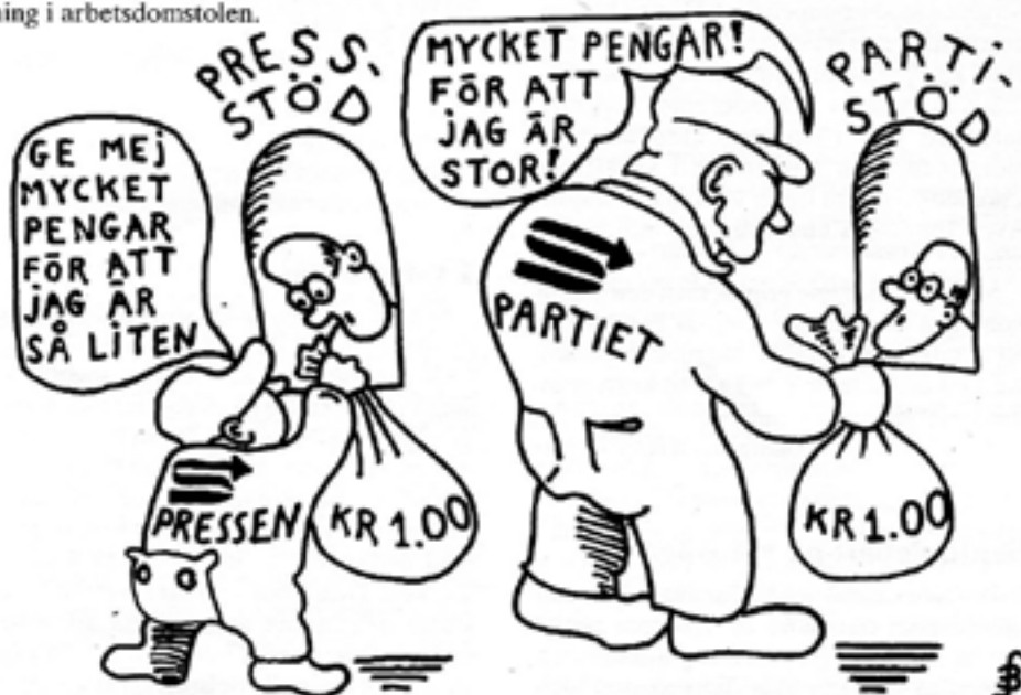
Partistödet ger mest till de största partierna, presstödet mest till de minsta tidningarna. Genialt uttänkt av socialdemokraterna som införde systemet.

Domen är inte minst anmärkningsvärd eftersom det i en proposition som antogs av riksdagen nyligen heter att ungdom som genomgår företagsförlagd utbildning inte ska räknas som anställda.