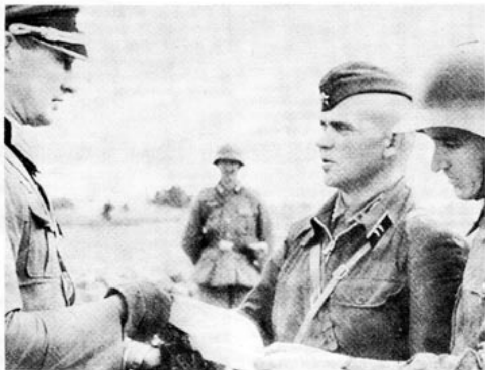
Ockupationen av Polen i september 1939 var ett exempel på samarbete mellan nationalsocialister och socialister-kommunister med annan etikett. Bilden visar tyska och sovjetiska soldater i samspråk i Polen 1939.