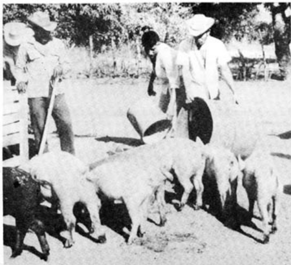
Ett svinuppfödningprojekt i El Salvador, finansierat med medel från AIFLD.

anhängare som är dominerande i den lokala administrationen. Detta har gjort att jordreformen har stoppats. Det är i första hand i dessa delar av landet som vänsterguerrillan vunnit något stöd.