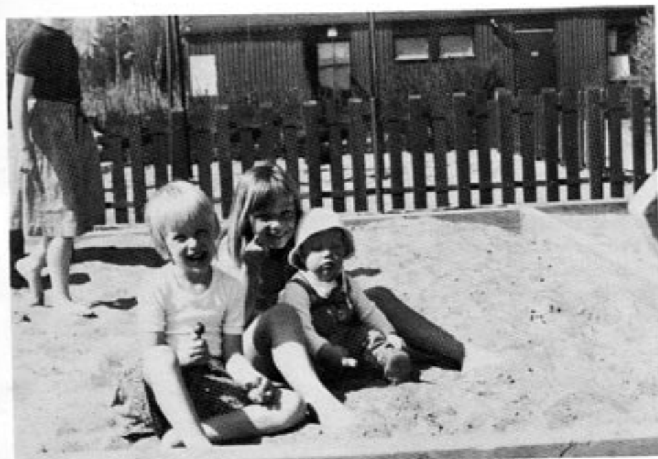
Skall barnen vara hemma hos mamma eller på dagis?

är den plattform, från vilken en socialistisk familjepolitik och ett socialistiskt samhälle skall nås! (Märk väl — ej ett demokratiskt samhälle!)