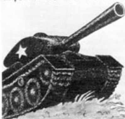
Så här ser den nya Contra-boken ut.