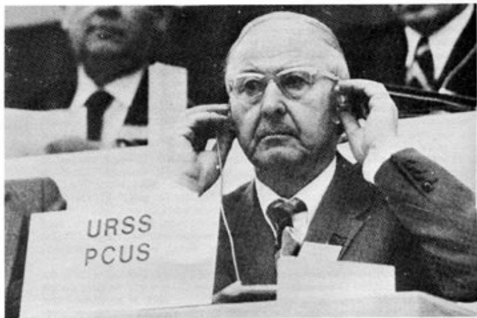
Sovjetiska kommunistpartiets chef för förbindelser med utländska kommunistpartier i icke-kommunistiska länder, Boris Ponomarev.

— Philip Agee är en avhoppare från CIA och en landsförrädare. De saker han arbetar för sammanfaller nära med de kampanjer som satts igång av Internationella Informations-