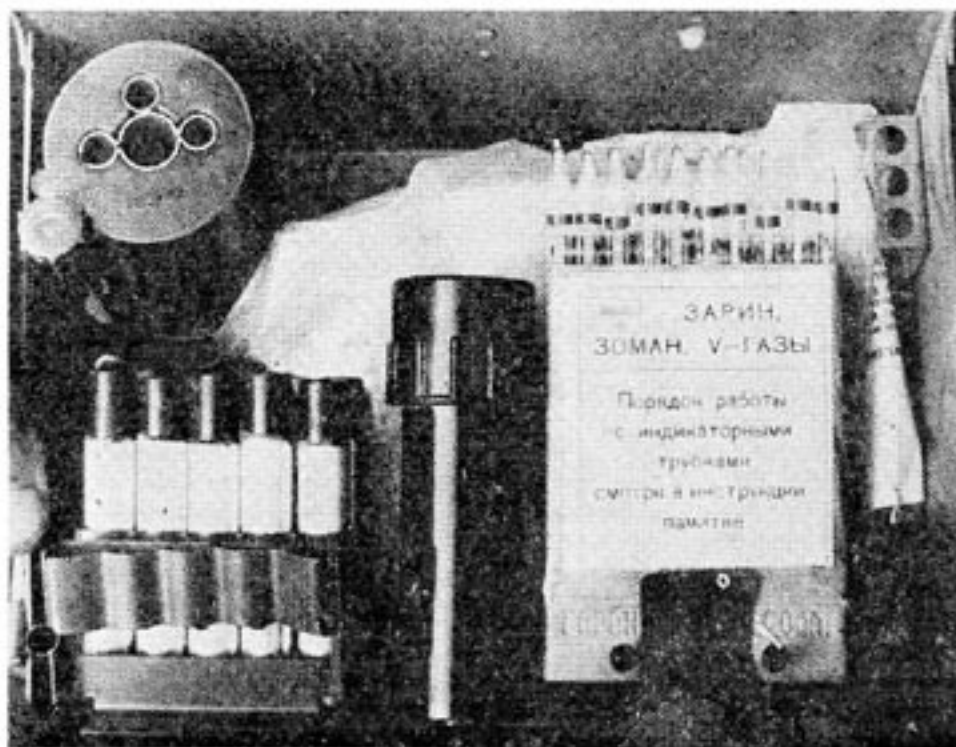
Den afghanska guerillan har erövrat sovjetisk utrustning att användas i kemisk krigföring. Den här satsen innehåller motmedel mot giftgas.