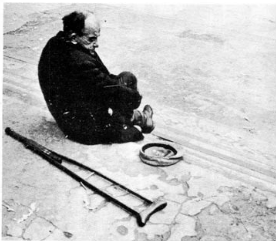
De som står utanför eliten lever ett helt annat liv. Den som är utan arbete klassas som "parasit".

diktatur," men det blev en diktatur över proletariatet och över hela det ryska folket.