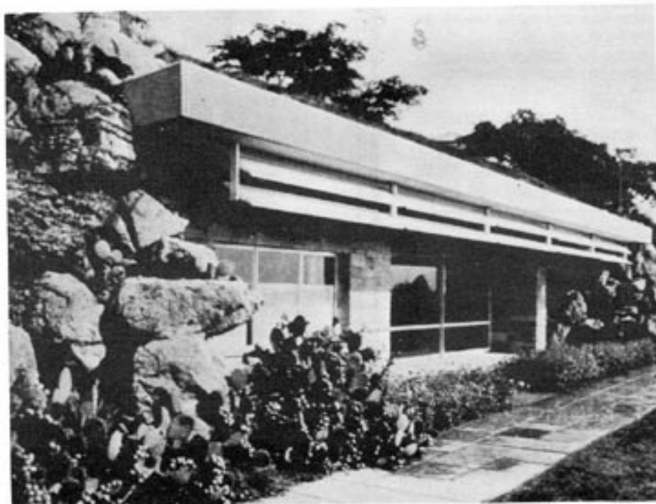
Nomenklatura, eliten har allt. Här Brezjnevs personliga datja, sommarställe.

Ursprunget till denna klass var Lenins lilla grupp yrkesrevolutionärer som med oktoberrevolutionen grep makten och sedan behöll den i en kamp utan alla hänsyn. "Yrkesrevolutionärerna blev yrkeshärskare," som författaren säger. De kallade sin regim "proletariatets