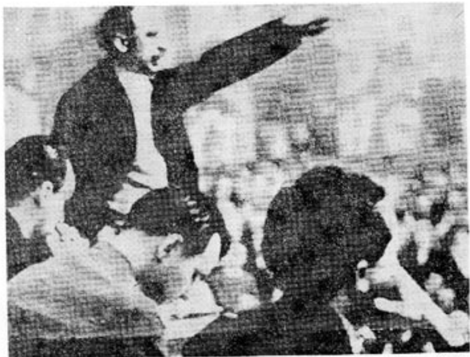
Walter Ulbricht och Joseph Goebbels under en gemensam demonstration i Berlin. (Ulbricht är den stående).

Hösten 1923 måste så Moskva uppge sina länge närda förhoppningar om en revolutionär seger i Tyskland. En väpnad omvälvning i