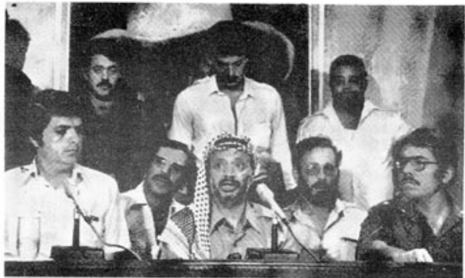
Sandinistledarna tillsammans med Yassir Arafat från PLO. Nicaragua har diplomatiska förbindelser med PLO!