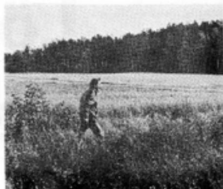
Palme efter valkampanjen 1979.