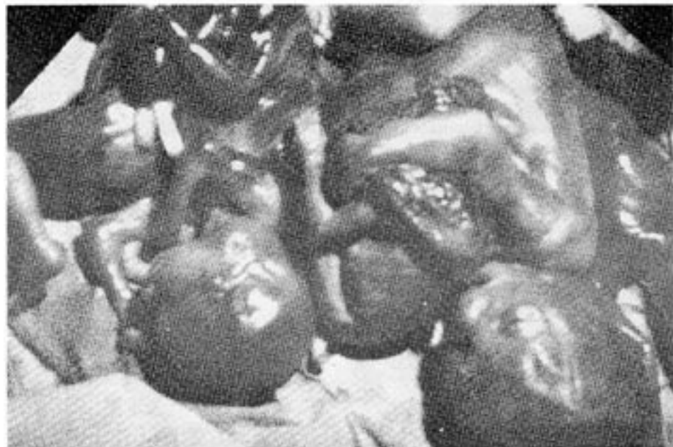
Aborterade foster. 13-18 veckor gamla