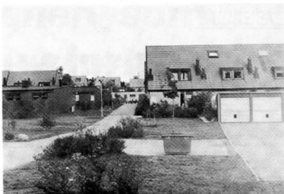
Under en kort tid har det byggts enfamiljshus. Den här bilden är från Täby, där vill politikerna nu återgå till florfamiljshusen.

Härtill kom den mäktiga påtryckningen från bl a alla inom byggnadsproduktionen. En VD i ett av våra största byggnadsföretag