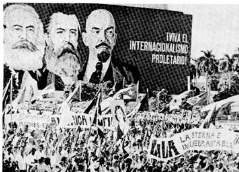
Förstamajdemonstrationen i Managua 1980.

Detta har naturligtvis medfört att ländernas ekonomier hamnat i en närmast kaotisk situation. Nicaraguas försök att införa socialism gör naturligtvis inte saken lättare. Produktionen i Nicaragua sjönk 1979 med 25%, vilket inte är att förvånas över. Vad som är förvånansvärt är emellertid att det nästan inte alls skedde någon återhämtning 1980. Inflationen rasar f n på en nivå mellan 35 och 40 %.