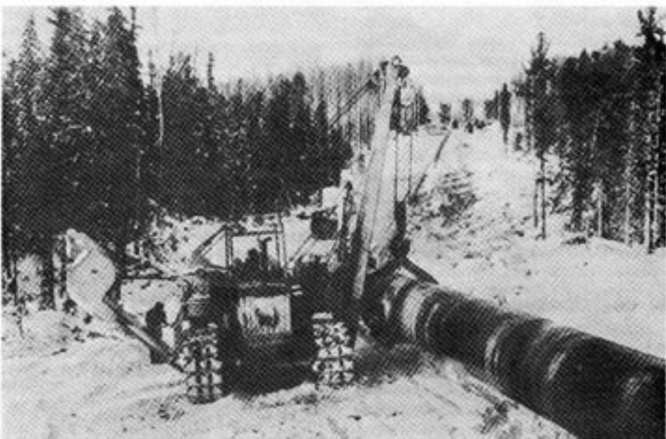
Såväl västerländsk teknologi, som inte minst västerländska krediter, har haft stor betydelse för uppbyggnaden av Sovjets infrastruktur. Rörledningar för olja och naturgas har byggts med hjälp från bland annat Västtyskland, Japan och Sverige (Gränges Hedlund). Krediterna uppgår idag för de värst skuldsatta östlänarna (Polen) till mer än en årsexport till Väst.

Enligt de senaste beräkningarna, som gjorts av FN:s ekonomiska europakommission, ECE, har skuldbördan ökat ytterligare. Samtidigt har exporten till väst minskat. Den samlade skulden till Väst skulle därmed med nästan 50% överstiga ett års export.