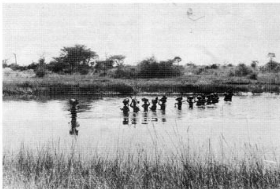
En trupp från UNITA på uppdrag.