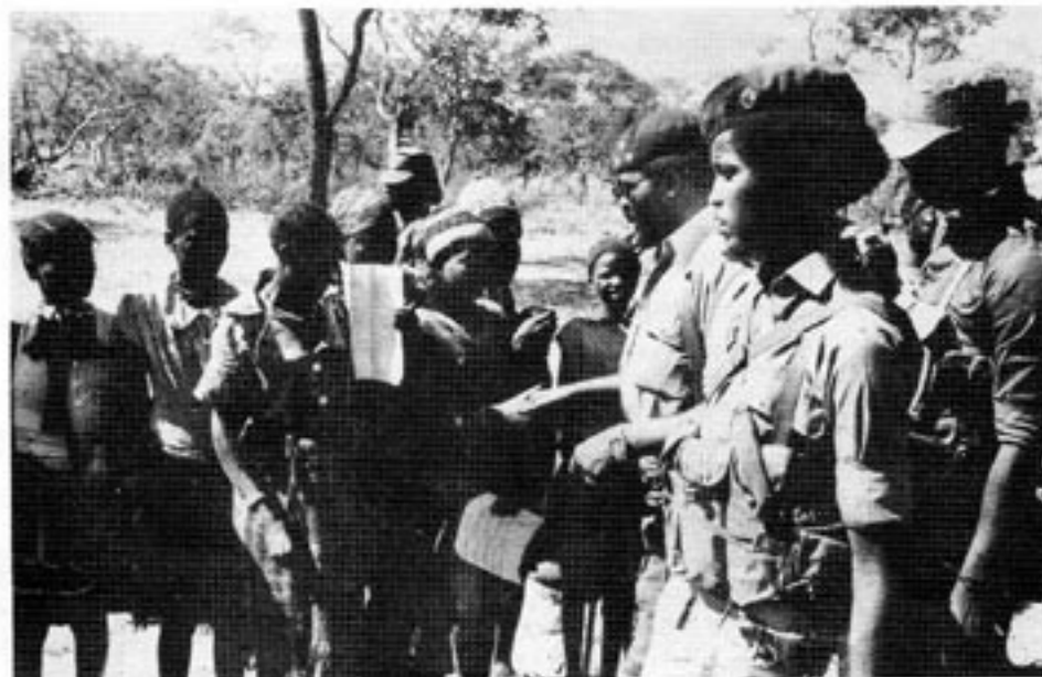
UNITA-ledaren Jonas Savimbi — med baskern — i samspråk med sina landsmän. UNITA bekämpar effektivt den kommunistiska regimen i Angola och kontrollerar betydande delar av södra Angola. Den strategiskt viktiga Benguela-järnvägen har inte kunnat öppnas sedan Angola blev självständigt, på grund av UNITA:s insatser.