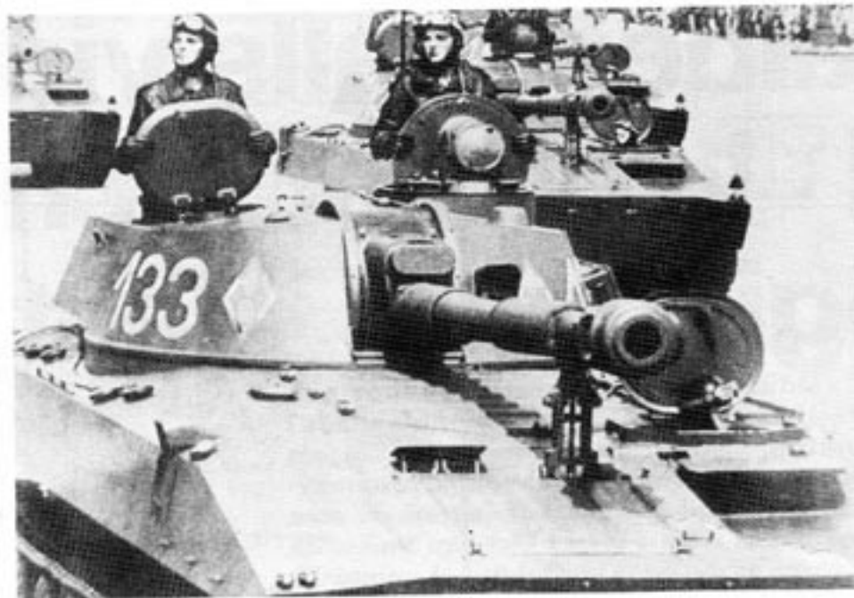
Många sovjetiska vapen möjliggörs av västerländsk teknologi. Exempelvis precisionskullager, där modellerna ibland hämtas från Sverige. På bilden en amfibisk 12,2 cm handhaubits av sovjetisk modell.

Den nordkoreanska arméns lastbilar kom från fabriken i Gorkij, som byggts av Henry Ford. De nordkoreanska Jak-planen kom från en fabrik som levererats efter en överenskommelse mellan Roosevelt och Stalin.