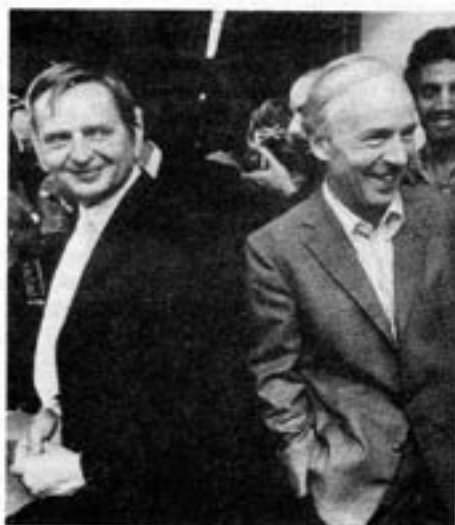
Palme har flirtat med kommunister förr.

ning som är så modern att dess motsvarighet inte finns i något kommersiellt företag i Sverige. Det är en högautomatiserad fabrik för köks-snickerier. Kraven på arbetskraften är så höga vad gäller yrkesutbildning och yrkesvana, att det bedöms som uteslutet att någon vanlig handikappad över huvud taget skall bli anställd. Alla anställda beräknas vara "geografiskt handikappade."