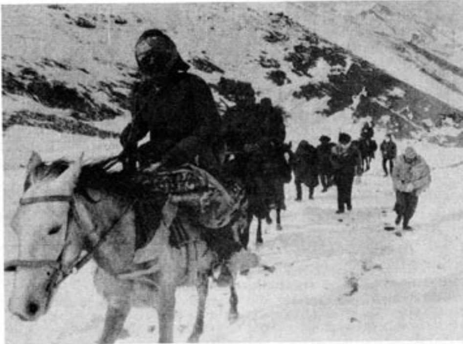
Primitiva transportmetoder används i kampen mot de ryska ockupationstrupperna. Men de är effektiva i den terräng som finns i Afghanistans bergstrakter.

bar sina tillhörigheter på ryggen, och sakta gick mot Pakistan.