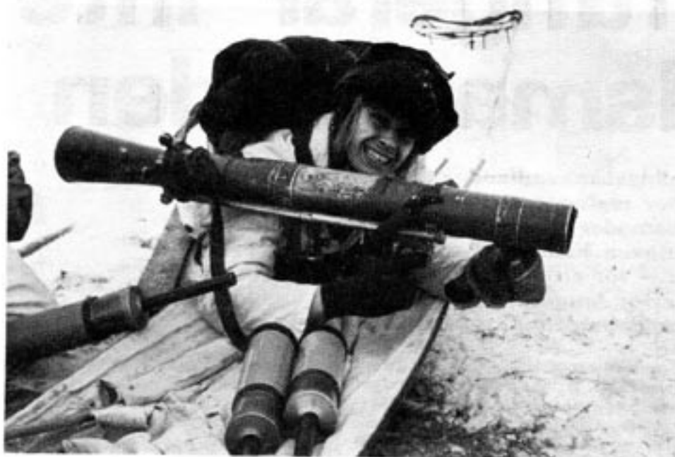
Det är inte det konventionella försvaret eller kärnvapenförsvaret som behöver stärkas i första hand, det är det ideologiska försvaret, menade framtidsforskaren Herman Kahn under ett seminarium där artikelförfattaren deltog.