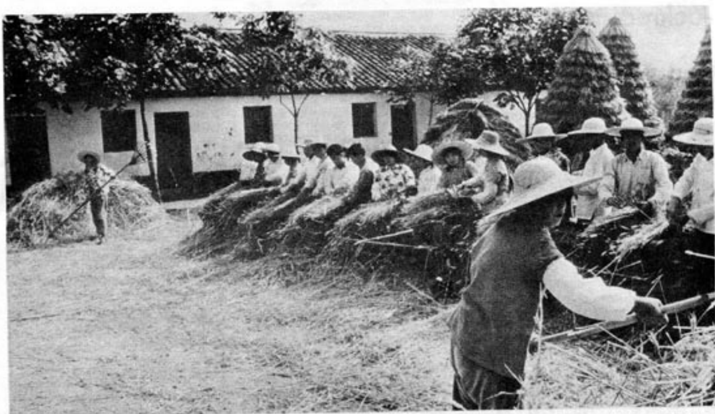
Löneskillnaderna mellan landsbygden och städerna är mycket stora. Men även inom jordbrukssektorn är skillnaderna betydligt större än vad vi vant oss vid i Väst. Mellan två olika jordbruk kan lönerna vara olika i relationen 1:3, med ännu större skillnader inom gruppen.

tjänade strax över 100 yuan per månad. Det innebar en lönedifferentiering mellan arbetarna i storleksordningen 1:3. Ingenjörer och tekniker vid samma fabrik tjänade för övrigt mellan 130 och 140 yuan per månad.