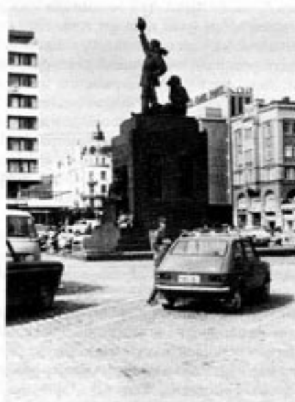
Monument över frihetskriget i Vasa.

Författaren till boken Finlands linje , Paavo Haavikko, är inte historiker av facket, vilket ofta lyser igenom i framställningen. Detta hindrar dock inte att han relativt ofta gör iakttagelser och drar slutsatser, som säkerligen är helt korrekta.