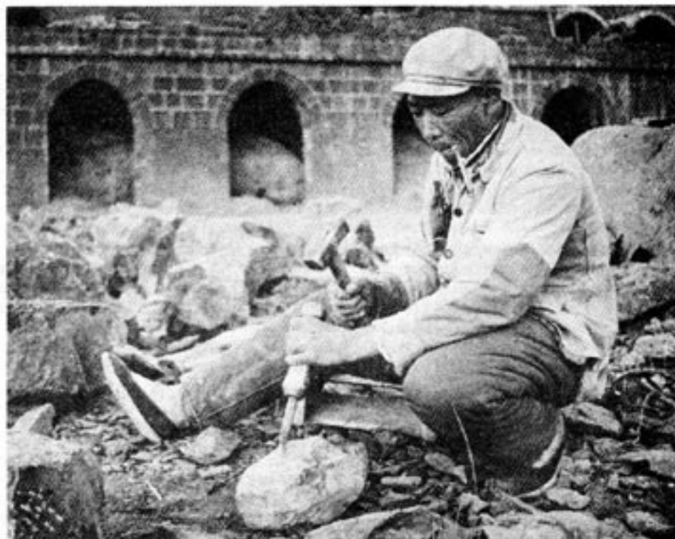
De nya ledarna i Kina talar om de "fyra moderniseringarna" — inom jordbruk, försvar, industri och vetenskap. Oppositionen — med Wei Jong-shen som ledande namn — kräver en femte modernisering: demokrati.

skulle medborgarna inte veta vad de fick säga eller inte säga och det skulle hindra fredlig kommunikation mellan det kinesiska folket och andra folk. Dessutom skulle det göra rättsapparaten utan regler. Detta skulle inte vara gynnsamt vare sig för staten eller för folket.