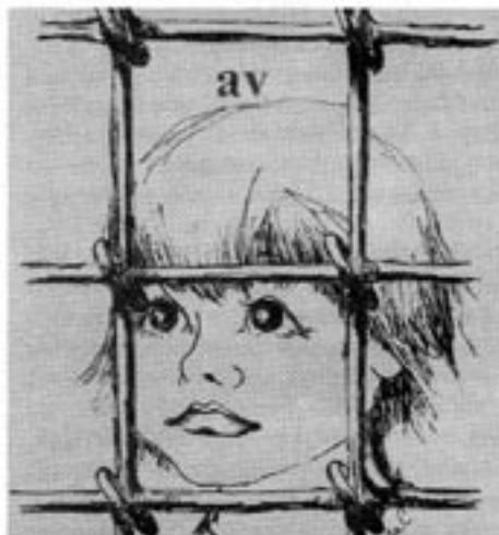
Omslag till Förstalligandet av våra barn . Kan beställas från Contra.