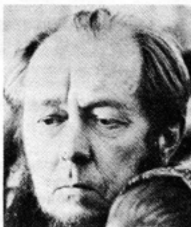
Stoppad av censuren.

Makthavarna själva måste däremot känna till vad som händer i landet. Det finns därför olika grader av information och desinformation. Graderna följer det privilegiesystem som genomsyrar alla sidor av det sovjetiska samhället. Partimedlemmarna kan få tillgång till mer "förtrolig" information än icke-partimedlemmar. På olika nivåer i hierarkin förekommer speciella föredragningar, särskilda informationsbuletiner, särskilda tidningar med liten upplaga — ända upp till "vita Tass." Vita Tass är helt ozensurerade rapporter om händelserna ute i världen, som varje dag tillställs de allra högsta topparna inom partiet,