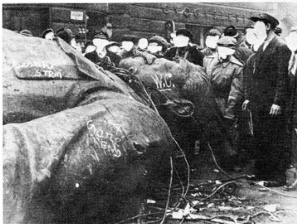
Stalinstatyn har fallit — diverse nedsättande ord har skrivits på statyn.

En landsomfattande opinionsundersökning som gjorts av organisationen Sveriges Förenade Elever visar att 73% av eleverna vill ha skriftliga betyg i skolan. 15% vill inte ha betyg och 12% har ingen åsikt. Undersökningen omfattade drygt 2.000 elever.