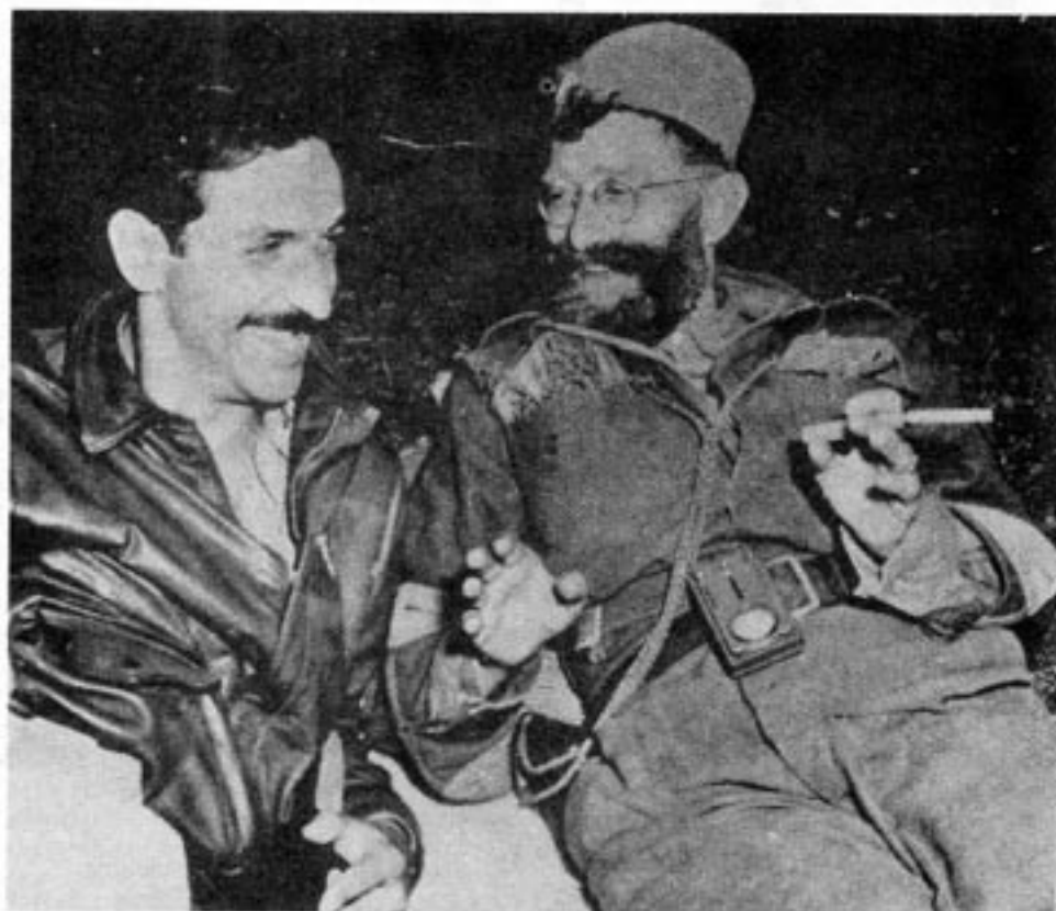
General Draga Mihajlovic (t.h.) efter en hård nattlig marsch 1944.