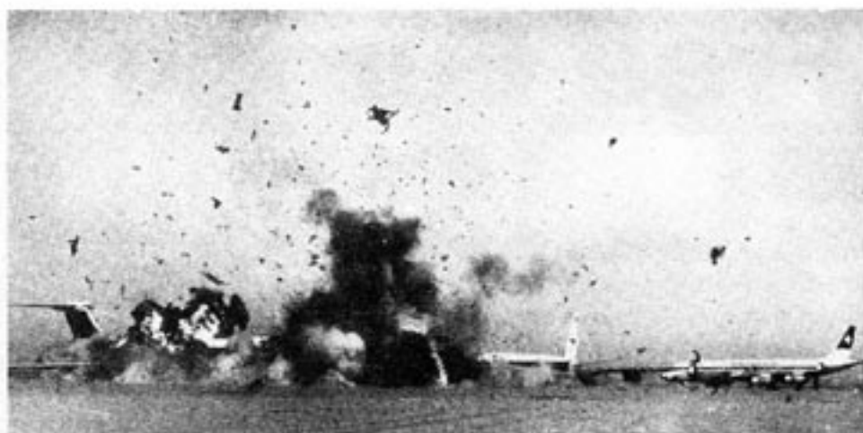
Den internationella terrorismen — föredöme för dagens bombattentat.

som i förra förbundsdagsvalet fick 0,3% av rösterna, alltså i samma storleksordning som svenska SKP. (Vi har inte siffrorna från 1980 års val tillgängliga, men de var sannolikt betydligt lägre). Trots NPD:s obetydligt röstmässigt svarar partiet för större delen av alla organiserade högerextremister enligt Verfassungsschutzbericht . För cirka 15.000 av sammanlagt drygt 17.000 högerextremister. Av de 83 högerextremistiska grupper som finns förtecknade i Verfassungsschutzbericht hade 71 mindre än 100 medlemmar. Bland de 8 som hade fler fanns förutom NPD även Wehrsportgruppe med uppskattningsvis 400 medlemmar.