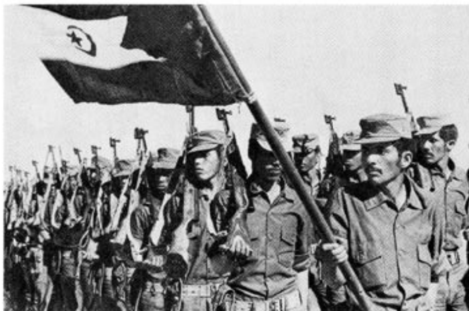
POLISARIO, den kommunistiska rörelse som försöker erövra Väst-Sahara.

Varför kan nu inte kung Hassan II av Marocko låta POLISARIO bilda en egen stat? Detta skulle innebära att Marocko skulle få en fientlig östorienterad granne inte bara i öster (Algeriet) utan också i söder. Enligt Marocko skulle det inte dröja länge innan en strid började även i Marocko, efter känt mönster från "befrielseörelser" understödda utifrån. Då skulle Marockos västorienterade