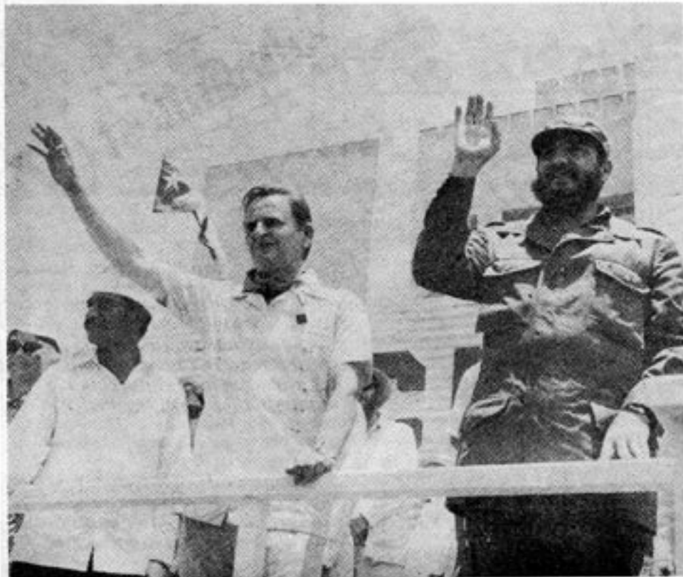
En av de socialisterna som begejstrats av Castros Kuba. Författaren till Kuba — misstänksamhetens ö var också inledningsvis begejstrad av Kuba. Men hänförelsen gick över efter några år i Kubas fångelsehålor.

Väl tillbaka till Frankrike ville han gärna leva med och i "revolution" på Kuba. Han försökte på alla sätt få bosätta sig på Kuba.