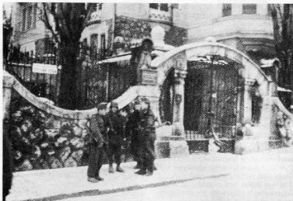
Pilkorsare på vakt utanför svenska ambassaden.

Hela ambassadpersonalen tvangs lämna Budapest, dock utan Wallenberg, som var försvunnen. Resan till Sverige gick över Moskva. I Moskva mötte beskickningschefen