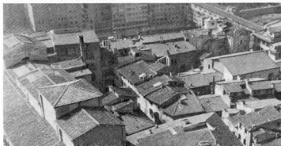
(Husen på bilden har inget samband med artikeln)