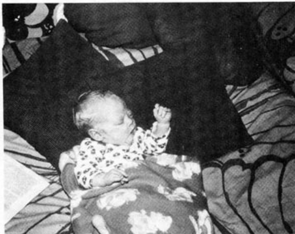
Könskillnader i spädbarns beteende kan observeras redan på tre veckor gamla barn. Sannolikt finns skillnaderna redan på fosterstadiet.

könsrollskämpar tror? Svaret är nej. Mannen och kvinnan har olika hormonuppsättningar och dessa påverkar oss mycket starkt både fysiskt och psykiskt. Vi vet t.ex. med säkerhet att det kvinnliga hormonet progesteron kommer in i hjärnan och påverkar hjärnfunktionen. Det är alltså de skilda hormonspektra som gör mannen till man och kvinnan till kvinna, trots att båda könen i allt väsentligt har samma arvsanlag, samma genbestånd.