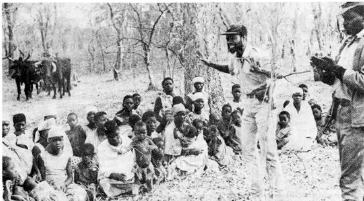
Så här såg det ut när Mozambiques nuvarande president Samora Machel drev krig mot portugiserna. Nu startar kampen mot Machels kommunistdiktatur. Basen utgörs av tidigare FRELIMO-styrkor.