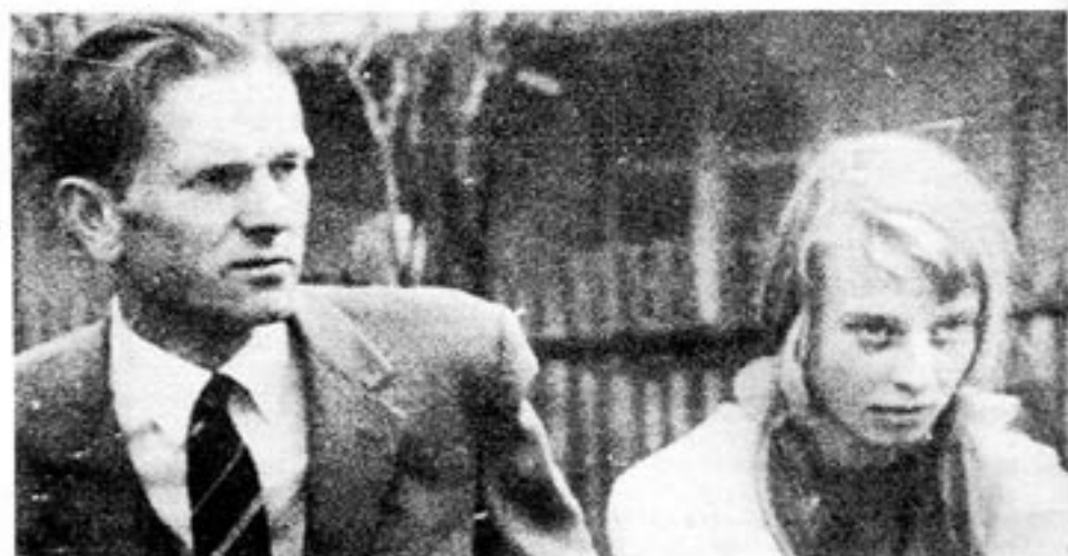
Den östtyske protestantiske prästen Oskar Bruswitz (på bilden tillsammans med sin dotter Dorothea) brände sig under förra året till döds i protest mot den östtyska regimens politik mot kyrkan och dess brott mot de mänskliga rättigheterna.