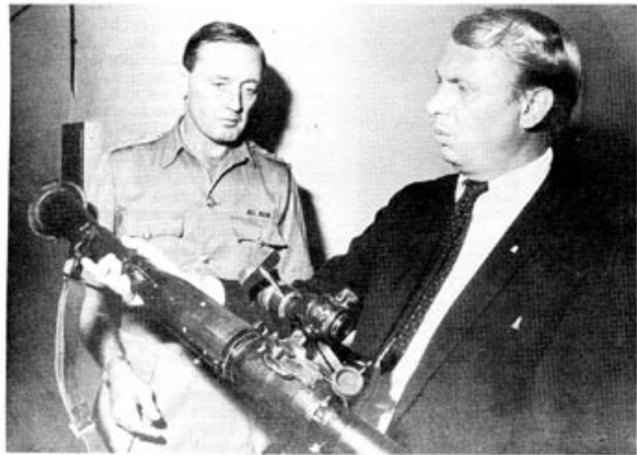
Artikelförfattaren studerar rhodesiska krigsmaktens beväpning

rhodesiskt pass, använder man sig av det gamla för att över huvud taget kunna besöka sin släkt i England, eller för att ta sig till Europa. Och när Gerlach nämner att 10.000 lämnat landet under ett år glödde han att tala om att under 1975 (då 10.500 lämnade landet) flyttade samtidigt 12.425 in. Ett nettotillskott på nästan 2.000 personer.