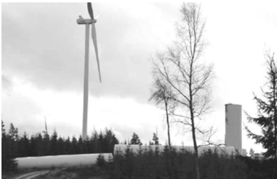
På julafton 2015 rasade ett vindkraftverk i Lemnhult i Småland över en skogsväg.

kraftverket varnade för att delar av det kunde rasa samman. Det fanns dessutom mycket olja inuti kraftverket som kunde rinna ner längs tornets insida. 11