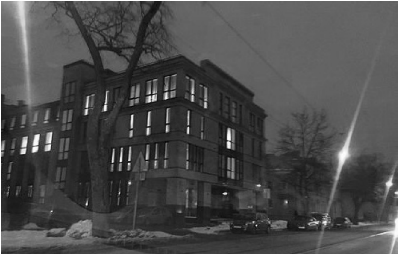
Den ryska trollfabriken på Savusjkinagatan 55 i Sankt Petersburg. Härifrån sköts Putins informationskrig mot Väst, dygnet runt, året runt. Målet är att underminera tilltron till samhällsinstitutioner och media i Väst.

Det finns ingen anledning att världens största diktatur ska styra vårt handlande. Till och med i Norge ser det ut som om kineserna har inflytande. När demonstranter utanför Stortinget protesterade mot ett kinesiskt besök blev de överröstade av norsk-kinesiska organisationer som ingen hört talas om tidigare. En gul T-shirt med texten "Frihet" var för mycket för att tillåtas i Stortingsbyggnaden. Taiwan har representationskontor i Danmark och Sverige, men kontoret i Oslo är nedlagt. Nils Tore Gjerde