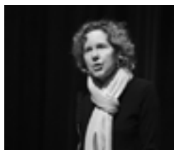
Heather Mac Donald