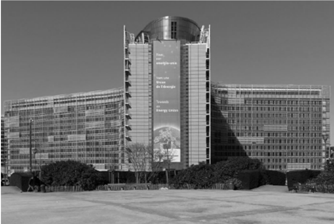
Berlaymont, EUs högkvarter i Bryssel.

komma att påverka eller styra mängder av policy-områden. Medan frihet att självständigt bestämma kommer att finnas gällande vissa områden, kommer en gemensam EU-politik att bestämma politiken på många andra – och naturligtvis viktigare – områden. Sverige blir tvunget att genomföra åtgärder vi aldrig skulle beslutat oss för annars. Vi kommer helt enkelt förvandlas till en liten nummerregion i Europa med en sådans begränsade rätt att bestämma över skattepengar och offentliga program. Och kravet på likformighet i politiken kommer säkert att skärpas successivt.