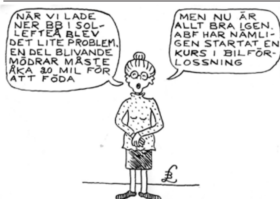
I landstingsvalet 2018 i Sollefteå gick S från 48 till 14 procent!

En studie av experimentet vid Otago University drog slutsatsen att när eleverna fick chansen att leka kreativa lekar gjorde de det istället för att mobba sina skolkamrater. ( Reason magazine )