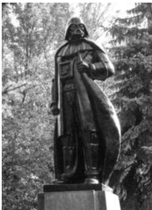
Darth Vader, tidigare Lenin, som staty i den ukrainska hamnstaden Odessa.

Inom Demokraterna i USA växer spänningen mellan de ”demokratiska socialisterna” och de mer traditionella demokraterna. Bernie Sanders, som var den interna motkandidaten till Hillary Clinton, har en ledande ställning inom partiet. Han kallar sig socialist och när han för drygt 30 år sedan reste på bröllopsresa valde han att göra det till Sovjetunionen. I en intervju förra året kommenterade han Sovjetunionen: ”Russia was an incredible place back then, before the billionaires ruined everything.”