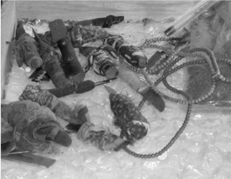
Knivar som använts vid könsstympning i Östafrika.

soner som idag begriper vad som krävs för att bekämpa grova könsstympningar av småflickor. Det är lätt att kräva lagstiftning. Det är svårare att kräva att poliser och andra får exakt de verktyg och befogenheter som de faktiskt behöver.