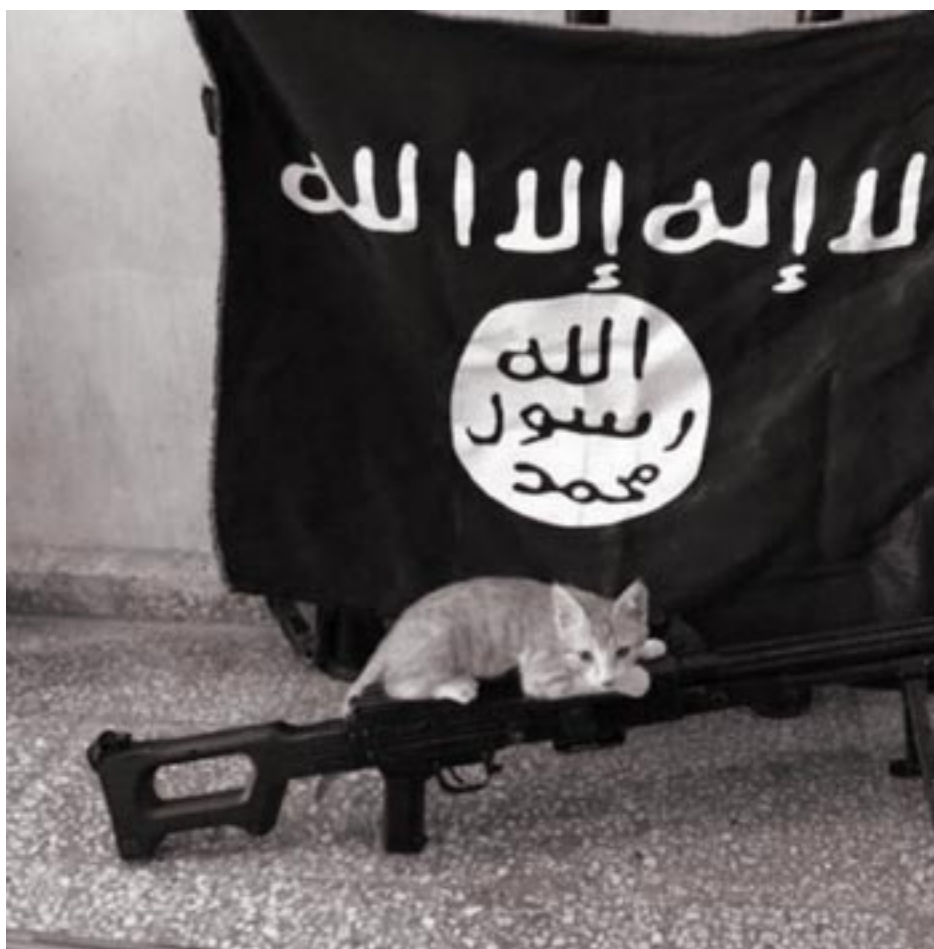
En islamist från Gävle skickade hem den här bilden från Syrien genom sin hemsida

och ser till att David Cameron kommer krypande på alla fyra för att betala oss jizya [en specialskatt som enligt Koranen ska belasta alla icke-muslimer] och täcker alla kvinnor med niqab, inklusive drottning Elizabeth och horan Kate Middleton”.