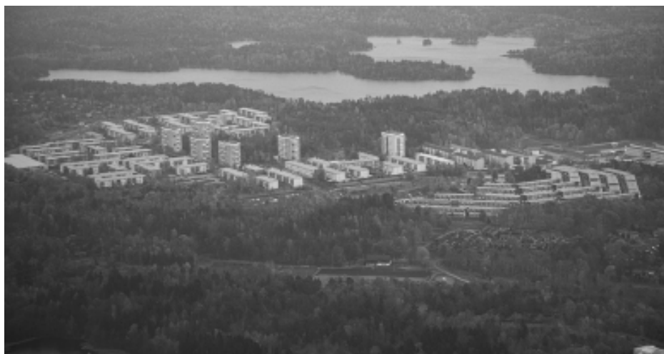
Lövgärdet, ett särskilt utsatt utanförskapsområde i Angered/Göteborg.

I alla de här områdena har staten och kommunerna satsat pengar för att öka valdeltagandet. Det har lyckats, valdeltagandet i landet ökade med en dryg procentenhet, i utanförskapsområdena ökade valdeltagandet med 3–5 procentenheter. I många fall handlar det om personer med mycket grunda insikter i svensk politik och kanske helt obefintliga kunskaper i