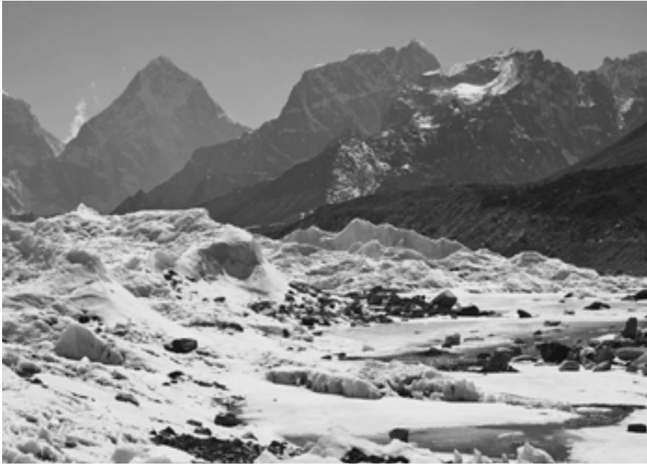
Glaciärerna i Himalaya finns kvar, trots påståenden att de skulle vara försvunna vid det här laget...