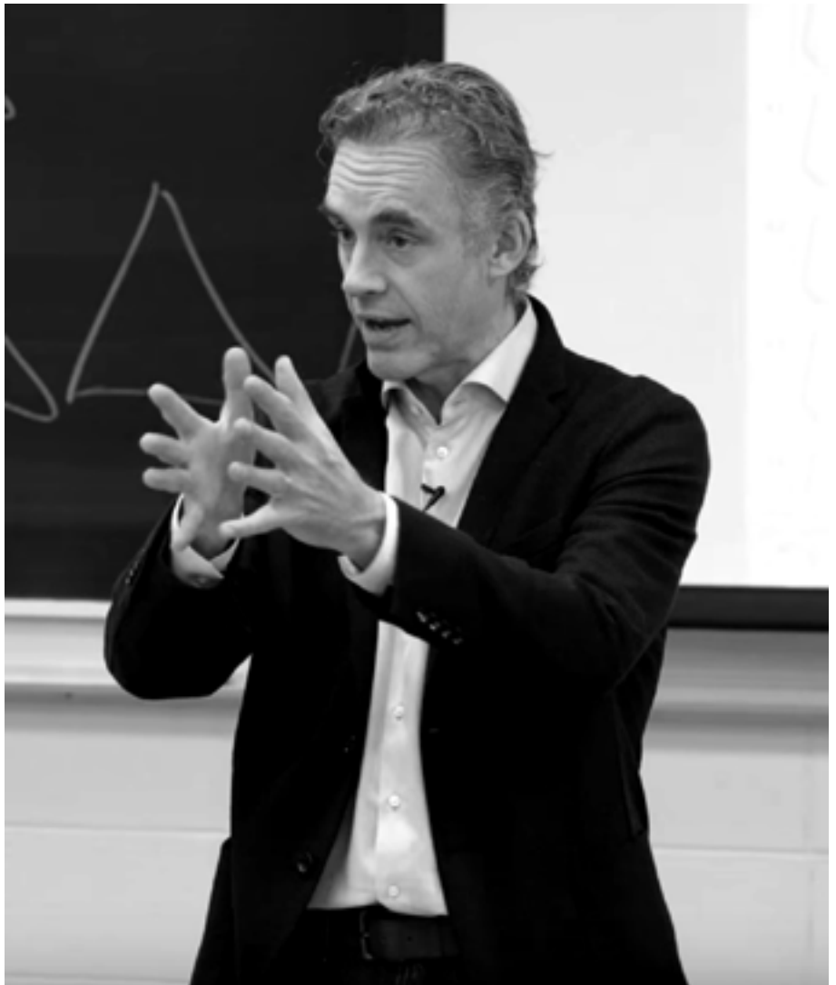
Jordan B. Peterson under en föreläsning vid University of Toronto.

En annan högaktuell fråga där Peterson intar en icke-korrekt ståndpunkt är klimatfrågan. Han har uttalat sig skeptiskt om klimatmodellerna och säger att de inte går att lita på eftersom de är alltför komplexa och ideologiskt styrda.