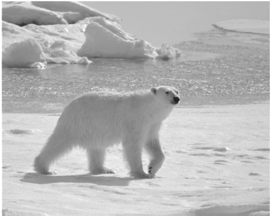
Isbjörnarna i Arktis mår bra och blir fler. Snart nås rekordmånga isbjörnar. Bara i ett av femton områden som forskarna mäter minskar antalet isbjörnar.

Idag finns motsvarigheten till istidens istäcken på Antarktis och Grönland. Enligt anhängarna av teorin om ett varmare klimat skulle isen på Antarktis smälta undan och göra kontinenten till det enda beboeliga området på jorden. Resten av jorden skulle bli alltför varm. Men så har det inte blivit. Under cirka trettio år har det varit möjligt att mäta isens utsträckning med hjälp av satellit. Inledningsvis minskade istäcket, men efter 1999 ökade istäcket för att nå ett maximum 2014 (2015/2016 härska det speciella väderfenomenet