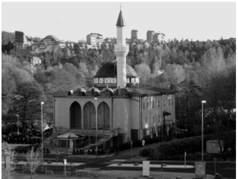
Moskén i Fittja.