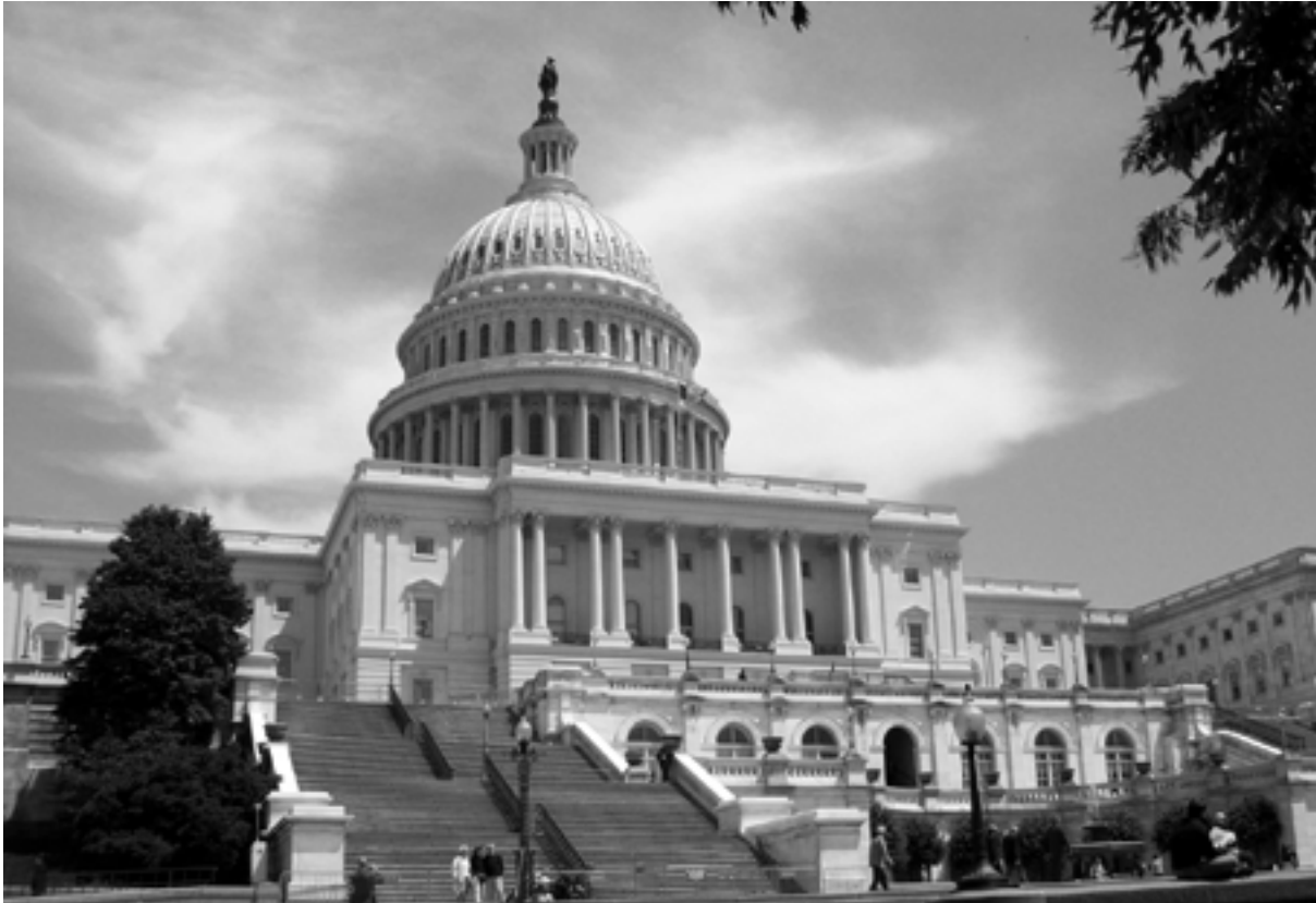
Capitoleum i Washington, den amerikanska Kongressens säte.

att utföra handarbete...” De kvinnorna var också fångar.