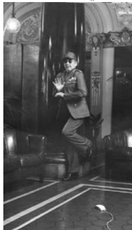
Rädd för ”musen” – en affisch med Kubas president Raúl Castro publicerad av Internationale Gesellschaft für Menschenrechte.