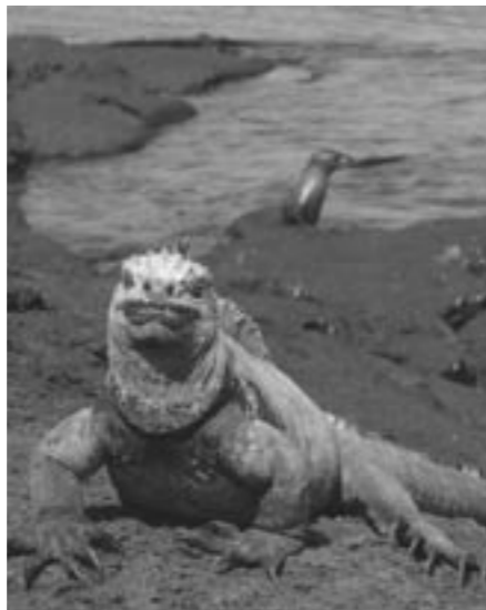
Det säregna djurlivet på Galapagos-öarna påverkade Darwins tänkande. Här en leguan.