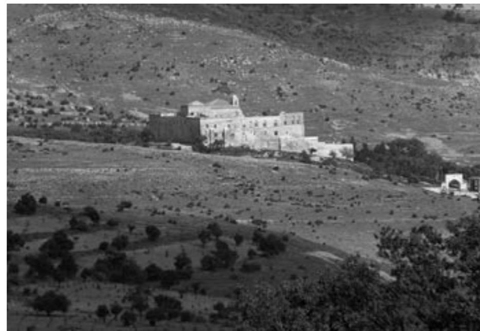
Klostren i Tur Abdin i sydöstra Turkiet grundades år 493 (Mor Hananyo på bilden) och för Mor Gabriel redan 397. Klostrens undervisning i arameiska (det språk som Jesus talade) är ett hot mot den turkiska statens identitet.

Gabriel, Mor Hananyo och Deirulzafaran. Vad beträffar klostret Mor Gabriel försöker islamister hävda att klostret inte har korrekta dokument och de försöker att ta över klostrets mark, trots att klostret existerat på platsen redan år 397, 200 år före profeten