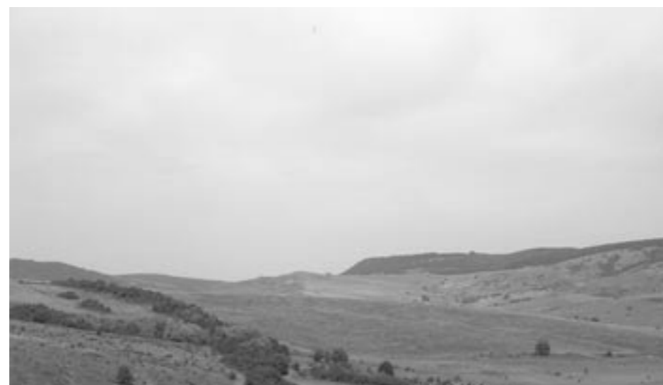
Jordbruksmark ligger obrukad. Ungrare och tyskar lämnar landet. Zigenare som tar över de utflyttandes bostäder är inte intresserade av annat än de små trädgårdsodlingarna. Förr odlades här humle i stor skala, nu odlas ingenting (utsikt från kyrktornet i Weißkirch i Transsylvanien)

österut som i Ukraina och Ryssland fanns det stora infödda tyska folkgrupper. Som nämnt jagades tyskarna iväg efter Andra världskrigets slut från stora områden. Men inte från alla länder. Rumänien var ett av undantagen. Under mellankrigstiden (1930) bodde det 745 000 tyskar i Rumänien, som inkluderade Transsylvanien som rumänerna erövrade från ungrarna i slutet av Första världskriget. Under Andra världskriget var Rumänien inledningsvis allierat med Tyskland, men mot krigets slut slöt Rumänien fred med Sovjet och Röda armén marscherade in. 100 000 tyskar flydde västerut och 80 000 skickades av ryssarna till Sibirien, som straff för att de samarbetat med rikstyskarna under kriget.