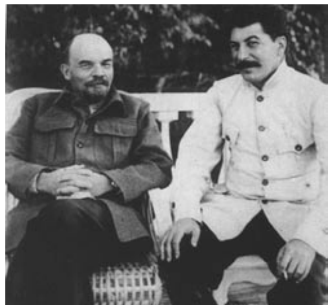
Sovjetterrorns förgrundsgestalter – V. I. Lenin (till vänster) och Josef Stalin. I Sovjetunionen föll minst 20 miljoner människor offer för kommunismen.

"Dessa avslöjanden är signifikativa av två huvudskäl. I första rummet tenderar de att underminera trovärdigheten hos dem som hånskrattar åt varje antydan om kommunistiskt spioneri eller subversion. Sanningen är att, långt innan dessa dokument såg ljuset, många forskare, underrättelsetjänstemän och exkommunister själva kände sanningen och försökte tala om denna för en värld som vägrade lyssna