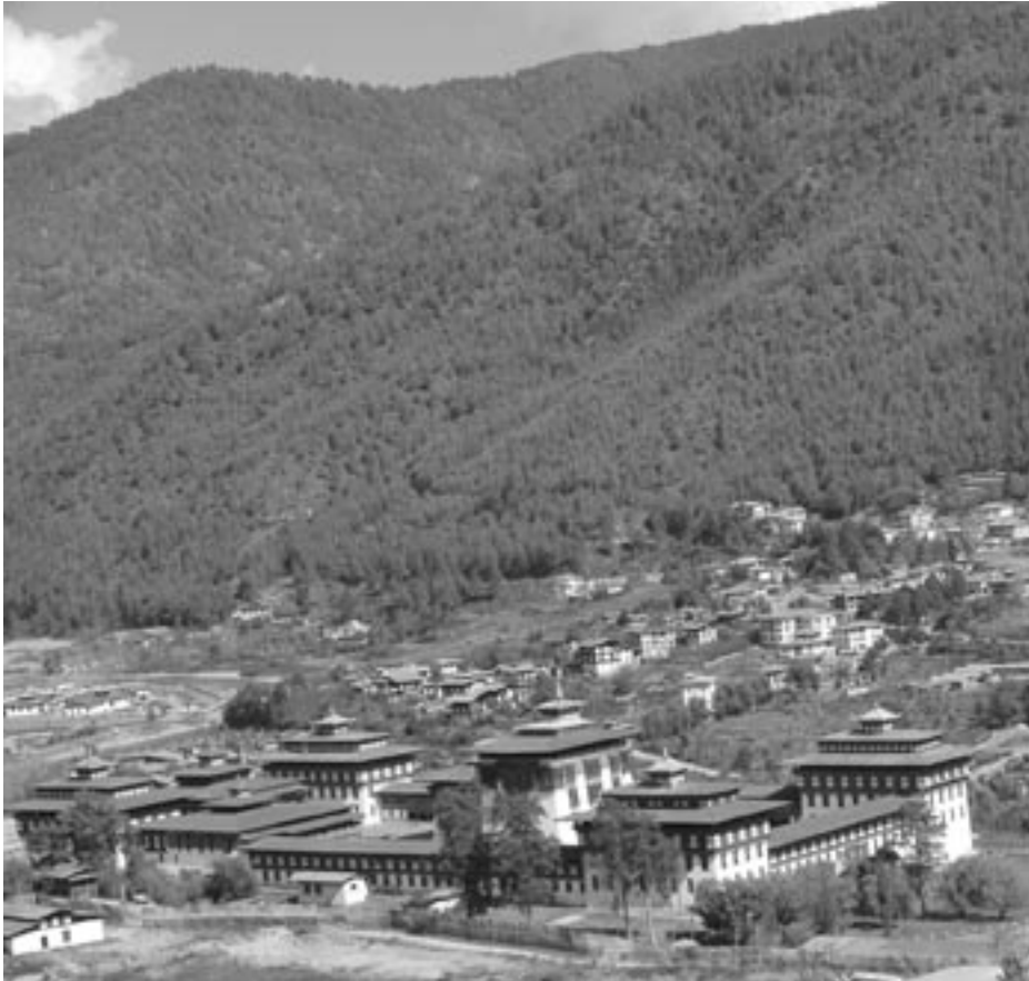
Regeringskansliet i Bhutans huvudstad Timphu är byggd i traditionell bhutanesisk stil och innehåller förutom kontorsutrymmen även ett buddhistiskt tenpel.

att det fanns en potentiell drog att plocka så gott som överallt. Brottslighet inspirerad av utländsk TV har också förekommit i ett land där stöld tidigare var nästan okänt. Än idag kan dock en obetydlig stöld bli huvudnyhet i den största engelskspråkiga nyhetstidningen som kommer en gång i veckan.