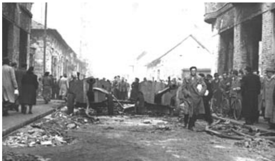
Kommunismens rätta ansikte framgick med all tydlighet vid det brutala nedslåendet av Ungernrevolten 1956. Fotot är taget i Budapest.

I New York Times den 23 augusti 1933 skrev Duranty: ”Matbristen vilken har påverkat nästan hela befolkningen förra