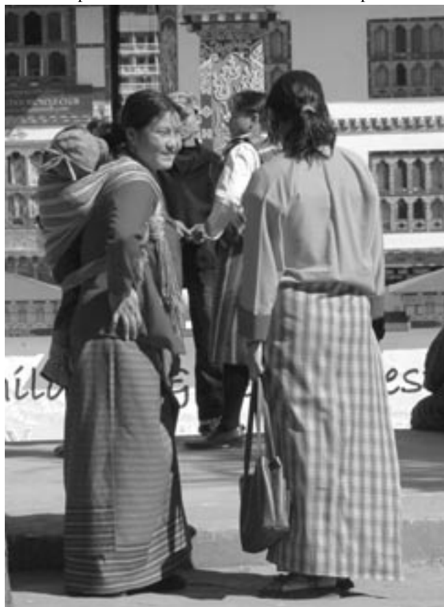
Kvinnor i traditionell bhutanesisk kira, en klädedräkt som påbjudits av kungen.

Bhutan är ett land som ligger avlägset, långt vid sidan av allfarvägen. Därför har man utan att störas av expansiva makter i omgivningen kunnat isolera sig och bygga upp ett samhälle som är unikt. Idag tränger sig utvecklingen i omvärlden på. Isolering är ingen väg framåt. Kungen har försiktigt försökt lotsa landet i riktning mot modernisering, med bevarande av dess kulturella särart. Med demokratiseringen kommer stora förändringar att ske, frågan är om landets speciella profil kommer att stå emot förändringstrycket.