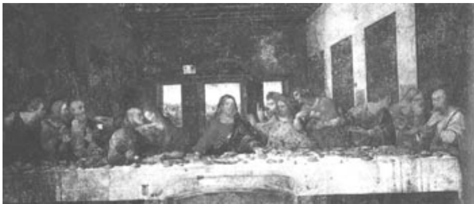
Lionardo da Vincis "Nattvarden" är ett av de främsta konstnärliga uttrycken för den kristna religionen.

"Kyrka blir moské" har man nyligen kunnat läsa i tidningsrubriker. Detta uppseende-väckande förvandlingsnummer är på gång i Gävle, där stadens metodistkyrka blir muslimernas egendom med hjälp av penningstöd från regeringen i Qatar. Det med demokrati helt oförenliga islam utnyttjar vår demokrati och vår religionsfrihet för att sprida sin lära. Detta är givetvis helt i sin ordning och ingenting att orda om. Vad man däremot kan ha synpunkter på är att Qatar, som satsar fem miljoner kronor på islams etablering i Gävle, inte tillåter kristen verksamhet inom det egna landets gränser. Det ligger onekligen nära till hands att tro, att islam inte tål att konfronteras med kristen mission.