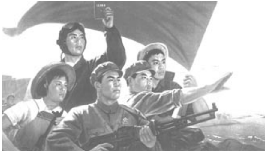
En kommunistkinesisk propagandaaffisch från 1960-talet. Piloten i bakgrunden viftar med "Maos lilla röda". I Kinna dödades enligt beräkningar i Kommunismens svarta bok mellan 45 och 72 miljoner människor.

När Hiss dog 1996 fortsatte många prominenta journalister och akademiker att betrakta honom som en hjälte. ABC-kanalens nyhetsankare Peter Jennings avslutade exempelvis sina översvallande kommentarer om Hiss med att rapportera, att Rysslands president Boris Jeltsin hade deklarerat, att ingenting i KGBs arkiv stämplade Hiss som en sovjetisk spionageagent. Den ryske presidenten gjorde naturligtvis inte något sådant uttalande. Mannen som sade att han inte hittat något om Hiss i sitt arkiv var general Dimitrij Volkogonov, som senare ändrade sig och medgav att han inte inspekterat den sovjetiska militärens arkiv; Chambers hade sagt att Hiss var i sold hos den sovjetiska militären. CNN citerade också, i slutet av sin rapport om Hiss död, Volkogonov för att visa att han rentvått Hiss från varje skuld.