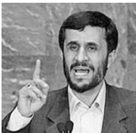
Vår tids Hitler – Irans president Mahmoud Ahmadinejad.

Det verkar också som om presidenten i Teheran är övertygad om att Iran är en "soluppgångens" nation, medan USA är