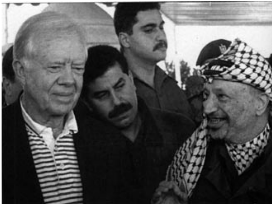
Jimmy Carter tillsammans med en av sina favorittyraner i Mellanöstern, framlidne PLO-ledaren Yassir Arafat.