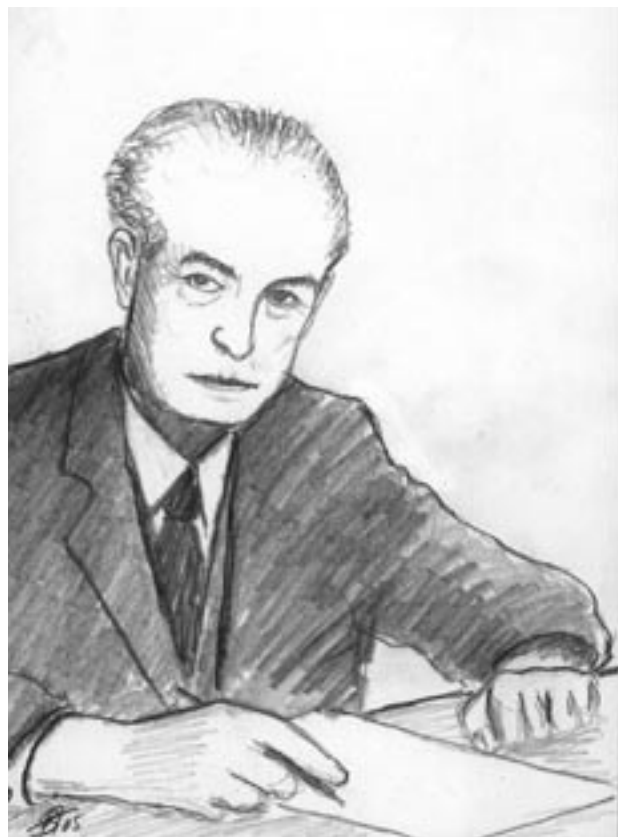
Torgny Segerstedt är mest känd som övertygad motståndare till nazismen men han var också antikommunist och försvarsvän.

Lund, staden han hade kallat "den lilla staden med det stora skvallret, som utdikat och torrlagt så många själar". Innan han utnämndes till professor i Stockholm hade Segerstedt kontaktat Göteborgs Handels- & Sjöfartstidning (GHT) som tagit hans parti vid disputationen i Upp-