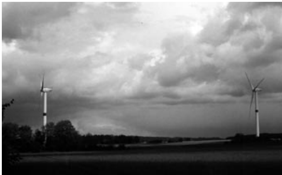
Vindkraftverk – en vanlig syn i exempelvis norra Tyskland (som här) och Danmark. En väsentlig, och energimässigt oerhört ineffektiv, del i "den hållbara utveckling" som miljöknäppisarna förespråkar.

Israel: kämpande demokrati i Mellanöstern, som av Jan Eliasson och andra glassiga UD-typer förklaras svara "oproportionerligt" när man slår tillbaka mot