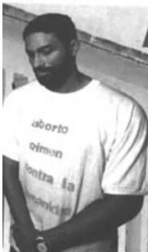
Oscar Biscet, en av Kubas främsta politiska dissidenter. På tröjan står: "Stoppa brotten mot mänskligheten". Mer om Biscet hittar Du på hemsidan www.free-biscet.org

samling av de lokala klubbar som kämpade för mänskliga rättigheter på Kuba.