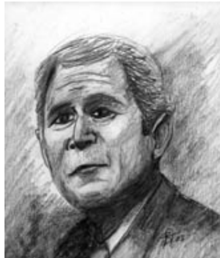
George W. Bush – hatsymbol för den USA-hatande vänstern.

Bög: tidigare mycket negativ term för "homosexuell man", numera ett positivt kodord.