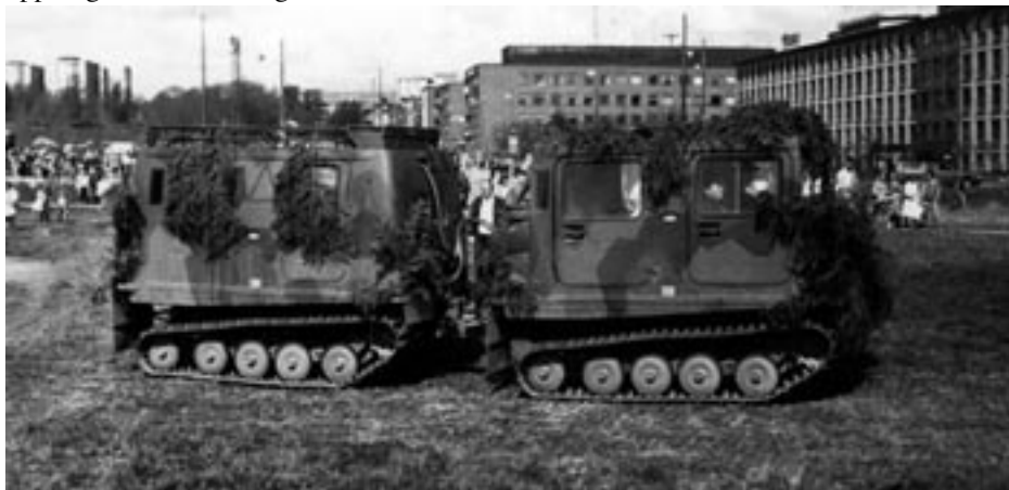
Det svenska så kallade försvarets bandvagnar har blivit en utrotningshotad art i dessa avrustningens tider.

Denna uppställning visar att försvarsmakten, som vi känt den, inte längre existerar. Kvar finns några tusen aktiva befäl och soldater som i bästa fall anser att de utför en meningsfull uppgift när det skickas ut på FN- och andra internationella uppdrag, forslar bort fåglar som drabbats