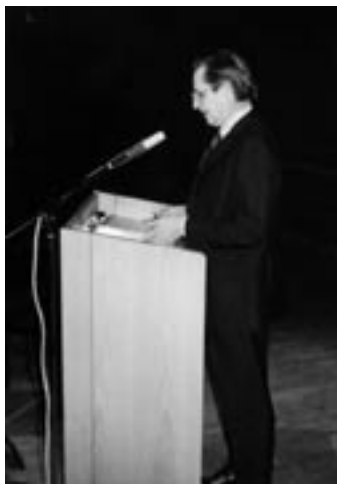
Olof Palme – helgongestalt för snyftväns-tern.

Projektet: term som används för att visa att en viss kategori människor i själva verket har en uttänkt plan för att nå vissa syften – till exempel "det feministiska p.", "det