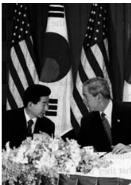
Presidenterna Bush (t h) och Roh möts i Bangkok.

De säkerhetsgarantier Bush gav i Bangkok förutsattes ingå inom ramar för ett multilateralt samarbete i Nordostasien, förutsatt att Nordkorea visar att man menar allvar med att vilja upphöra med sina ansträngningar att