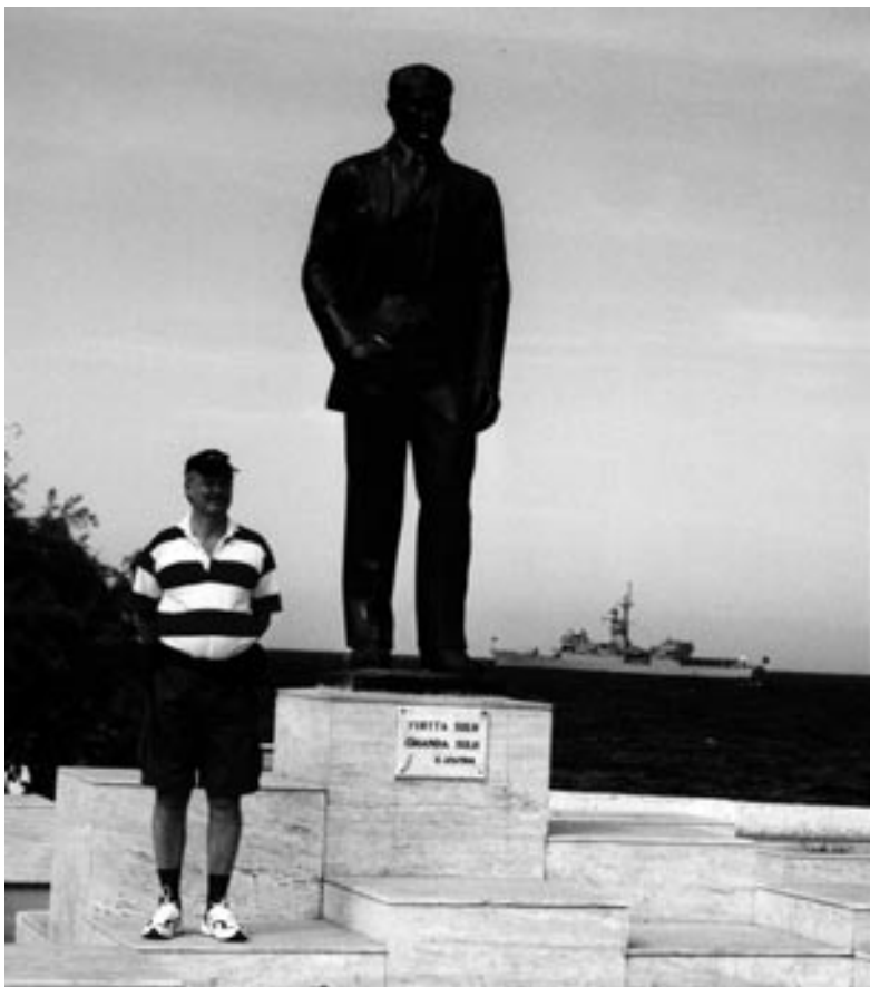
Artikelförfattaren vid sidan av den på norra Cypern allestädes närvarande statyn av Kemal Atatürk, här i hamnen på staden Girne (Kyrenia). I bakgrunden syns ett av de turkiska örlogsfartyg som låg utanför staden. På sockeln finns ett ofta återkommande Atatürk-citat: "För fred i Turkiet och för fred i hela världen".

restaurangägare som vill göra bra affärer. Den ryska maffian har sett möjligheterna att utnyttja det grekcypriotiska banksystemets möjligheter att tvätta pengar och de många kommunisterna på södra Cypern har sedan gammalt nära kontakter med Ryssland. Det uppskattas att minst 50 000 ryssar är bosatta på (södra) Cypern.