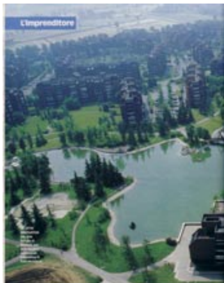
En Berlusconi-stadsdel med nöjda invånare

I valet två år senare, år 2001, vann koalitionen med Forza Italia i spetsen en överlägsen seger och Silvio var tillbaka som premiärminister. En klar majoritet av de italienska väljarna stödde Silvios omfattande reformprogram på områden som statsekonomin (kaotisk och förd enligt obsoleta demagogiska principer), skolan (förbättra den statliga skolan, vilket till en del nu har gjorts, samt att ge privatskolor en reell möjlighet att konkurrera med statliga skolor), skatter (lägre och färre till antalet, vilket samtidigt gör dem effektivare och svårare att smita ifrån), den fria företagsamheten (mindre kostsam byråkrati för företagen samt lägre skatter), starkare och effektivare försvar, kompromisslös kamp mot terrorismen (både den inhemska, de röda brigaderna i första hand, och den internationella) med mera. Detta program är nu på väg att genomföras men det tar naturligtvis sin tid, särskilt som vänstern gör allt för att streta emot. Inte bara i parlamentet, där de konsekvent motsätter sig alla förslag från höger-mittenkoalitionen – till skillnad från denna som, när den var