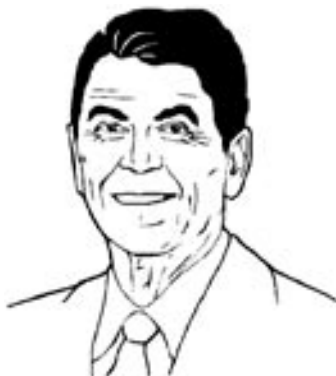
Ronald Reagan. En riktig lustigkurre i Vita huset.

"En sovjetisk hemmafru var i starkt behov av ett nytt kylskåp. När hon lämnade in beställningsordern fick hon höra att det skulle ta tio år att leverera den efterfrågade faciliteten. 'Kommer du på morgonen eller på kvällen?' frågade hon kylskåpsförsäljaren. 'Kamrat', svarade då den senare, 'som jag sa tar leveransen tio år. Varför i all världen behöver du då veta om vi kommer med kylskåpet på morgonen eller på kvällen?' 'Därför att rörmokaren kommer