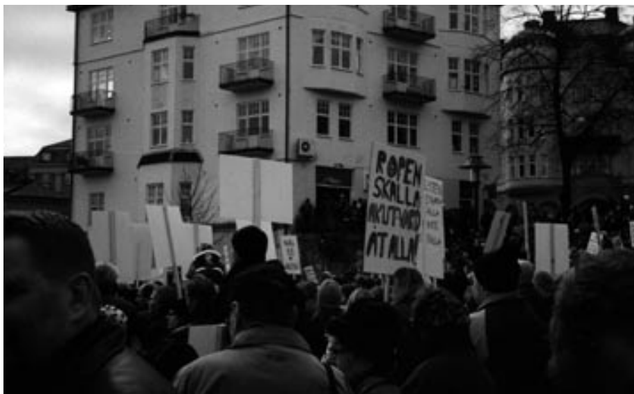
Många demonstrerade för att Södertälje och Norrtälje sjukhus skulle räddas undan landstingsmajoritetens besparingsförslag. Här vid Marenplan i Södertälje.

Sällan har väl det gamla talesättet "Att vara liberal är att vara kluven" framgått så klart som vid Folkpartiet liberalernas landsmöte i Västerås i november. För en