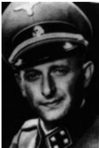
Adolf Eichmann som SS-officer.

Raoul Wallenberg tvekade inte att förhandla direkt med den fruktade Eichmann, vilket den senare fann alltmer irriterande. "Jag varnar er", sade Eichmann vid ett tillfälle, "jag skall göra allt som står i min makt för att sätta stopp för era förhävanden och, om jag så finner nödvändigt, röja er ur vägen. Då lär inte ens ert svenska pass hjälpa er. Även neutrala diplomater kan råka ut för olyckshändelser." Mycket riktigt – samma månad som denna varning utfärdades körde en av SS-kommandots lastbilar in i Wallenbergs bil. Den svenske diplomaten färdades vid tillfället dessbättre i en annan bil.