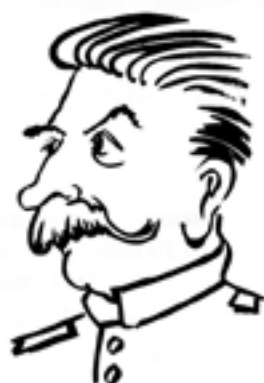
Föredrog Hagberg framför Linderoth.